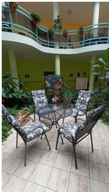
Atrium Domova Modrý kámen