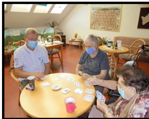
Spolupráce s dobrovolníky