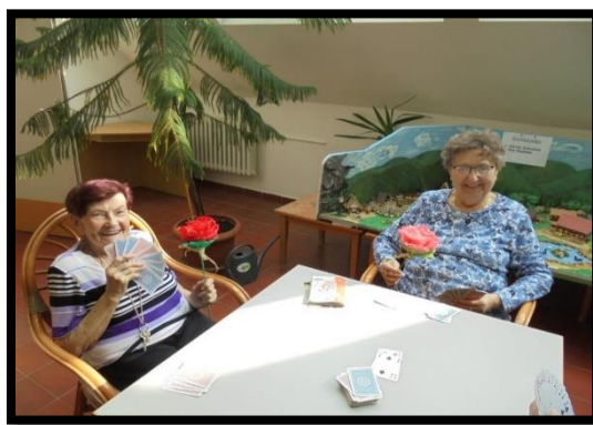
Oslava MDŽ dne 8.3.2020