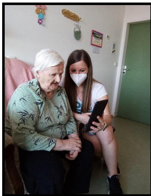
Zajištění komunikace mezi našimi uživateli a jejich blízkými.