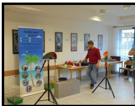
Vystoupení papoušků v našem zařízení v únoru 2020.