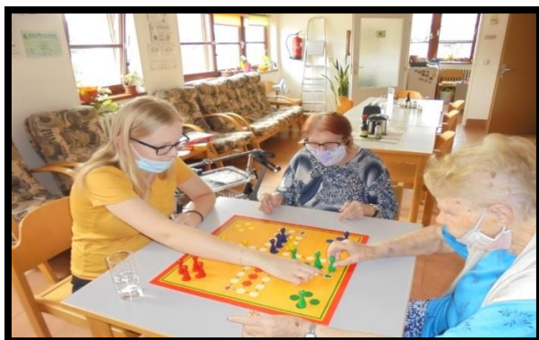
Společenské hry s našimi dobrovolníky.