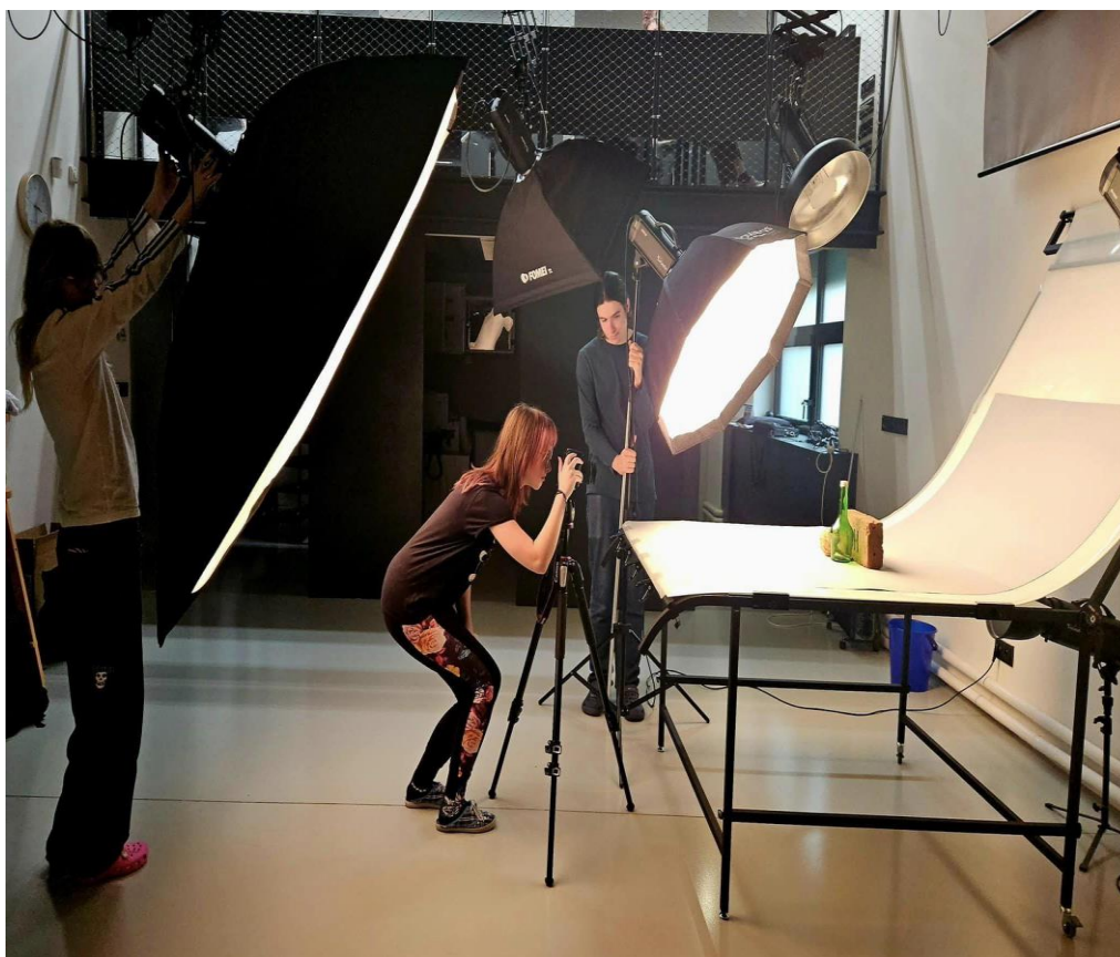
Práce žáků ve fotoateliéru

Nákup dlouhodobého hmotného majetku probíhal v režimu náhrady za opotřebovaný a nefunkční majetek.