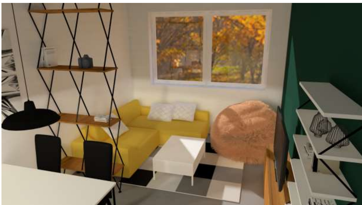
Design interiéru a bytových doplňků