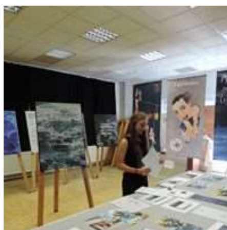
Prezentace praktické maturitní zkoušky – grafický design