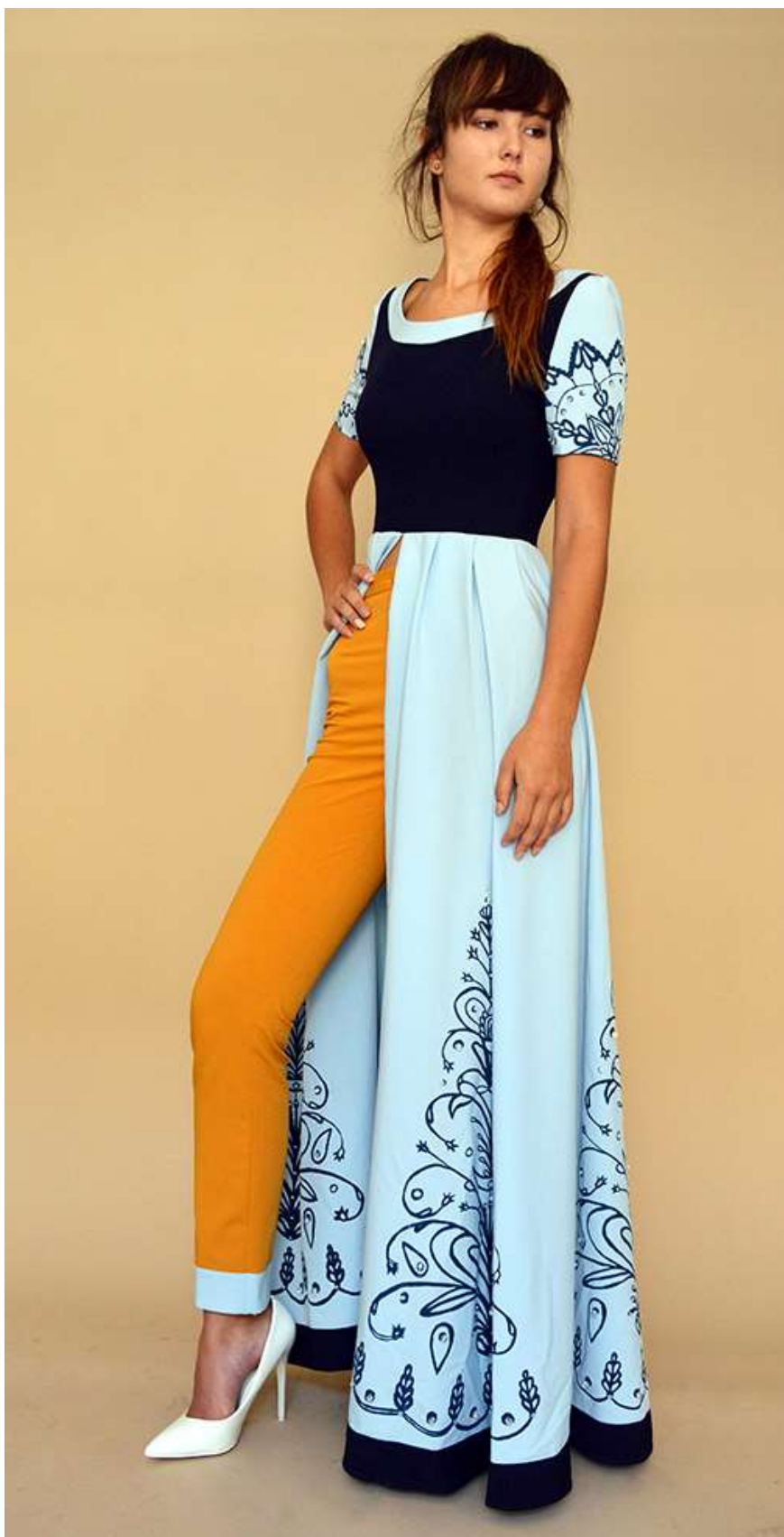
„DIALOG“ výstava a přehlídka - 26. červen 2019