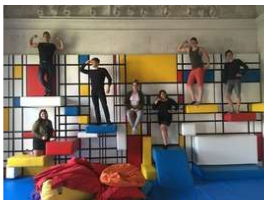
Odborná praxe v GASKU

Žáci studující obor produkční činnost v umění a reklamě pracovali v rámci odborné praxe na Výstavišti v Lysé nad Labem a v PVA Letňany, v Galerii hlavního města Prahy, v Galerii Středočeského kraje aj., kde se podíleli na organizaci a provozu výstav.