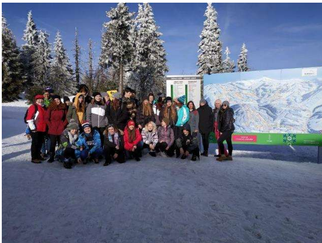
Lyžařský kurz – březen 2019

V týdnu od 3. do 7. března absolvovalo 28 žáků 1. ročníků lyžařský kurz. Byli ubytováni na horské chatě Svornost v Peci pod Sněžkou. Chata stojí na hlavní sjezdovce Zahrádky s nově postavenou čtyřsedačkovou lanovkou, což bylo největším bonusem pro zdatné lyžaře.