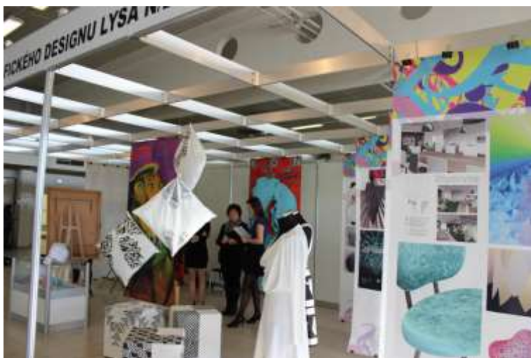
Výstavní stánek školy

Výstavu opět spolupořádala Krajská hospodářská komora Střední Čechy. Na Výstavišti v Lysé nad Labem se škola prezentovala výstavním stánkem. Pro návštěvníky byla připravena kromě stánku s ukázkami prací žáků všech studijních oborů i série módních přehlídek. Ty prezentovaly náročnost krejčovského řemesla.