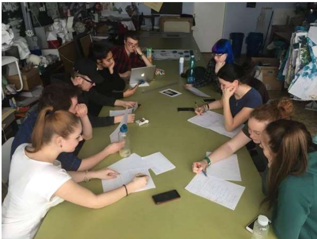
Práce na společném projektu STRUKTURY