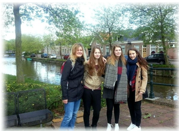
Bolsward – projekt „VODA“