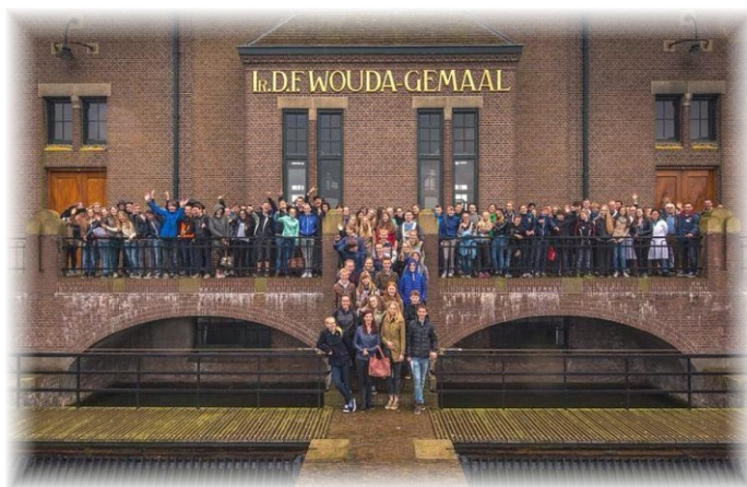
Bolsward – projekt „VODA“

Mezinárodní projekt programu Erasmus + Spolupráce škol na téma „Voda“.