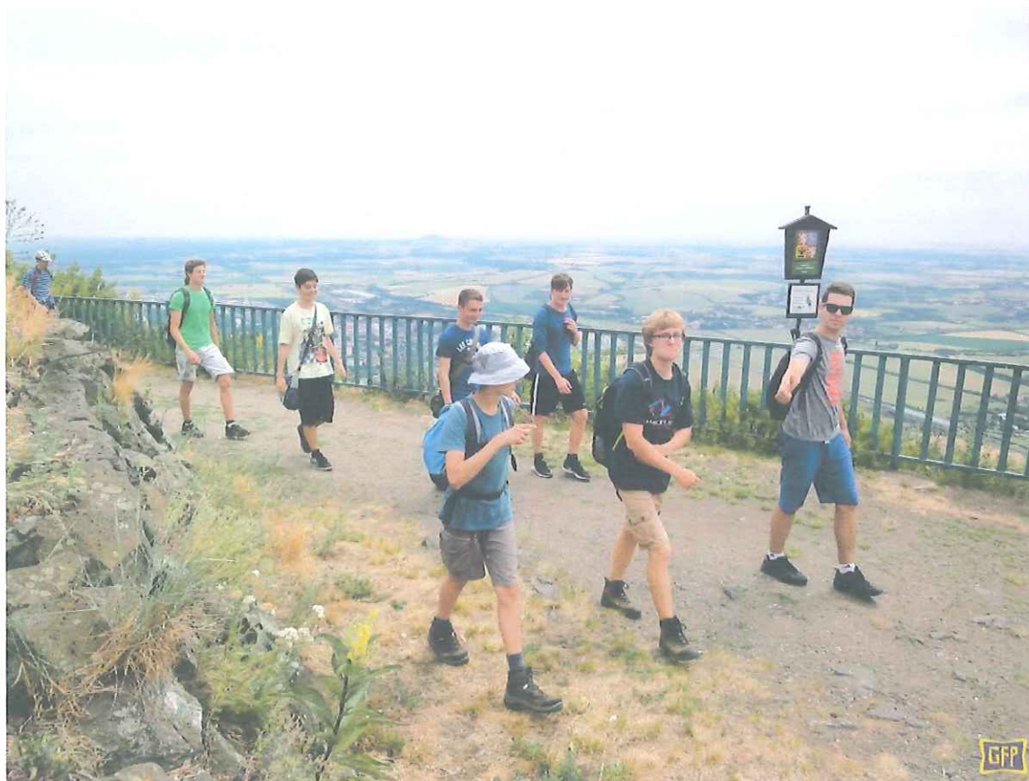
(dílna – Vzhůru na Lovoš)