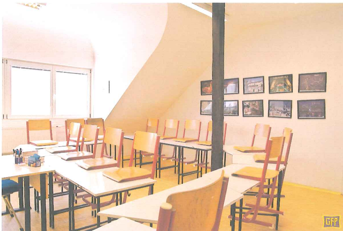
(Pracovna francouzského jazyka a latiny )