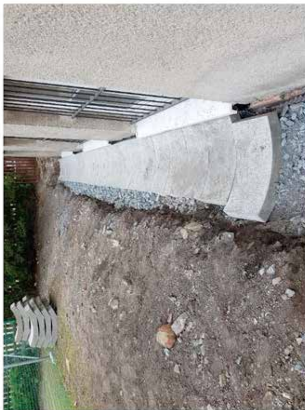
- severní a západní strana budovy