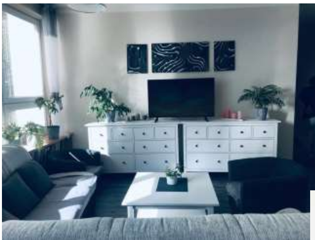
Společenské prostory ve službě Domov

Stávající prostory v domově byly v roce 2021 kompletně zrekonstruovány a vybaveny novým nábytkem. V roce 2022 jsme se věnovali dovybavení a doplňkům. Klientům a klientkám tak poskytují v tomto ohledu komfortní bydlení.