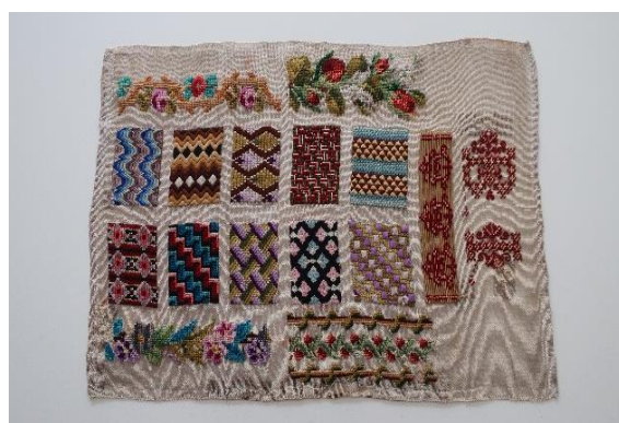
Vzorník vyšívání, konec 19. století, vlna, kanava, 38 x 56 cm, př. č. 480/2022, SM