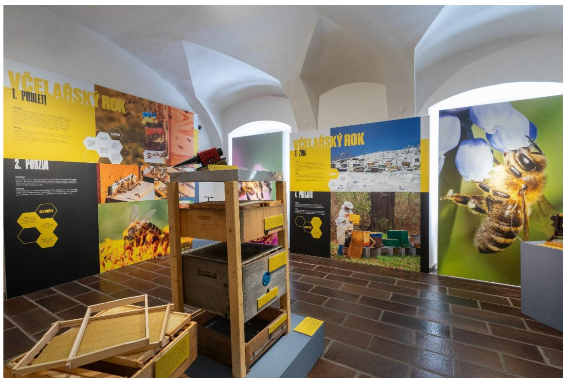
Pohled do výstavy Včely a jejich svět