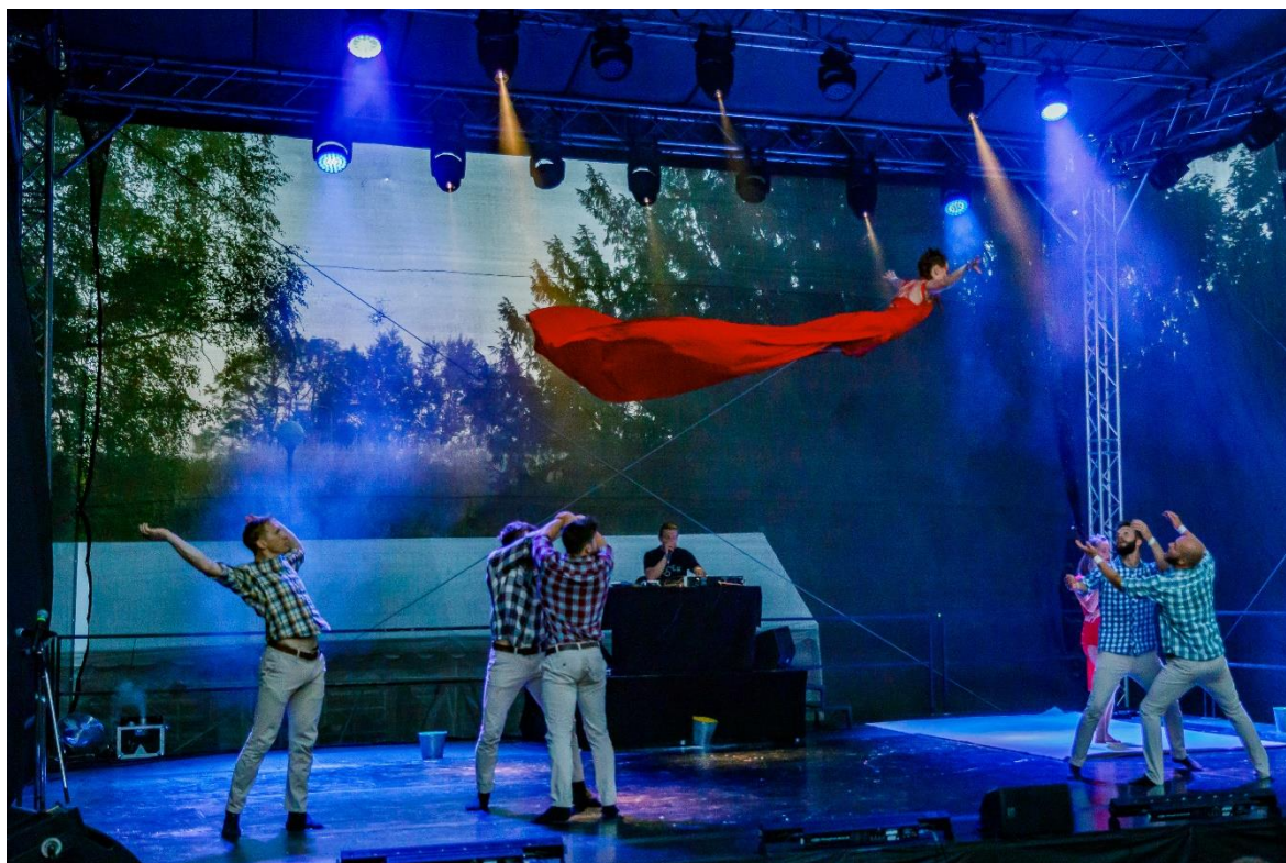
Léto na zámku – představení skupiny The Loser(s)