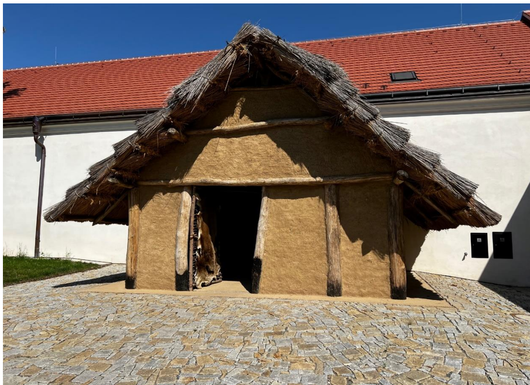
Roztoky – Expozice Archevita – Stopami věků