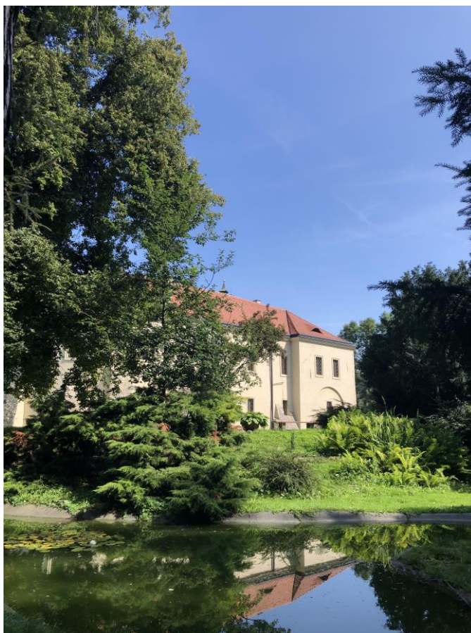
Roztoky – pohled z parku na zámek