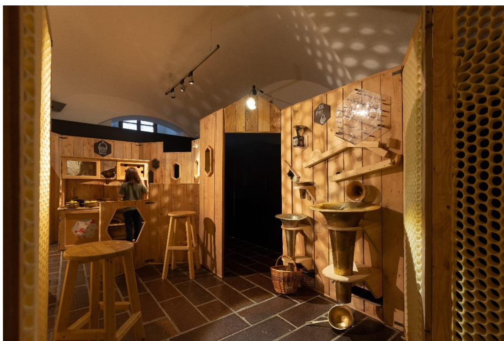
Pohled do výstavy Včela: Cesta do včelího města