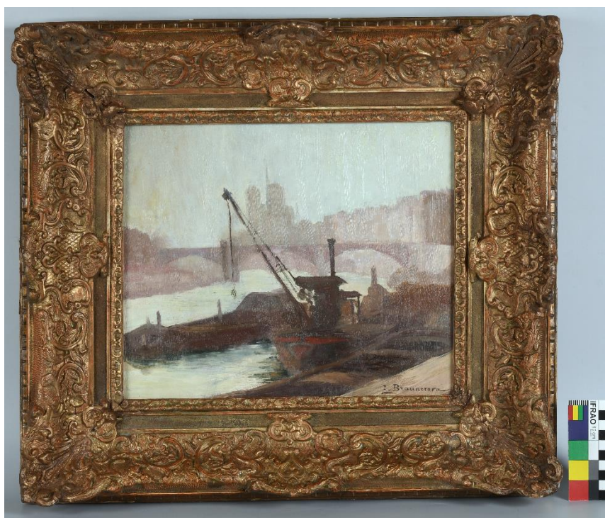
Zdenka Braunerová, Paříž, kolem roku 1885, olej na plátně, 29 cm x 35 cm, př. č. 40/2022, SM