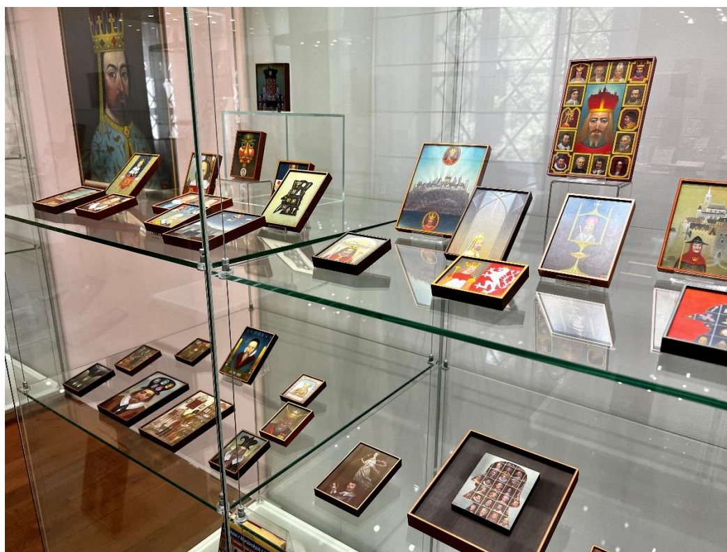
Pohled do výstavy Jindřich Ulrich. Obrázky a drobnosti