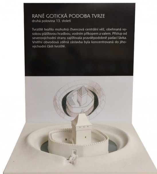
Model raně gotické podoby tvrze

Zámek je možné si nejen prohlédnout a navštívit, ale i osahat. Jak se v průběhu své historie přeměnil ze středověké tvrze s vodním příkopem v palác z doby Lucemburků, až po dnešní podobu ukazuje pět hmatových modelů , které dokumentují jednotlivé stavební etapy budovy a vznikly díky realizaci projektu Zpřístupnění nových expozic Středočeského muzea v Roztokách u Prahy pro nevidomé a slabozraké. Projekt byl realizován za finanční spoluúčasti Ministerstva kultury ČR.