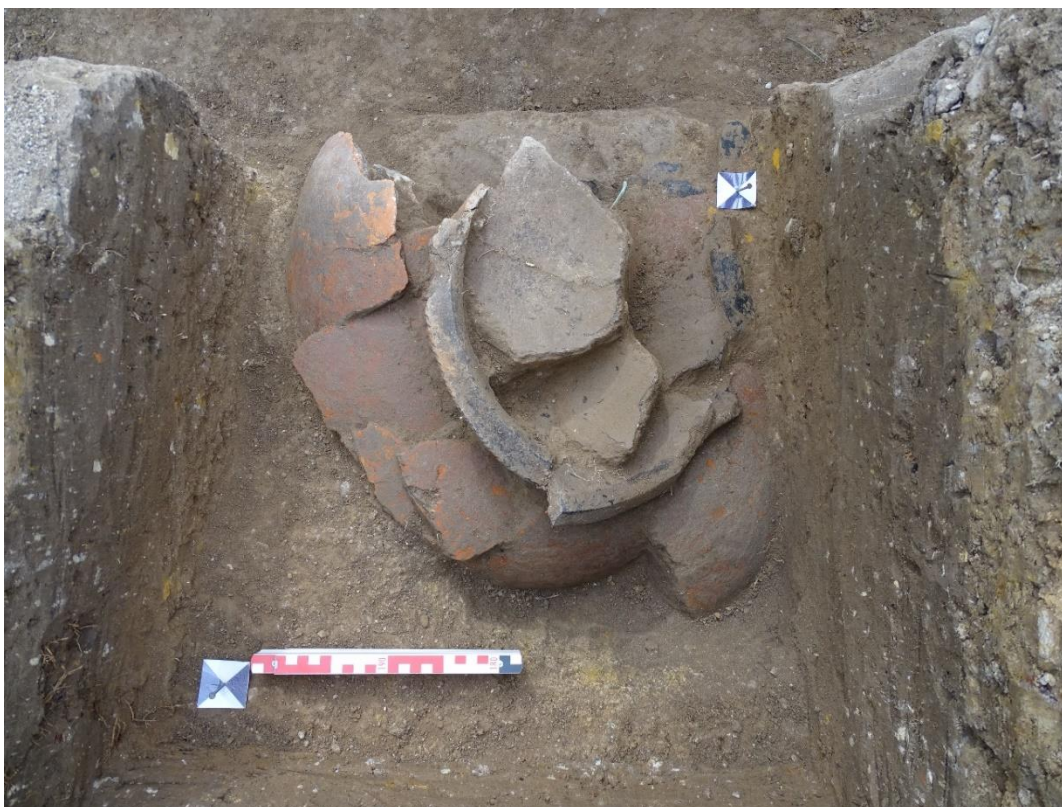
Vypreparovaná pohřební nádoba, urna z doby bronzové, ZAV Tuchoměřice, parcela č. 306/58.

Historický fond muzea byl v roce 2022 doplňován podle plánu sbírkotvorné činnosti a v souvislosti s plněním výzkumných a dokumentačních úkolů interních a programových projektů formou darů, převodu od jiných institucí, nákupy a ve výjimečných případech vlastním sběrem. V souladu s Konceptí sbírkotvorné činnosti (plánu investic Středočeského kraje) byl v roce 2022 realizován nákup sbírkového předmětu – Telluria (1875–1914, zn. J. Felkl a syn, pomůcky znázorňující oběh Země kolem Slunce a měsíční fáze). Zmíněný předmět rozšířil stávající soubor glóbů vyráběných v minulosti firmou Jan Felkl a syn v Rostokách a doplnil tak dlouhodobě budovanou kolekci těchto sbírkových předmětů, do jejichž pořízení zřizovatel investoval již v předešlých letech. V rámci etnografické podsbírky se povedlo instituci uskutečnit díky dotačnímu programu MK ČR nákup souboru podmaleb na skle a získalo také rozsáhlou a výjimečnou kolekci papírových betlémů, jejímuž zpracování se bude odborné oddělení věnovat v následujícím roce.