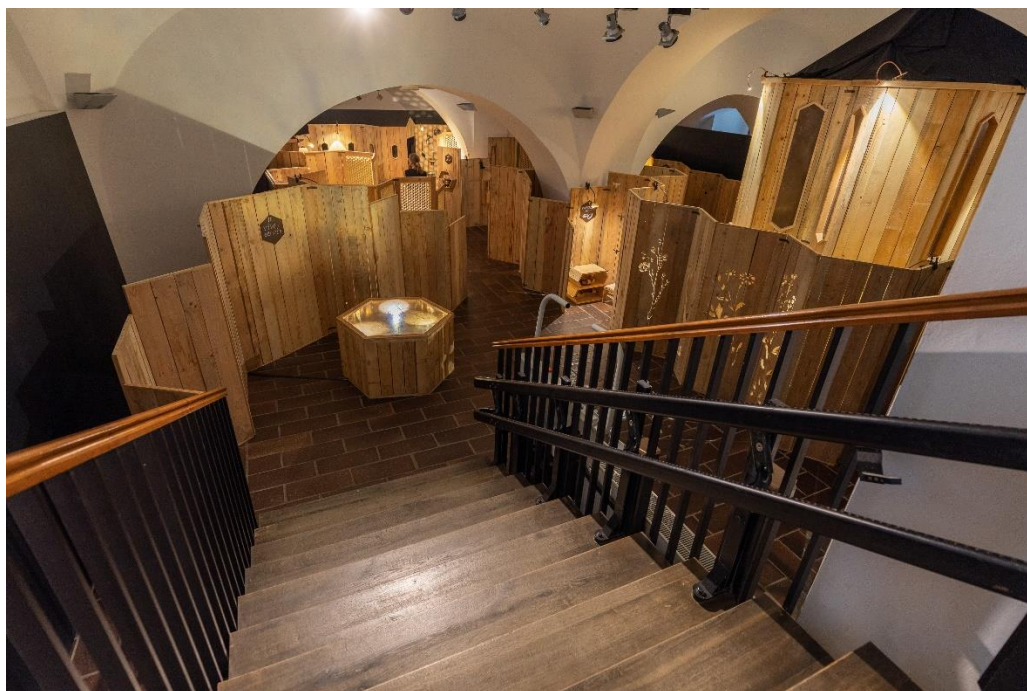
Pohled do výstavy Včela: Cesta do včelího města