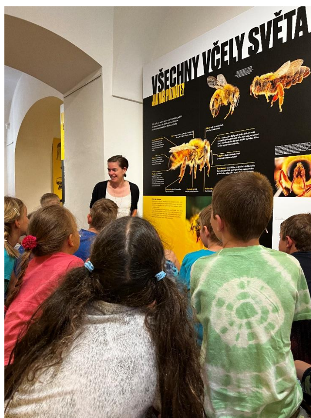
Lektorský program k výstavě Včely a jejich svět