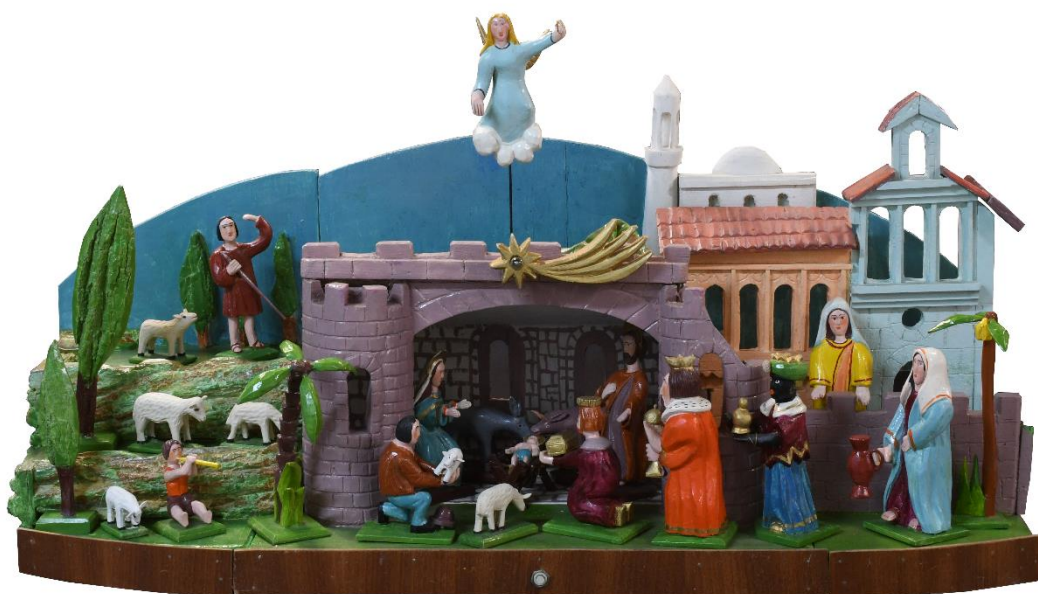
Antonín Zeman, Betlém, 1993, barevná překližka, př. č. 799/2022/1, SM