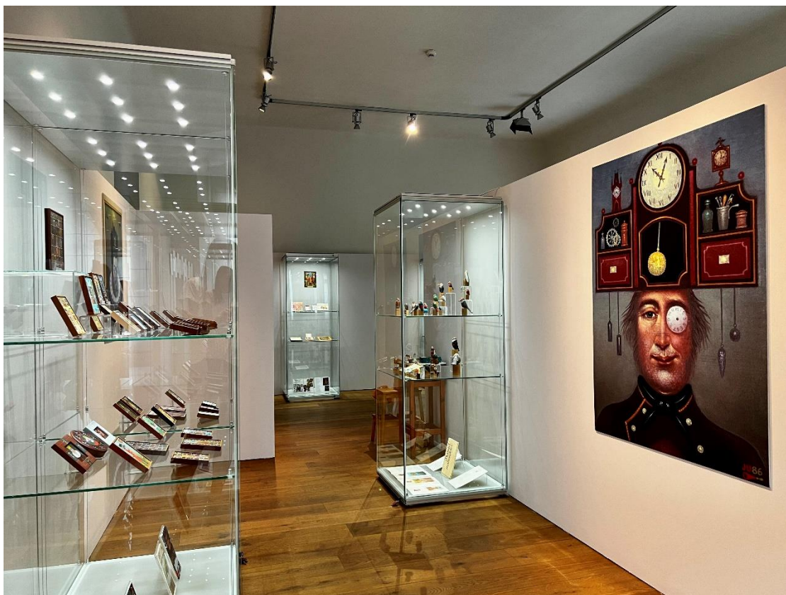
Pohled do výstavy Jindřich Ulrich. Obrázky a drobnosti