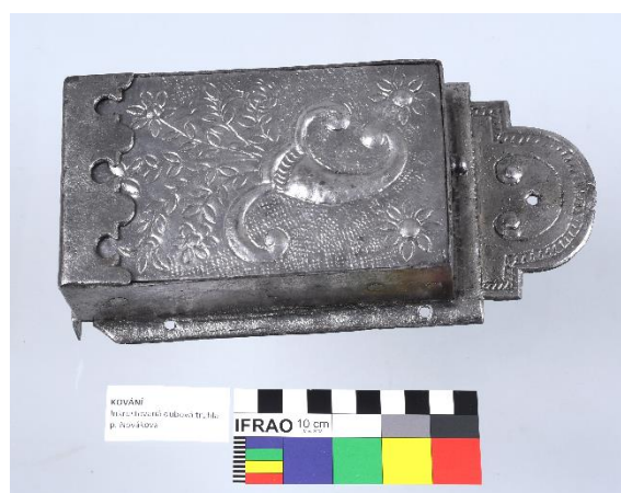
Kování na truhlu (část většího souboru), druhotně použité rokokové kování na truhle z 19. století, železo, měď, cín, soukromá sbírka