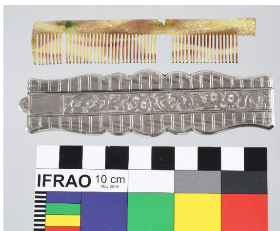
Stříbrné pouzdro s hřebínkem, 1. polovina 20. století, stříbro, celuloid, původní papírový obal, 11, 3 x 2, 7 cm, př. č. 49/2022, SM