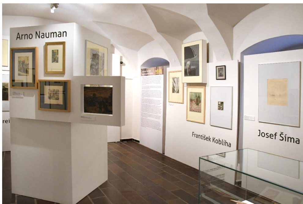
Pohled do výstavy Hollar – napříč generacemi s díly Františka Koblihy, Josefa Šímy a Arno Naumana