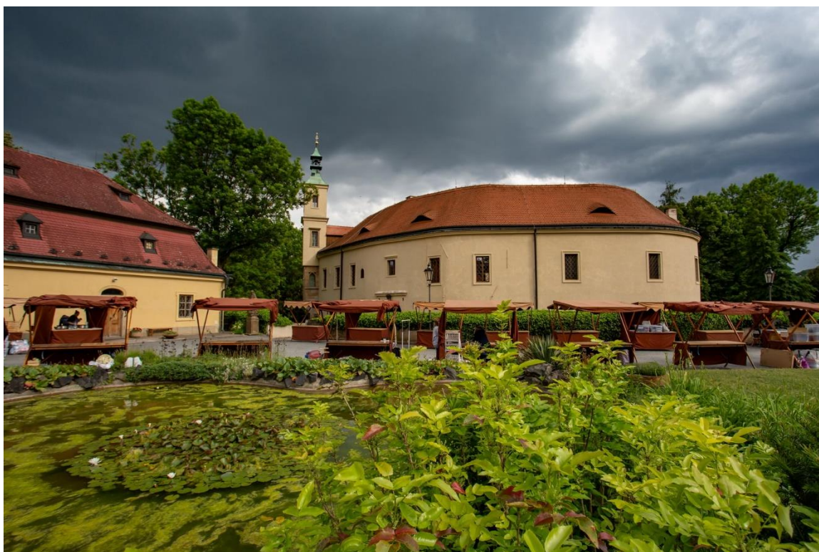
Roztoky – pohled na zámek