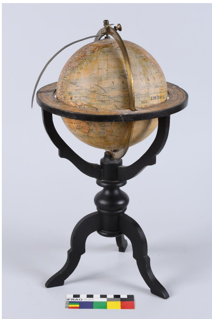
Glóbus zn. J Felkl a syn Roztoky, 3. třetina 19. století, sádra, kov, dřevo, př. č. 1078/2022a, SM