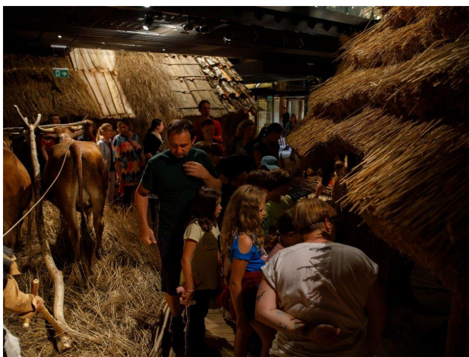
Roztoky – Pohled do expozice Archevita – Stopami věků

V dubnu 2022 se rozšířila nabídka muzea směrem k veřejnosti o novou stálou expozici zaměřenou na období pravěku a propojující archeologii s moderními technologiemi. Expozice zahrnuje původní typy obydlí v měřítku 1:1, archeologické nálezy nebo rekonstrukce pohřebních celků. Je doplněna rovněž počítačovými perspektivami a holografickými projekcemi, představuje pravěké exponáty doplněné modelacemi hrobů, včetně videomappingu. Nabízí dětský koutek nebo hravé a vzdělávací prvky v podobě infokiosků s rozšířenou informační základnou.