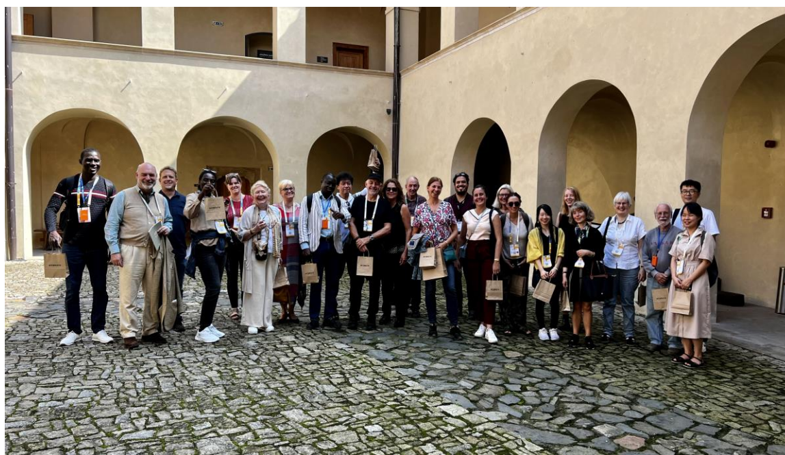
Účastníci Mezinárodního zasedání ICOM na návštěvě Středočeského muzea v Roztokách u Prahy