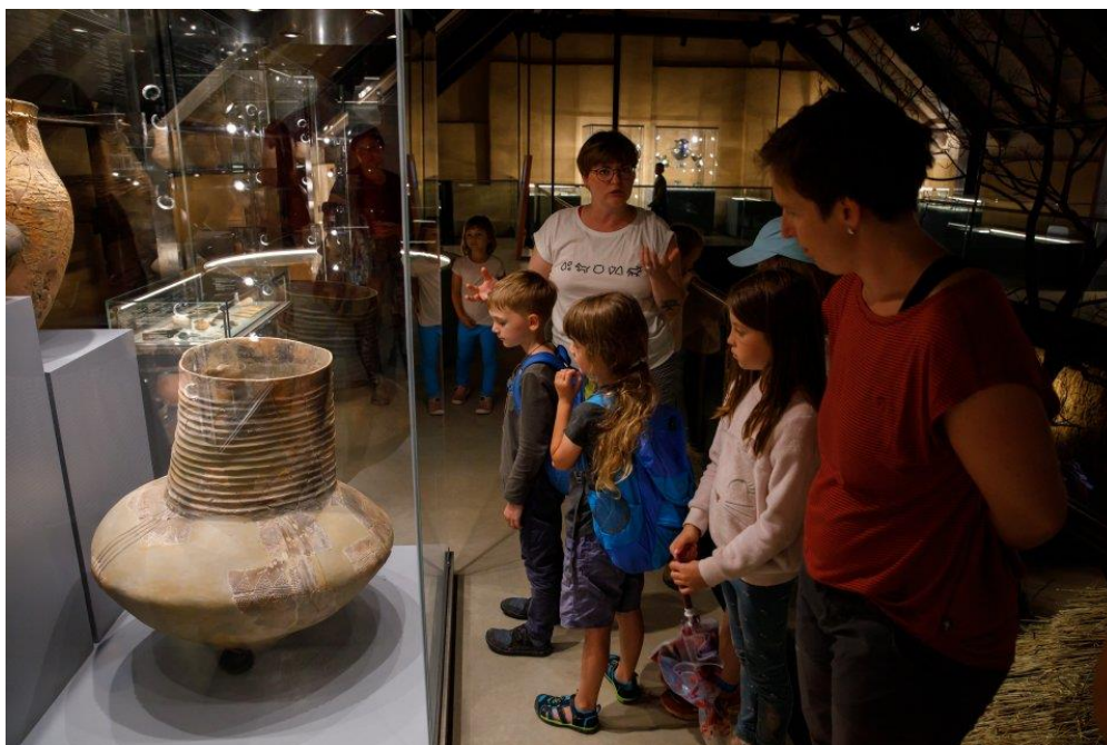
Den s Archevitou – lektorský program