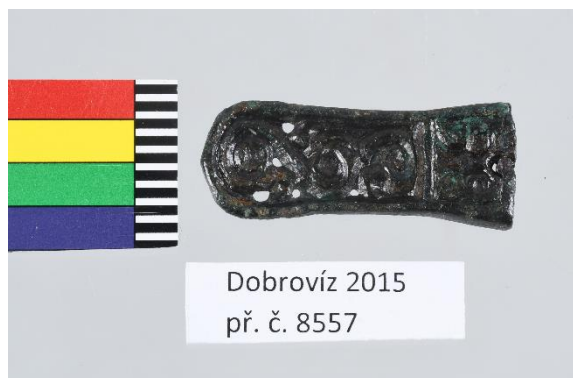
Avarsko-slovanské nákončí opasku, 8. – 9. století n. l., bronz, 5 x 1, 5 cm, př. č. 8557, SM