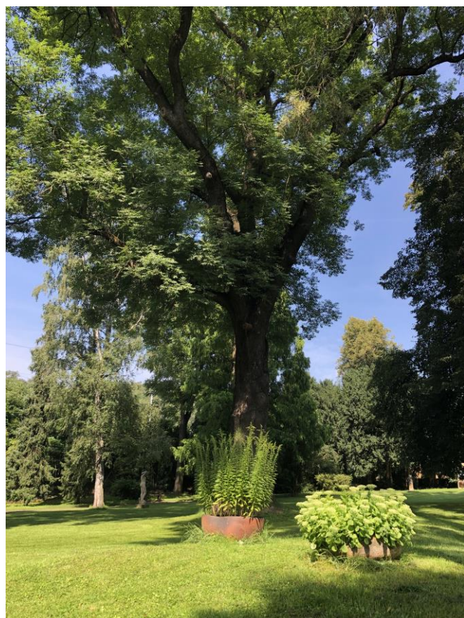
Roztoky – pohled do zámeckého parku