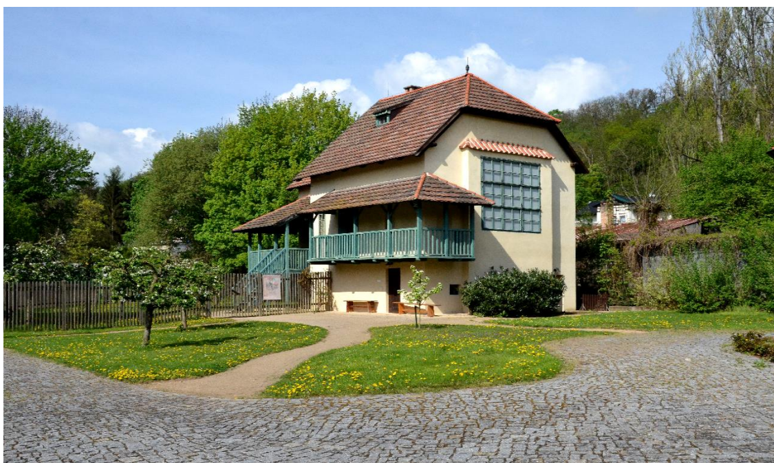
Roztoky – Ateliér Zdenky Braunerové