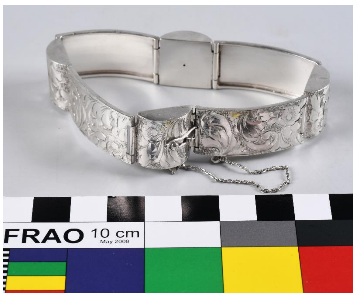
Dámský náramek s rytým rostlinným motivem, 1928–1942, stříbro ryzosti 800/1000, ø 9,5 cm, př. č. 53/2022c, inv. č. H 79476/c, SM