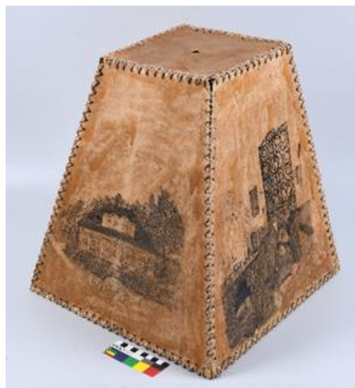
Papírové stínítko na lampu s plánem vily č. p. 14 v Roztokách, 1-2. třetina 20. století, kov, papír, 50 x 40 x 40 cm, př. č. 148/2022, SM