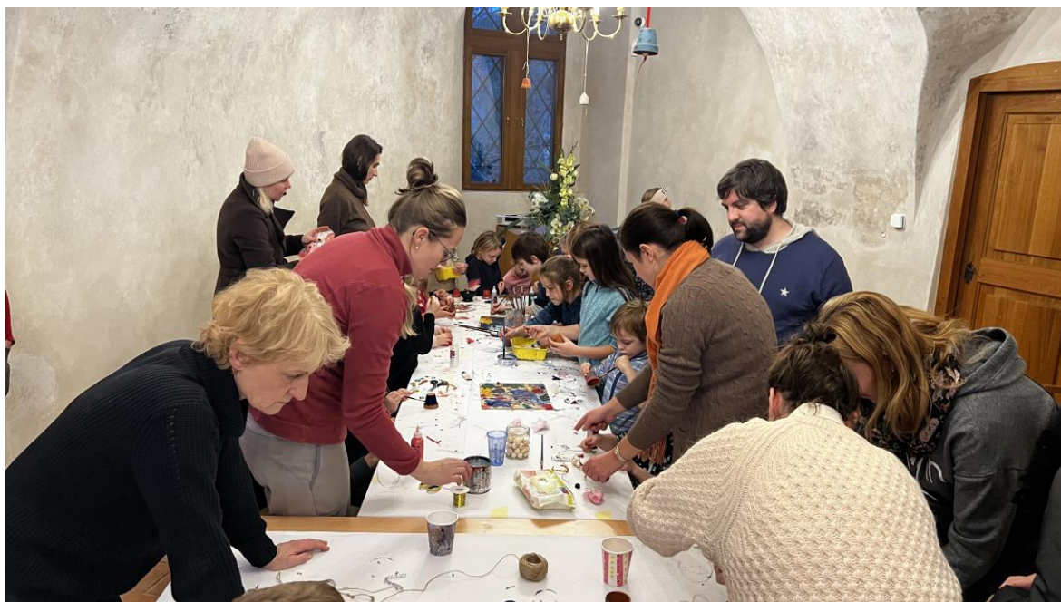
Advent – workshop Ozdoby z vizovického těsta