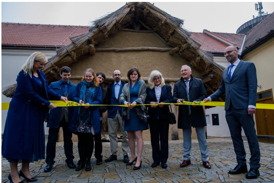
Slavnostní otevření expozice Archevita – Stopami věků 22. 4. 2022

V dubnu pak mohla být veřejnosti zpřístupněna nová expozice nabízející zajímavosti z období pravěku od původních typů obydlí v měřítku 1:1, přes archeologické nálezy až po rekonstrukce pohřebních celků. Cílem projektu Archevita – Stopami věků bylo vytvoření moderního prostředí pro prezentaci archeologické sbírky, rozšíření workshopového portfolia o akce s archeologickou tematikou a rovněž o komplexní obnovu objektu bývalé stodoly. Archevita nabízí veřejnosti možnost poznání řady zajímavostí z různých období pravěku a raného středověku. Představuje interaktivní a dobrodružnou cestu dějinami lemovanou nejen rekonstrukcemi obydlí, ale její součástí jsou i počítačové perspektivy, holografické projekce a videomapping a prezentuje největší poklady archeologické sbírky. Expozice je doplněná infokiosky, které edukativní i hravou formou nabízejí širokou škálu informací. Pro malé návštěvníky je připraven zábavný dětský koutek s interaktivním pískovištěm.