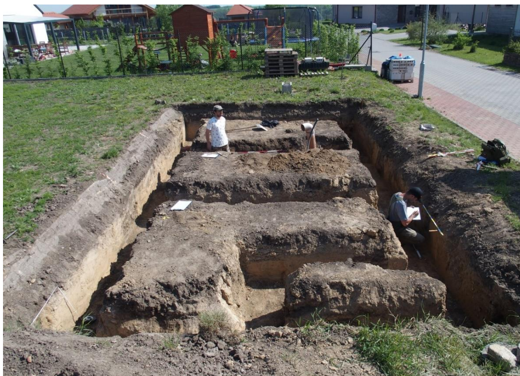
Záchranný archeologický výzkum (ZAV) odhalil pod budoucím zahradním domkem v Holubicích (parcela č. 244/7) sedm sídlištních jam datovaných od neolitu do starší doby železné.