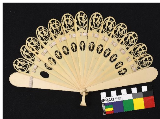
Vějíř, počátek 20. století, barevná varianta celuloidu, hedvábná stužka, 15,5 x 28 cm, př. č. 1079/2022, SM