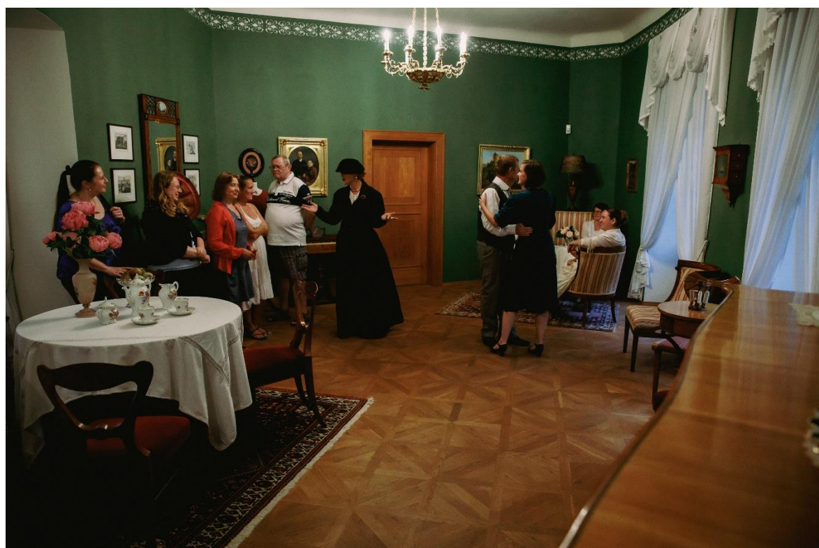
Léto v letní vile – hraná komentovaná prohlídka