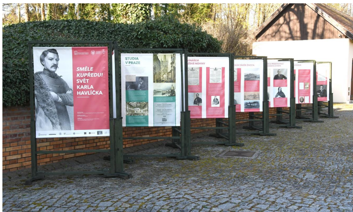
Pohled na exteriérovou výstavu Směle kupředu. Svět Karla Havlíčka Borovského