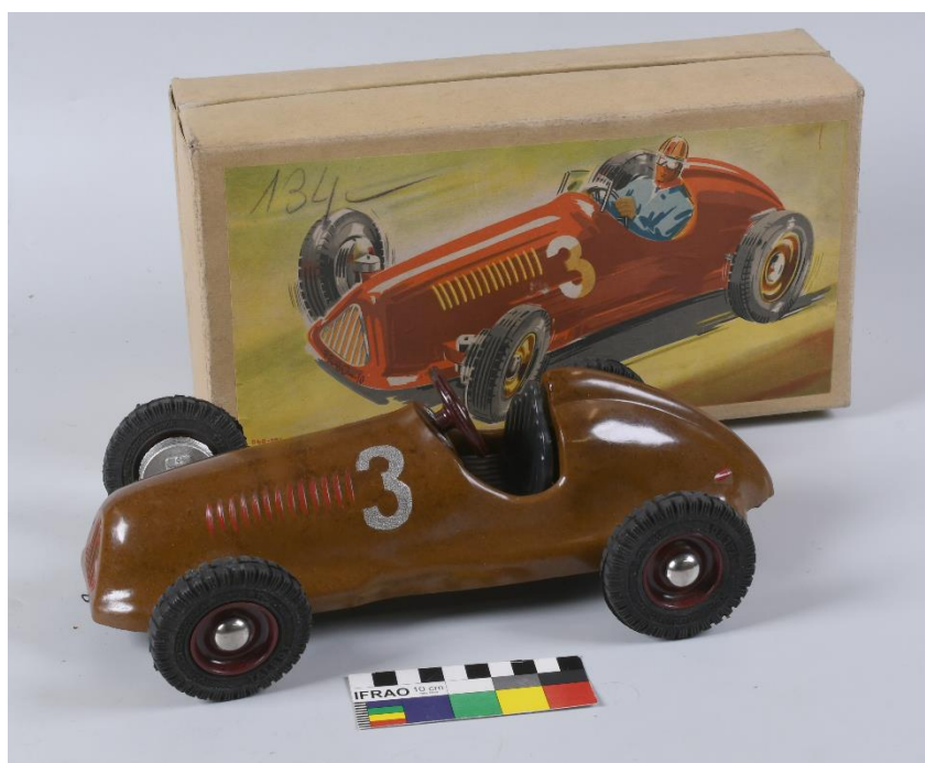
Dětská hračka – závodní auto zn. Talbot, 40. – 50. léta 20. století, bakelit, kov, 30 cm x 9,5 cm, př. č. 41/2022/a-c, inv. č. H 79466/a-c, SM