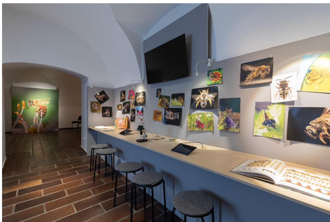
Pohled do výstavy Včely a jejich svět