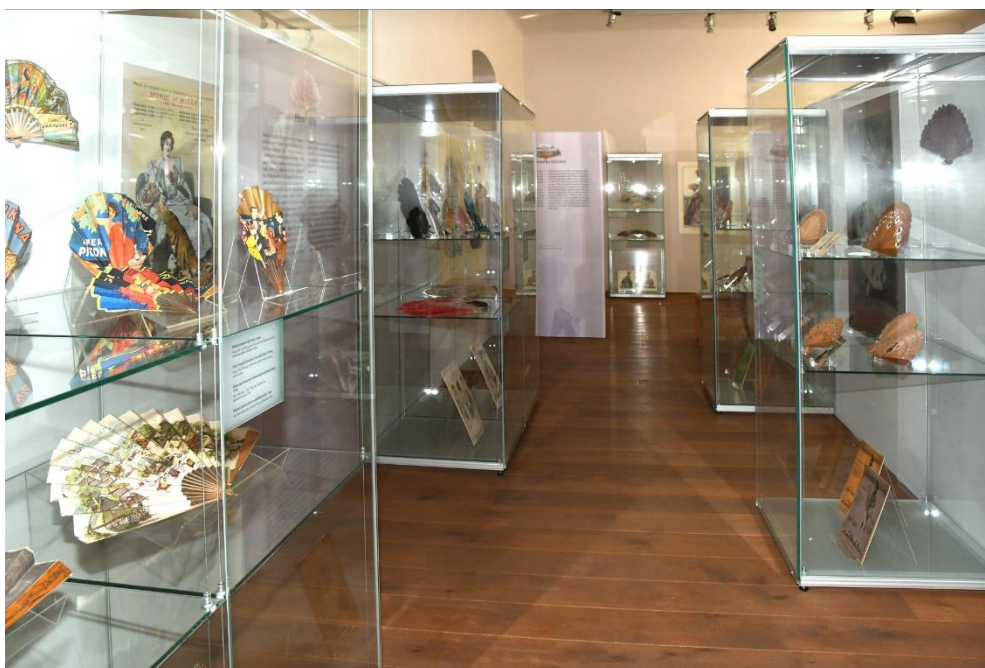
Pohled do výstavy Čarovný svět vějířů