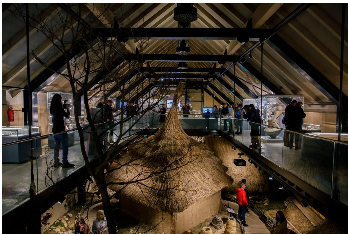
Pohled do expozice Archevita – Stopami věků