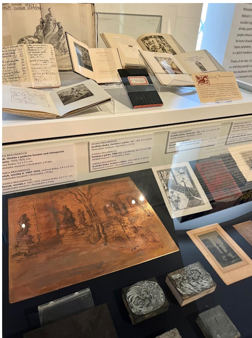
Pohled do výstavy Hollar – napříč generacemi