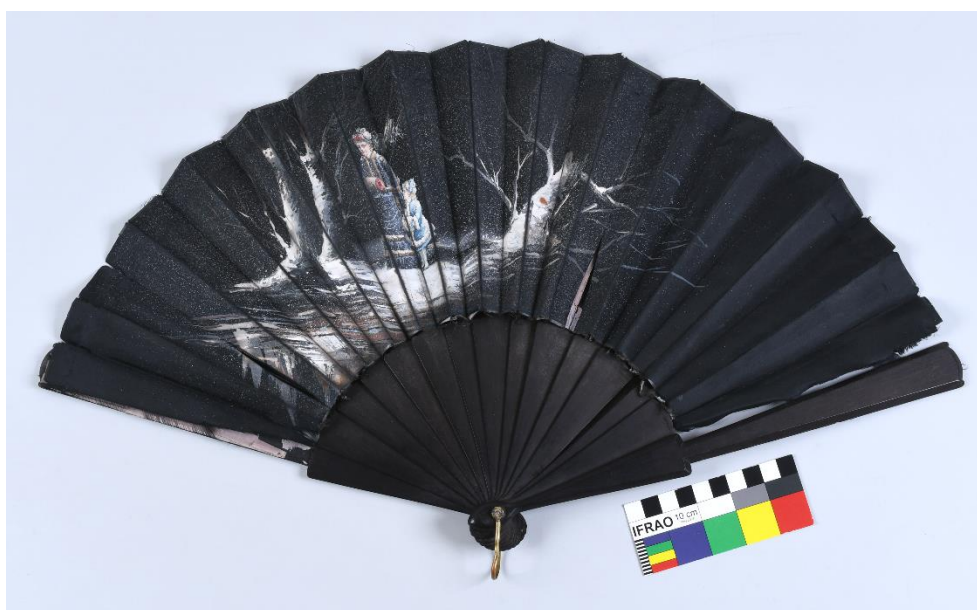
Dámský vějíř, 1880–1900, hedvábí, dřevo, 29,5 cm, př. č. 380/2022