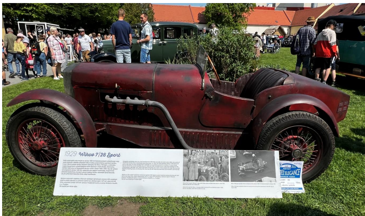
Veteráni na nádvoří zámku