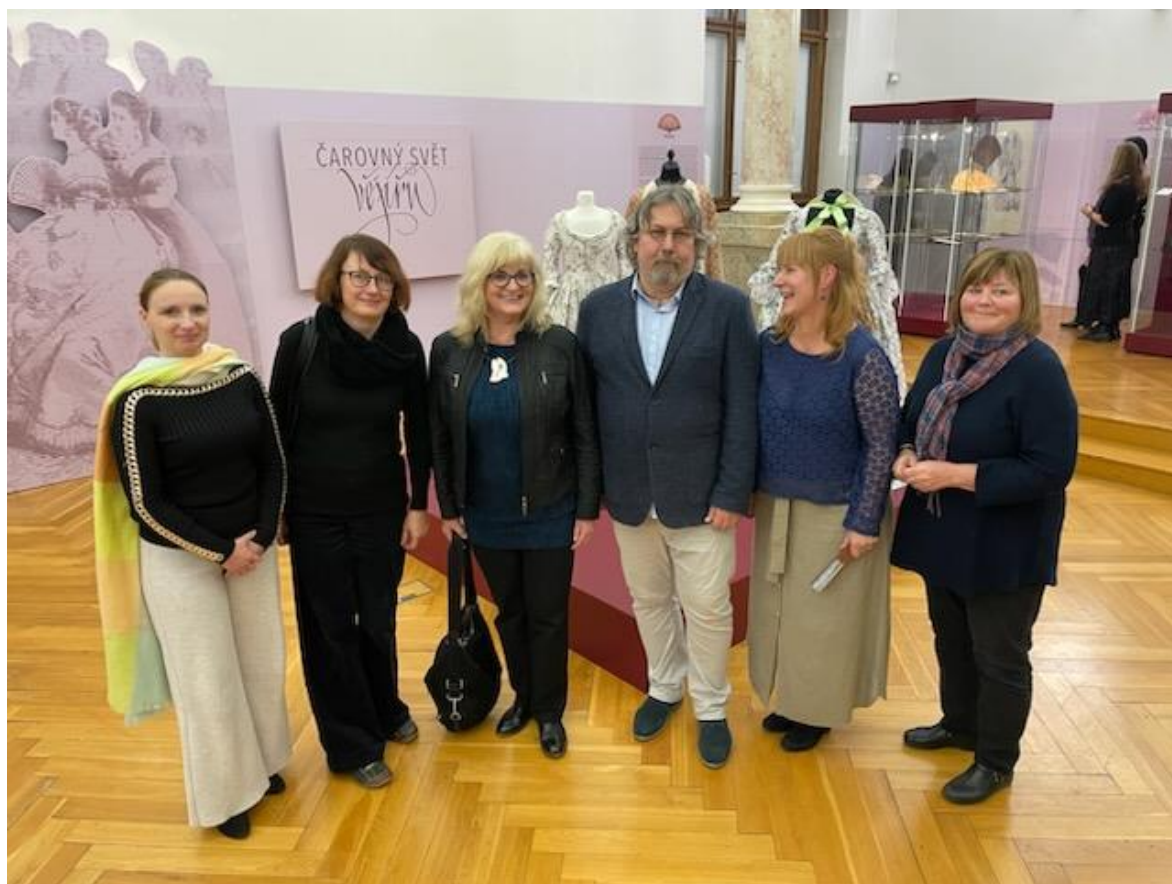
Zahájení výstavy Čarovný svět vějířů v Západočeském muzeu v Plzni připravené ve spolupráci se Středočeským muzeem