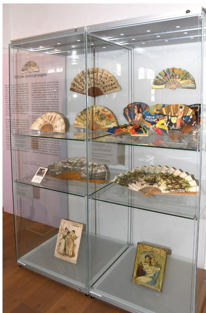
Pohled do výstavy Čarovný svět vějířů