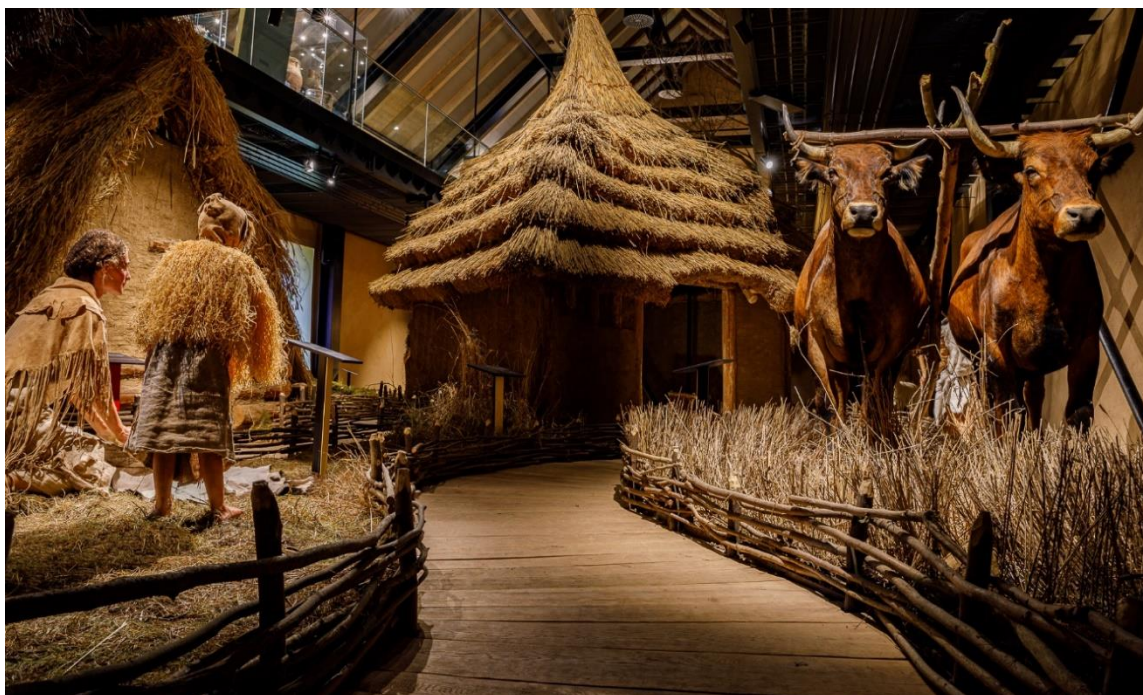
Pohled do expozice Archevita – Stopami věků