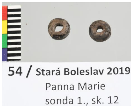
54 / Stará Boleslav 2019 Panna Marie sonda 1., sk. 12

Křížek, novověk, slitina mědi, 5,9 x 3,8 mm, č. výzkumu C-202100531, sáček č. 9, Archeologický ústav AV ČR Praha