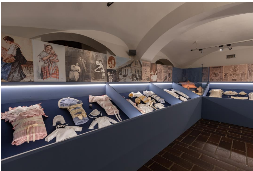
Pohled do Výstavy Vítej mezi námi, děťátko