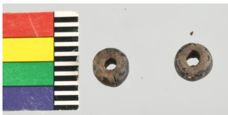
54 / Stará Boleslav 2019 Panna Marie sonda 1., sk. 12