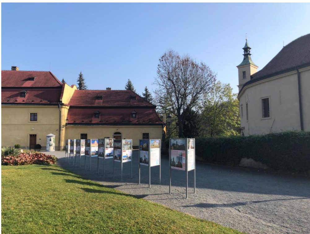
Exteriérová výstava Má vlast, cestami proměn