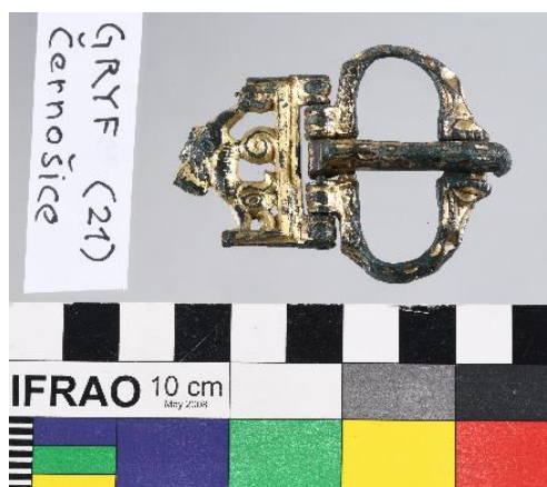
Archeologický nález, přelom letopočtů, bronzová pozlacená spona, tzv. gryf, 6 x 4,5 cm, př. č. bude přiděleno, SM