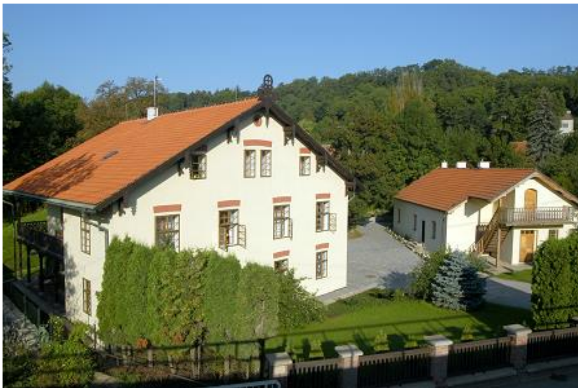
Roztoky – areál Braunerova mlýna, budovy ředitelství, administrativního a odborného pracoviště

Libčice nad Vltavou – areál statku – detašované archeologické pracoviště, depozitáře