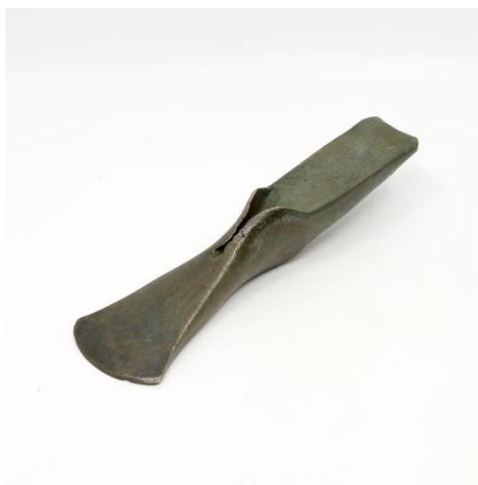
Bronzová sekera s laloky, střední doba bronzová, Roztoky u Prahy, inv. č. A 21542, SM