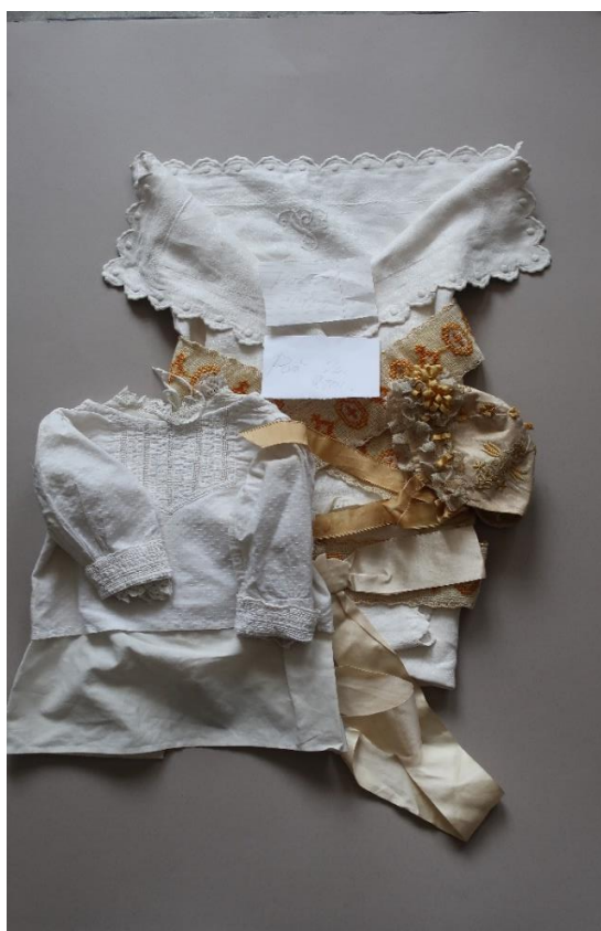
Křtící soupravy, konec 19. století, kanafas, plátno, příze, hedvábí, Sbíрка M. Šormové