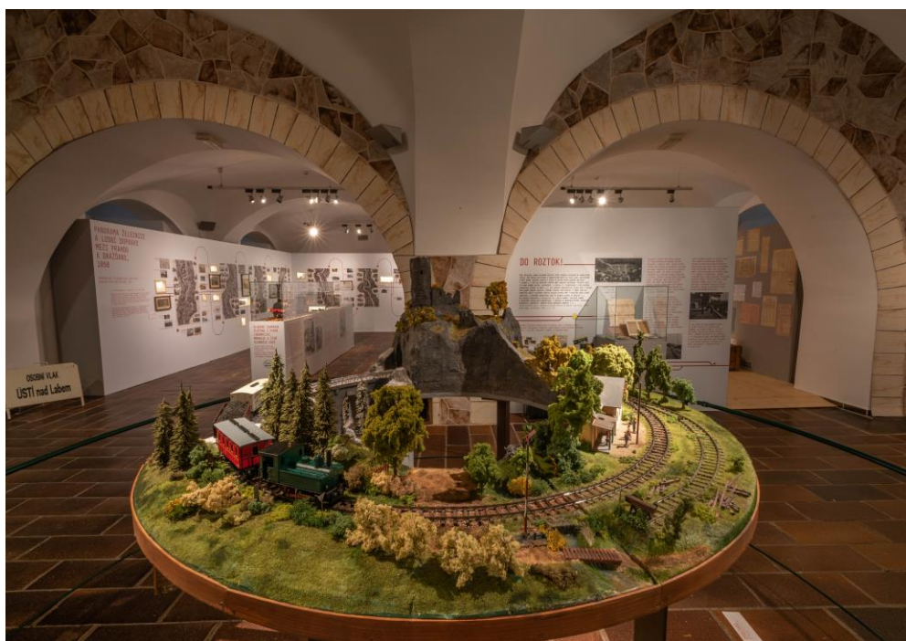
Pohled do výstavy Z Vídně na Sever. Přijeli jste do stanice Roztoky