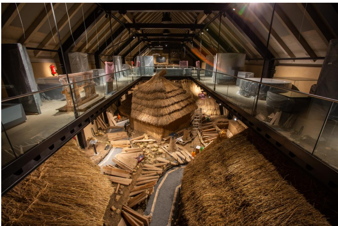
Závěrečná fáze probíhající rekonverze objektu stodoly do podoby archeologické interaktivní expozice Stopami věků