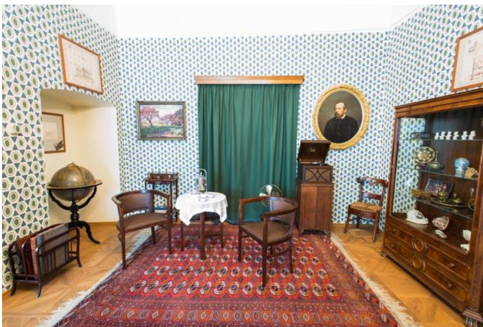
Roztoky – Zámek, Pohled do expozice Život v letovisku aneb jak se jezdilo do Roztok na letní byt