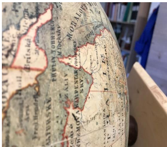
Glóbus, poč. 20. století, papír, sádra, ø 60 cm, př. č. 1500/71, SM