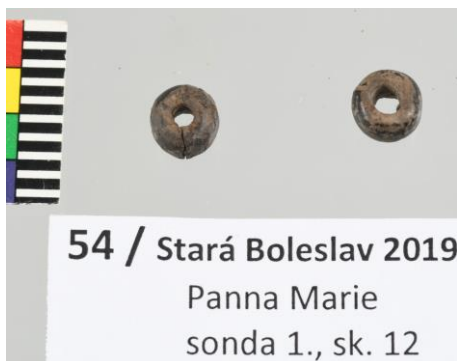
54 / Stará Boleslav 2019 Panna Marie sonda 1., sk. 12