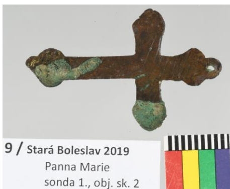
9 / Stará Boleslav 2019 Panna Marie sonda 1., obj. sk. 2