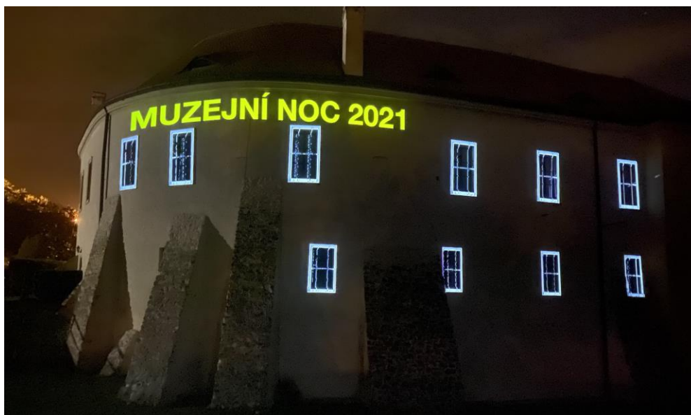
Mapping na fasádě zámecké budovy realizovaný v rámci Muzejní noci