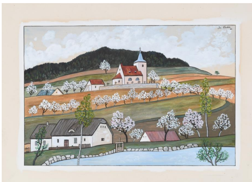
Lada, Josef, Vesnička s kostelíkem, 1944, olej na lepence, 25, 5 x 40, 5 cm, př. č. 528/2021, SM