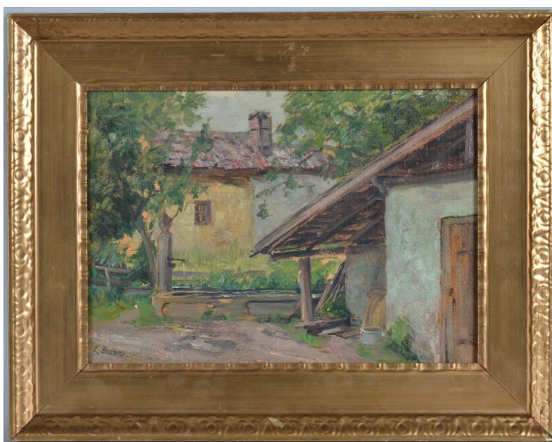
Braunerová, Zdenka, Na dvorku, cca 1890, olej, karton, 27 x 38,2 cm, př. č. 4/2021, SM