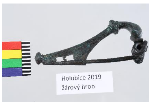
Bronzová spona, přelom letopočtů, 6 x 5,5 x 0,5 cm, př. č. bude přiděleno, SM