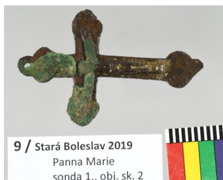
9 / Stará Boleslav 2019 Panna Marie sonda 1., obj. sk. 2