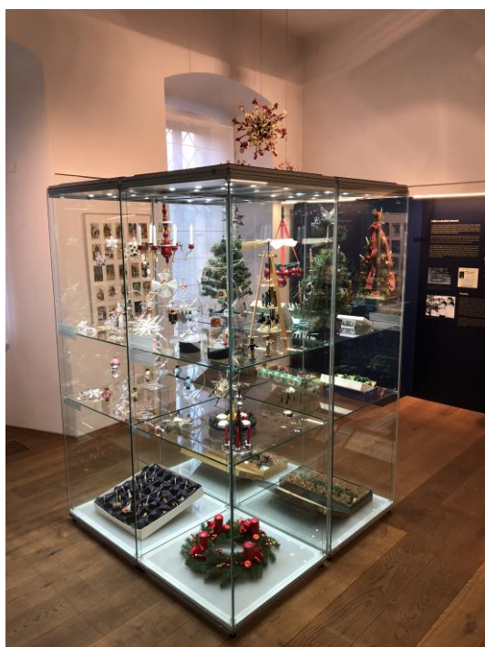
Pohled do výstavy Vánoční světlo