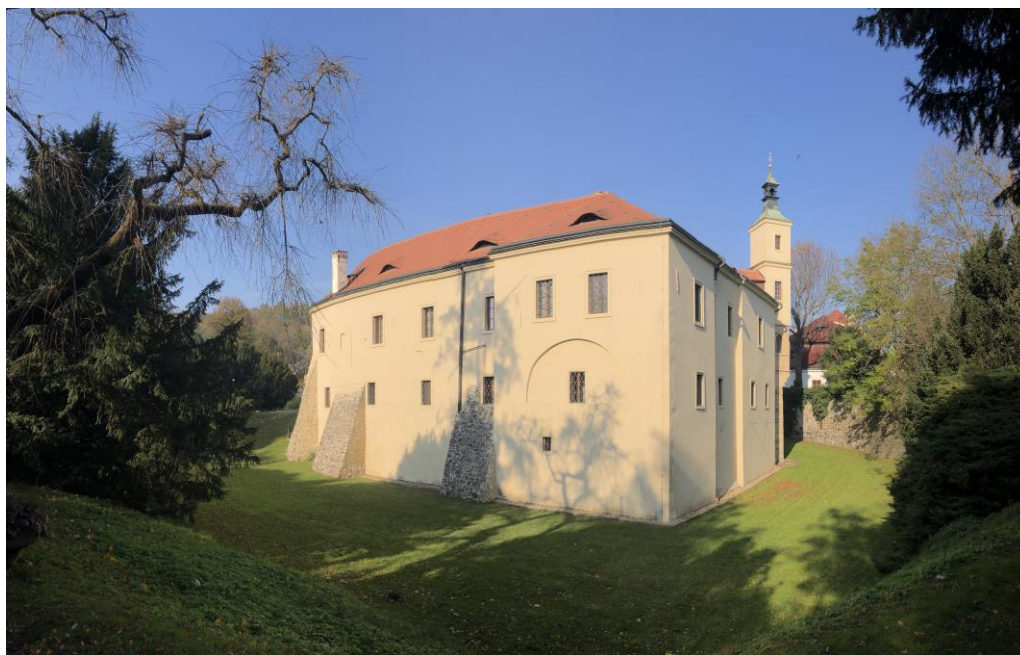
Rožtoky – pohled na zámek