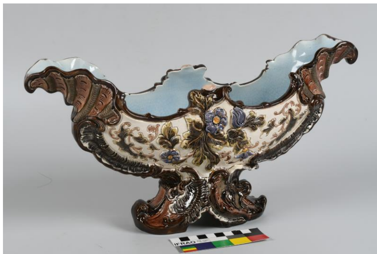
Žardiniéra, porcelán, 3. třetina 19. století, 21 x 40 x 13 cm, př. č. 122/2021, SM