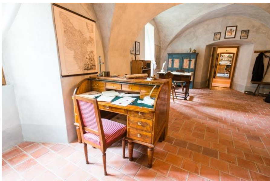
Rottoky – Zámek – Pohled do expozice Vrchnotenská správa panství aneb jak bydlel a úřadoval pan správce