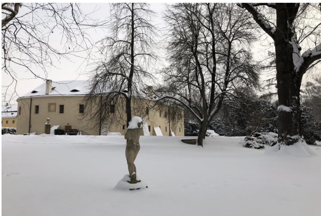
Roztoky – pohled z parku na zámek