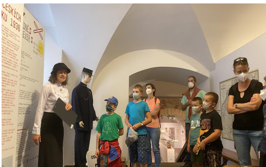
Prohlídka výstavy Z Vídně na Sever uskutečněná v rámci Muzejní noci