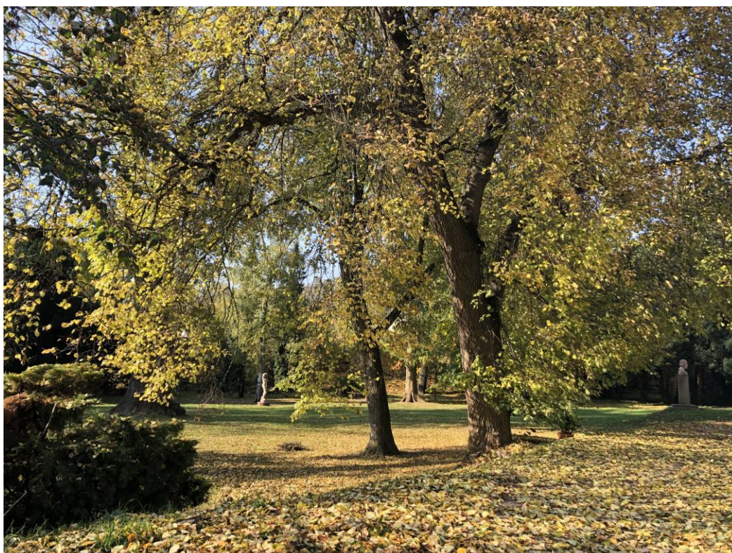
Roztoky – pohled do zámeckého parku