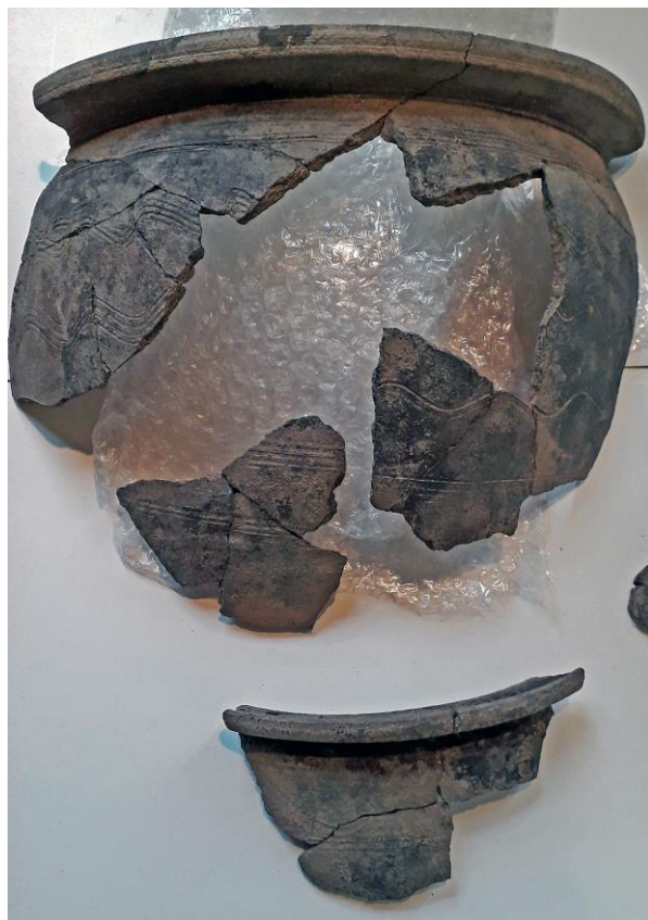
Slepená část nádoby z raného středověku, Žalov, ppč. 2748/2

Historický fond muzea byl v roce 2021 doplňován podle plánu sbírkotvorné činnosti a v souvislosti s plněním výzkumných a dokumentačních úkolů interních a programových projektů formou darů, převodu od jiných institucí, nákupy a ve výjimečných případech vlastním sběrem. V souladu s Konceptí sbírkotvorné činnosti (plánu investic Středočeského kraje) byl v roce 2021 realizován nákup souboru stříbrných rytých šperků, hygienických a kuřáckých předmětů a unikátní truhly (pokladnice) na žold z 1. třetiny 17. století s novějšími úpravami, které rozšířily sbírku SČM/001-07-31/019001 (podsbírku historickou). Instituci se povedlo zakoupit také další díla Zdenky Braunerové, která tvoří důležitou část podsbírky historické – výtvarného umění. Na akvizice spojené s dílem zmíněné umělkyně se instituce zaměřuje systematicky. V souvislosti s realizovanou výstavou věnovanou roztocké sochařce Hedvice Zaorálkové se pak povedlo získat dva dary – bysty z díla této autorky a několik prací z okruhu významných malířů činných koncem 19. a v první polovině 20. století se instituci podařilo zajistit převodem ze strany Úřadu pro zastupování státu ve věcech majetkových. Zejména podsbírky botanická a zoologická se pak rozšířily díky vlastním sběrům kurátorů.