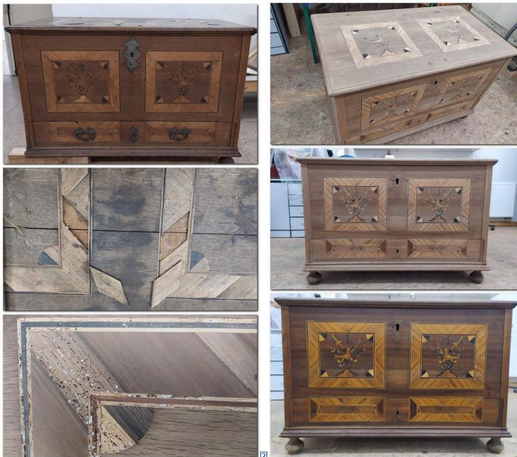
Truhla dubová inkrustovaná – napodobenina barokní truhly, 19. st., soukromý vlastník