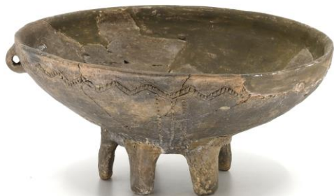
Keramická mísa na nožkách, eneolit, Úholičky, inv. č. A 179924, SM