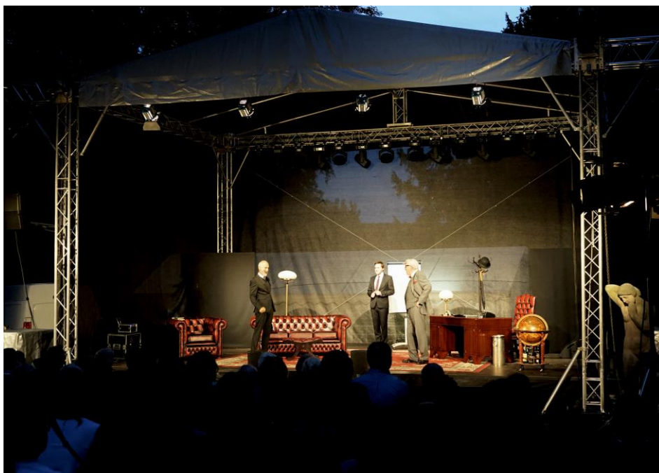
Představení divadla Bez Zábradlí Jistě, pane premiére!