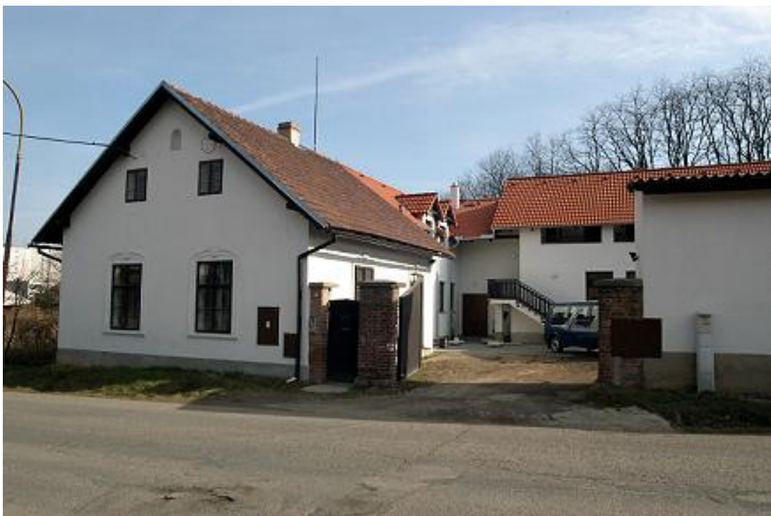
Libčice nad Vltavou – areál statku – detašované archeologické pracoviště, depozitáře