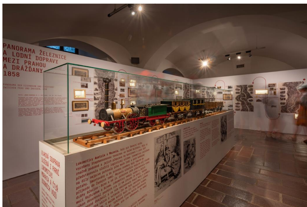
Pohled do výstavy Z Vídně na Sever. Přijeli jste do stanice Roztoky