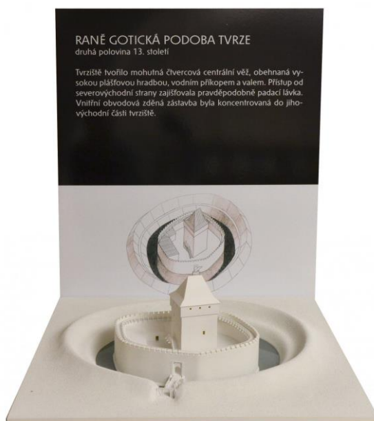
Model raně gotické podoby tvrze

Zámek je možné si nejen prohlédnout a navštívit, ale i osahat. Jak se v průběhu své historie přeměnil ze středověké tvrze s vodním příkopem v palác z doby Lucemburků, až po dnešní podobu ukazuje pět hmatových modelů , které dokumentují jednotlivé stavební etapy budovy a vznikly díky realizaci projektu Zpřístupnění nových expozic Středočeského muzea v Roztokách u Prahy pro nevidomé a slabozraké. Projekt byl realizován za finanční spoluúčasti Ministerstva kultury ČR.