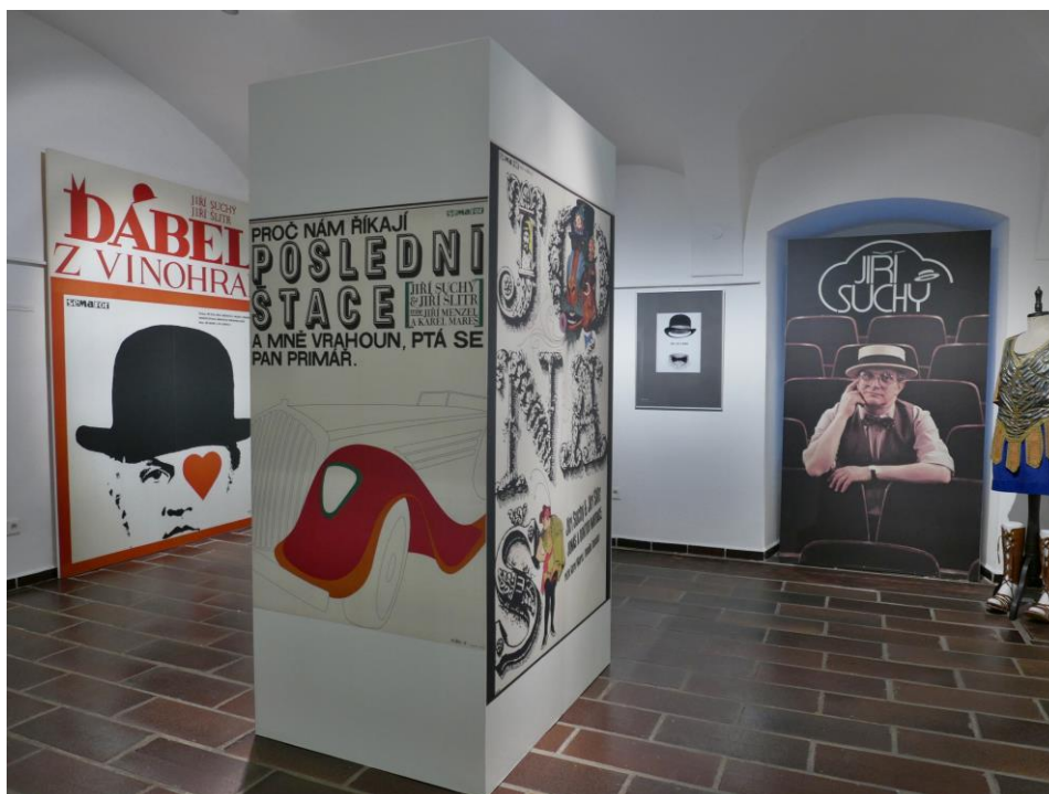
Pohled do výstavy Jiří Suchý. Objektivem českých fotografů