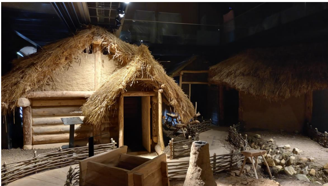
Závěrečná fáze probíhající rekonverze objektu stodoly do podoby archeologické interaktivní expozice Stopami věků