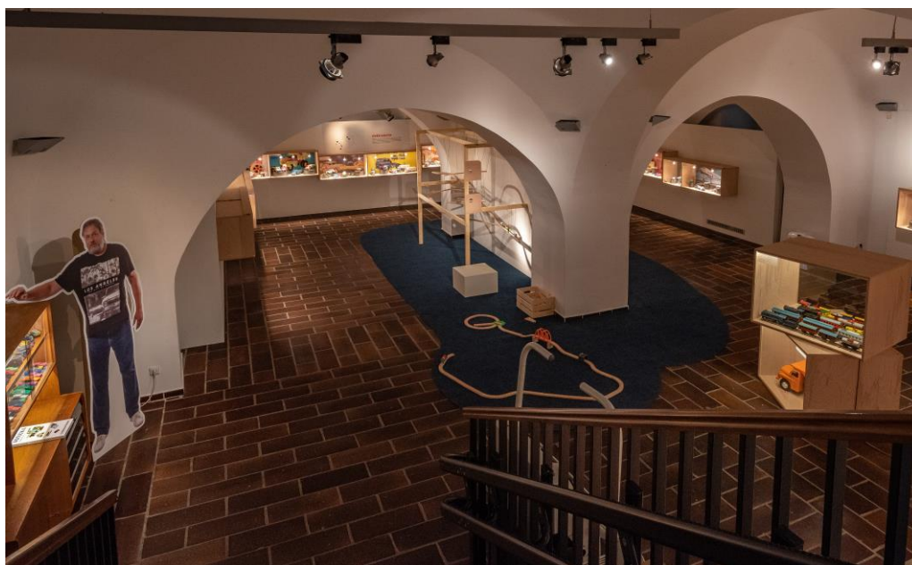
Pohled do výstavy AUTA a MAŠINY