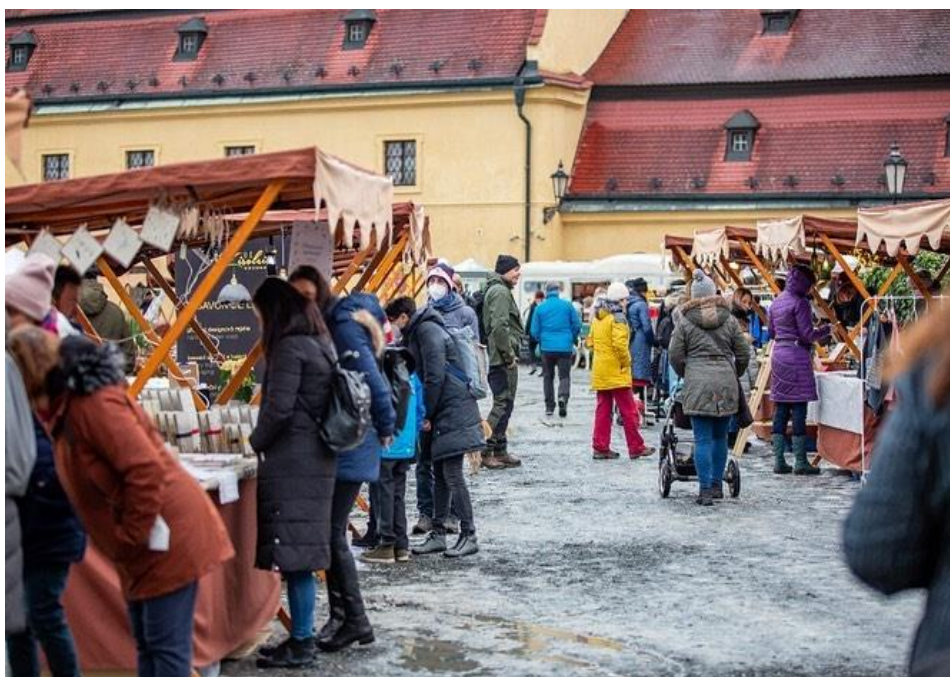
Adventní neděle v areálu muzea