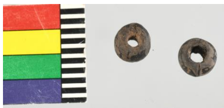
54 / Stará Boleslav 2019 Panna Marie sonda 1., sk. 12