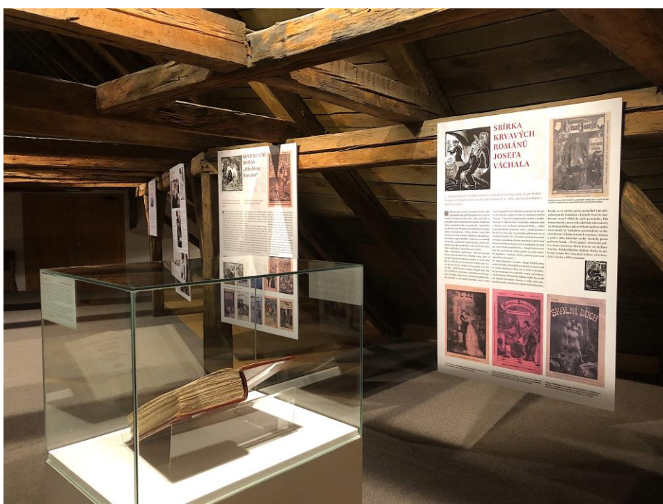
Pohled do výstav Krvavý román