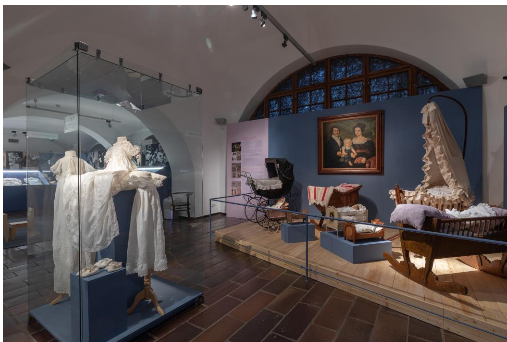
Pohled do Výstavy Vítej mezi námi, děťátko