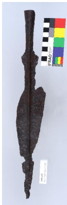
Železné asymetrické kopí z období středního Laténu, 2. stol. př. n. l., uvnitř tuleje zbytky dřeva, lokalita Holý Vrch, d. 38 cm, př. č. 29/2016, inv. č. H 7372, SM