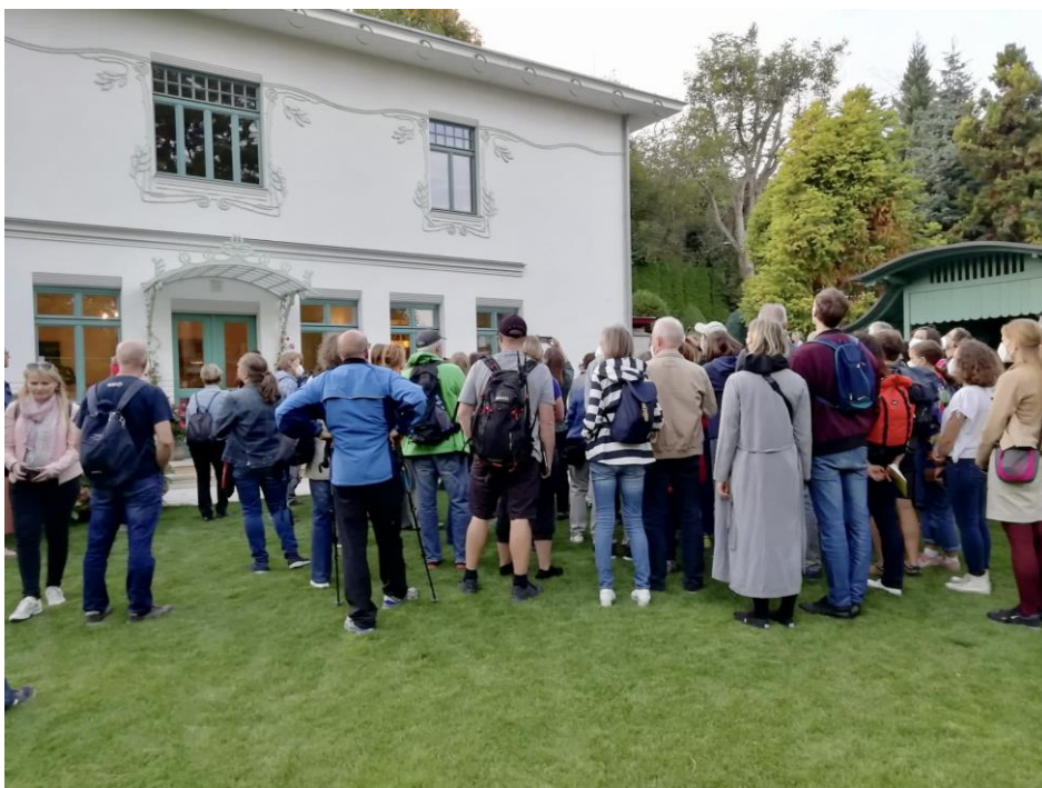
Komentovaná prohlídka věnovaná vilám Tichého údolí realizovaná v rámci Dne architektury