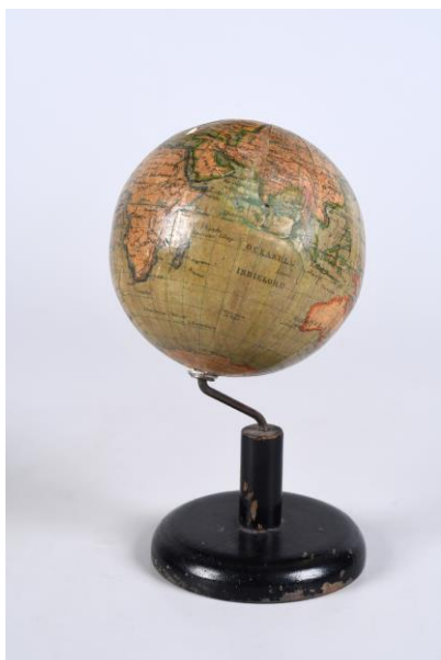
Glóbus J. Felkl Roztoky, cca 1890–1920, papír na sádrovém korpusu, ø 8,6 cm, př. č. 20/2021, SM