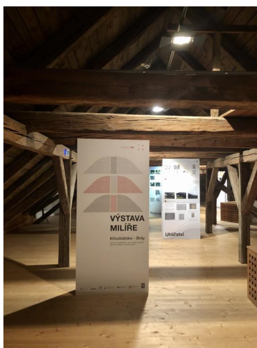
Pohled do výstavy Milíře