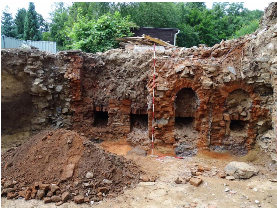
Profil sondy v místech stavby rodinného domu zachycující úroveň sídliště z raného středověku, překrytého stavbou pravděpodobně z 15. – 16. století, Roztoky – Žalov, ppč. 2748/2