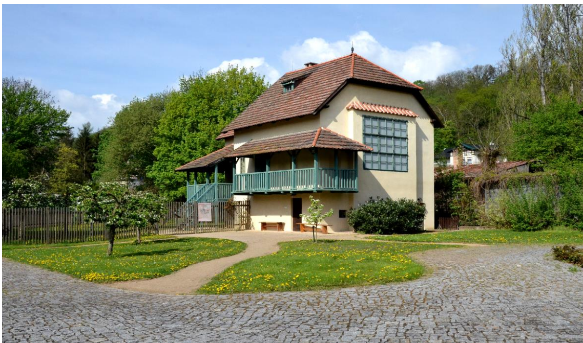
Roztoky – Ateliér Zdenky Braunerové