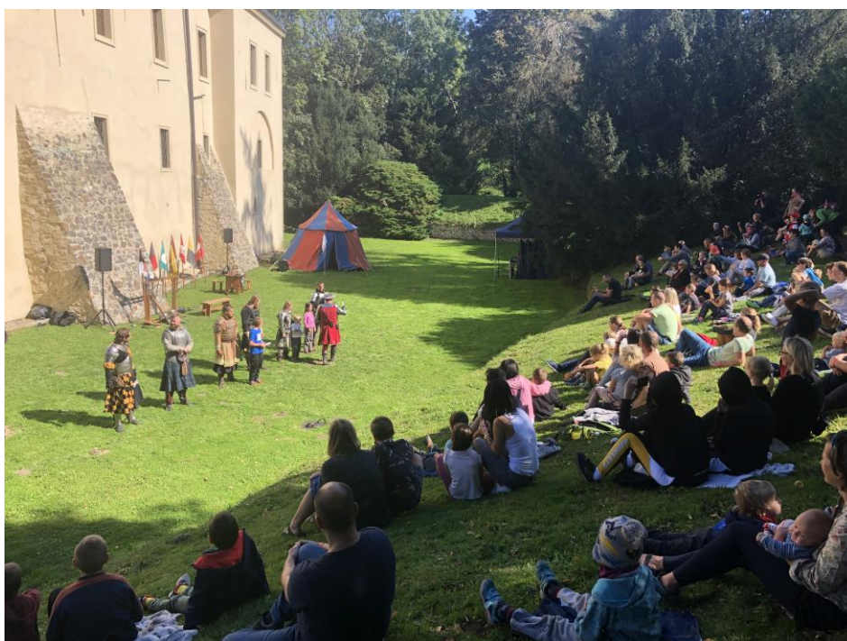
Roztokláni – představení v zámeckém příkopu