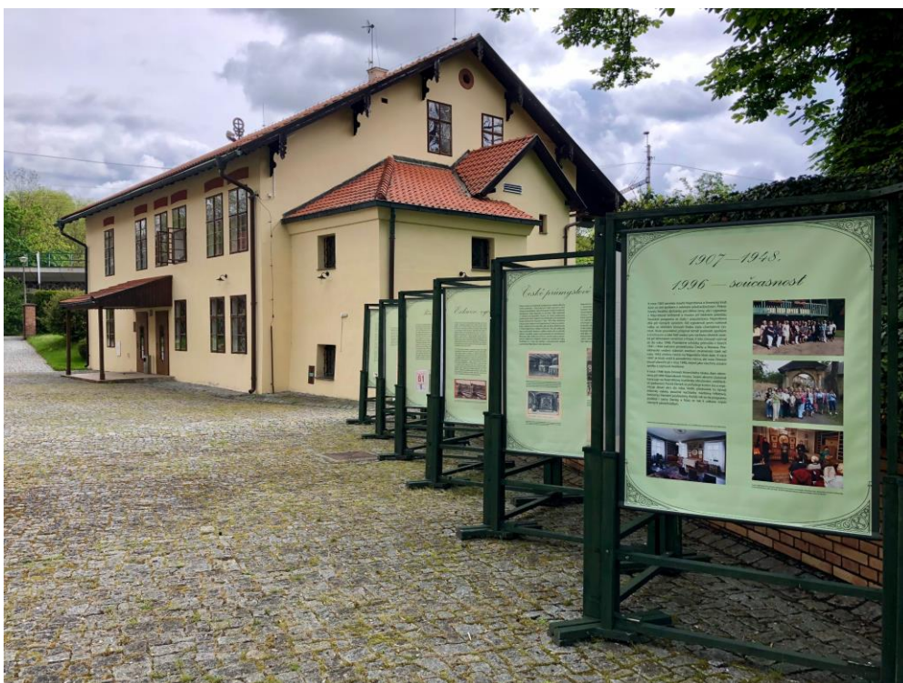
Pohled na exteriérovou výstavu Americký klub dam