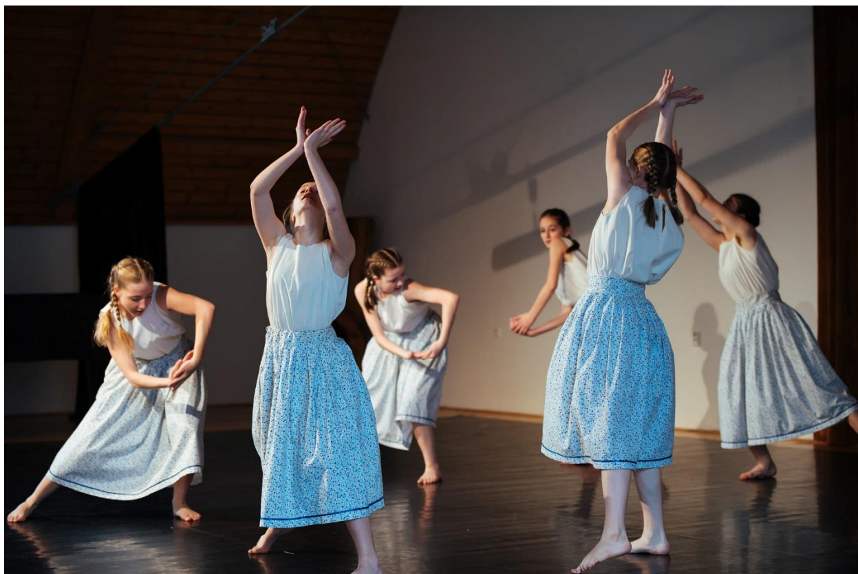
Krajská přehlídka scénického tance Praha, ZUŠ Modřany