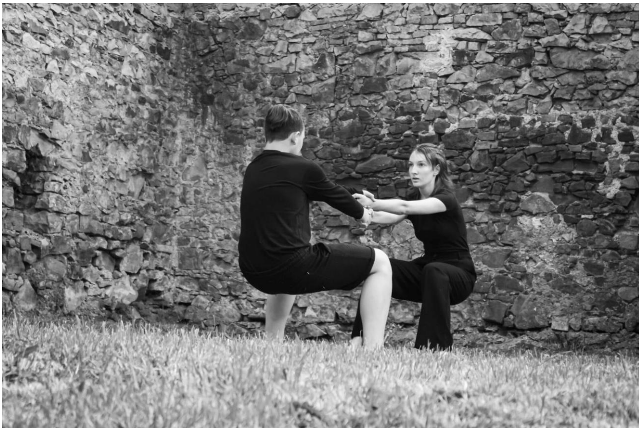
AUTORSKÉ PRÁCE ŽÁKŮ TANEČNÍHO OBORU, 15. 6. 2023: Zahrada ZUŠ v Hořovicích na Palackého náměstí