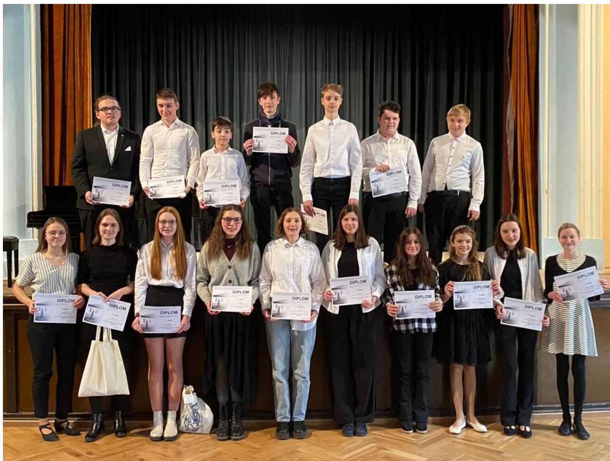
Okresní kolo v Komorní hře s převahou dechových a smyčkových nástrojů, 15. 2. 2023: Sál hořovické radnice.