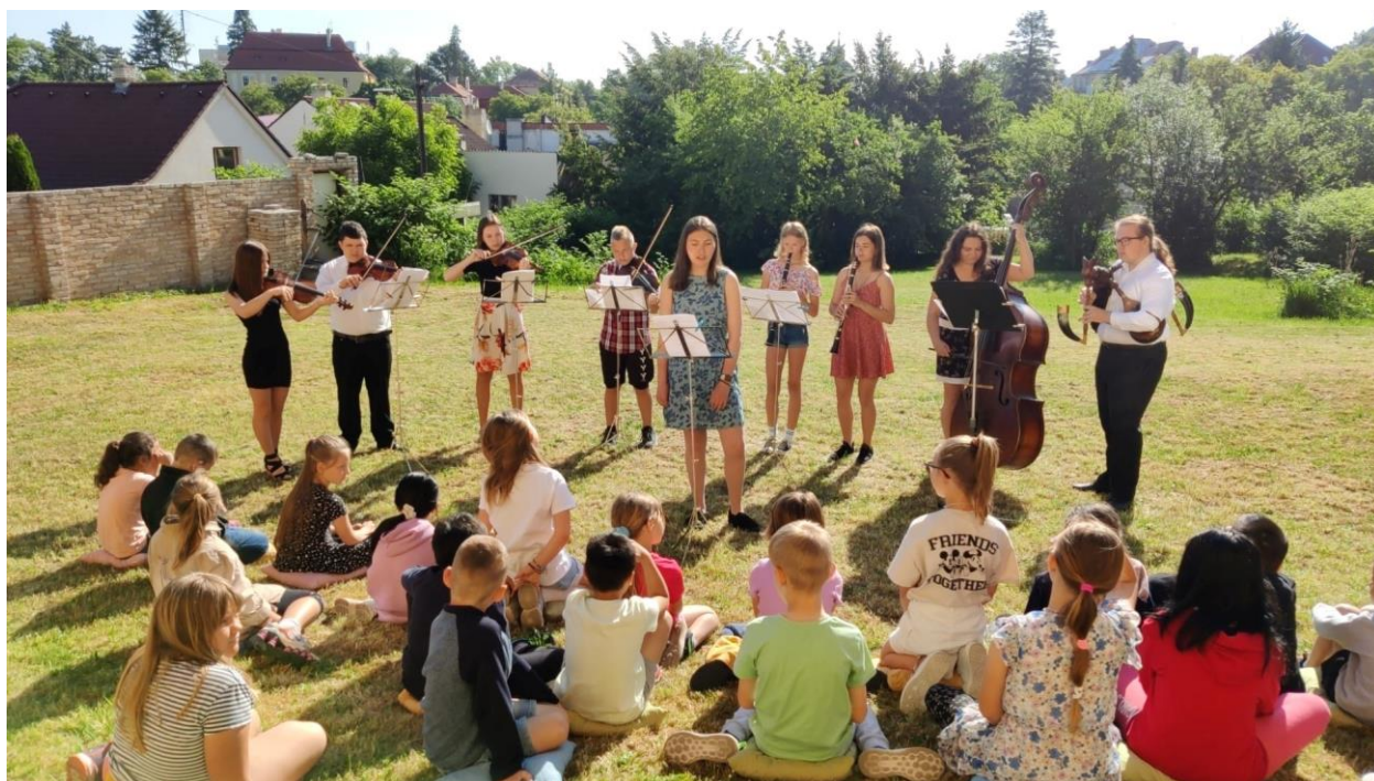
Projekt „OTEVŘENO“ pro MŠ a ZŠ, 31. 5. 2023: Do projektu se zapojili žáci a učitelé ze všech oborů.

Cílem projektu je zvyšování kvality, inkluzivity a účinnosti systémů vzdělávání.