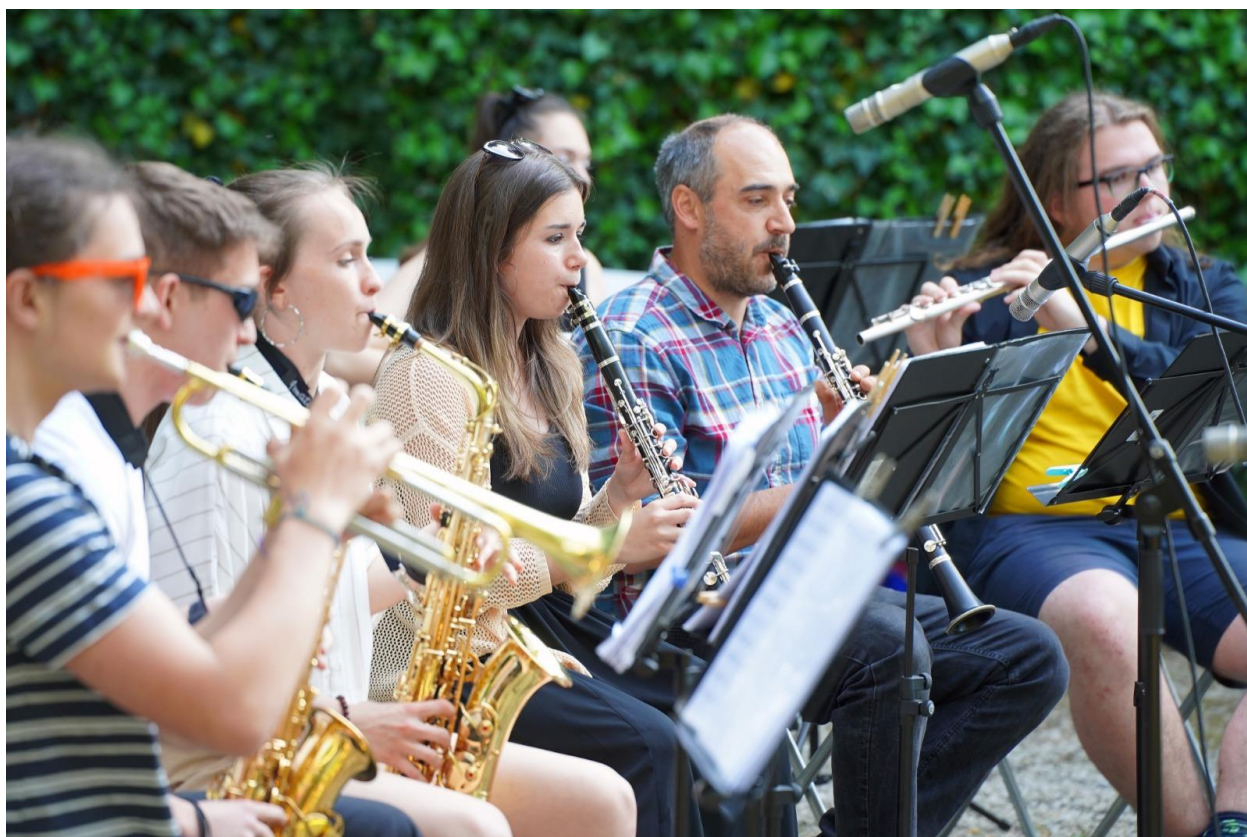
Vystoupení kapely HORband na dalším ročníku celorepublikového festivalu ZUŠ OPEN 2023 na zámku v Litni, 21. května 2023

Počet žáků, kteří úspěšně složili přijímací zkoušku do ZUŠ, byl podstatně vyšší. odpovídá stále vysokému zájmu o studium v naší škole. Z celkového počtu 128 zájemců o studium jsme do školy přijali 52 nových žáků.