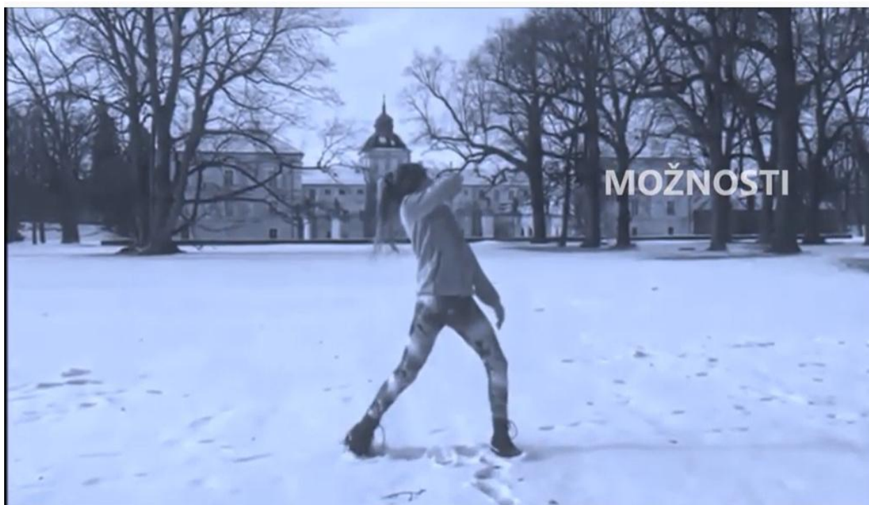
Distanční leden 2021: Sestřih ze zadání TO v distanční výuce (Taneční obor pí uč. V. Dědové)

Počet žáků, kteří úspěšně složili přijímací zkoušku do ZUŠ, byl podstatně vyšší. To odpovídá stále vysokému zájmu o studium v naší škole. Vzhledem k celkové kapacitě, jsme přijali do celkové kapacity školy 50 nových žáků.