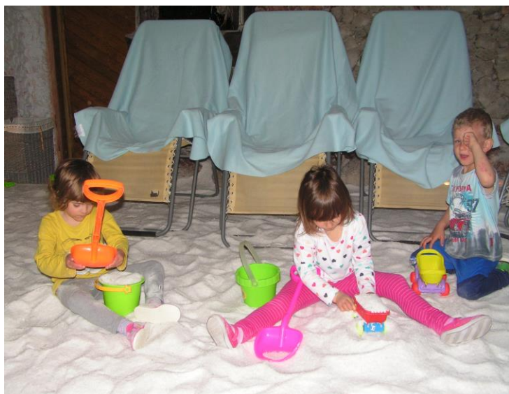
Pobyty v solné jeskyni

Canisterapie – naši školku pravidelně navštěvují psi kamarádi. Děti se učí navazovat kontakt se psem, jak přistoupit ke známému psovi a vytvářejí se základy zdravého respektu k cizím psům.