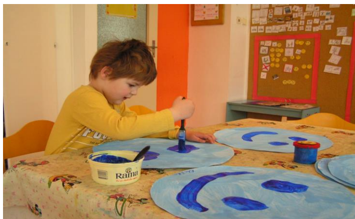
Výtvarné práce ke Dni autismu