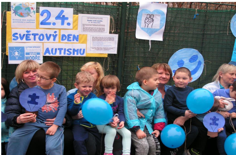
Společná instalace dětských prací u vstupu do mateřské školy k Osvětě autismu – kolemjdoucí lidé se mohli seznámit s touto lékařskou diagnózou

Adaptační program - „Školka nanečisto“ – sloužila k adaptaci nových dětí, které do školky nastoupí od 1.9.2016.