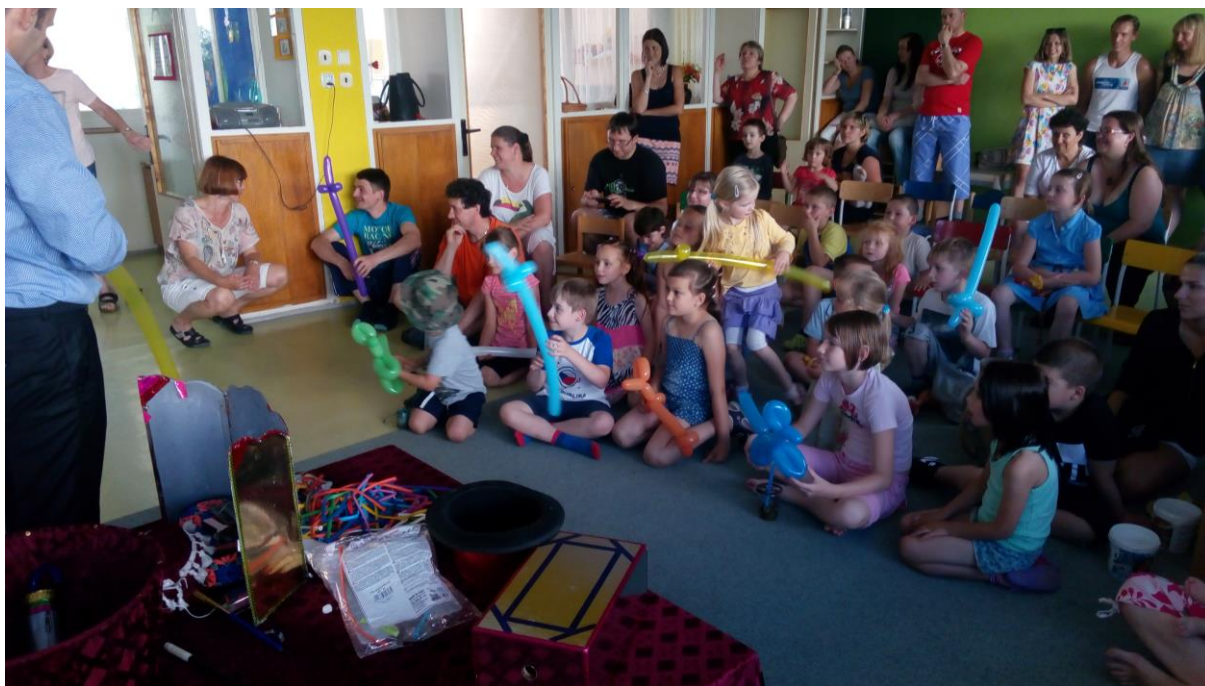
Rozloučení s předškoláky a přichystané překvapení – přišel k nám kouzelník