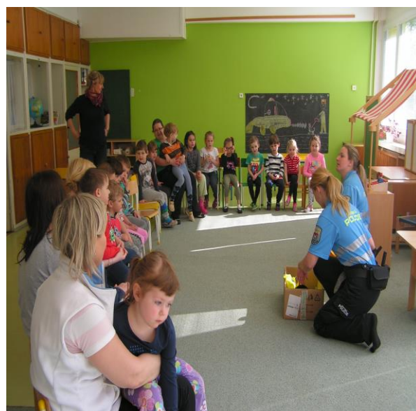
Návštěva městské policie ve školce