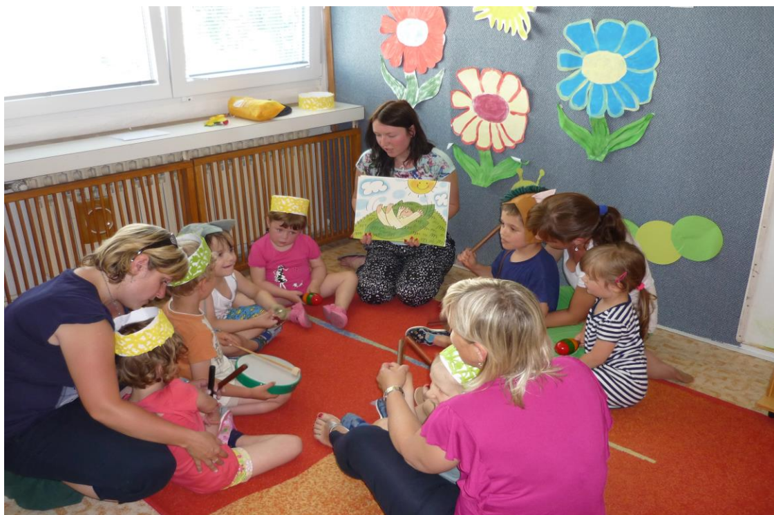
Společné setkávání s rodiči