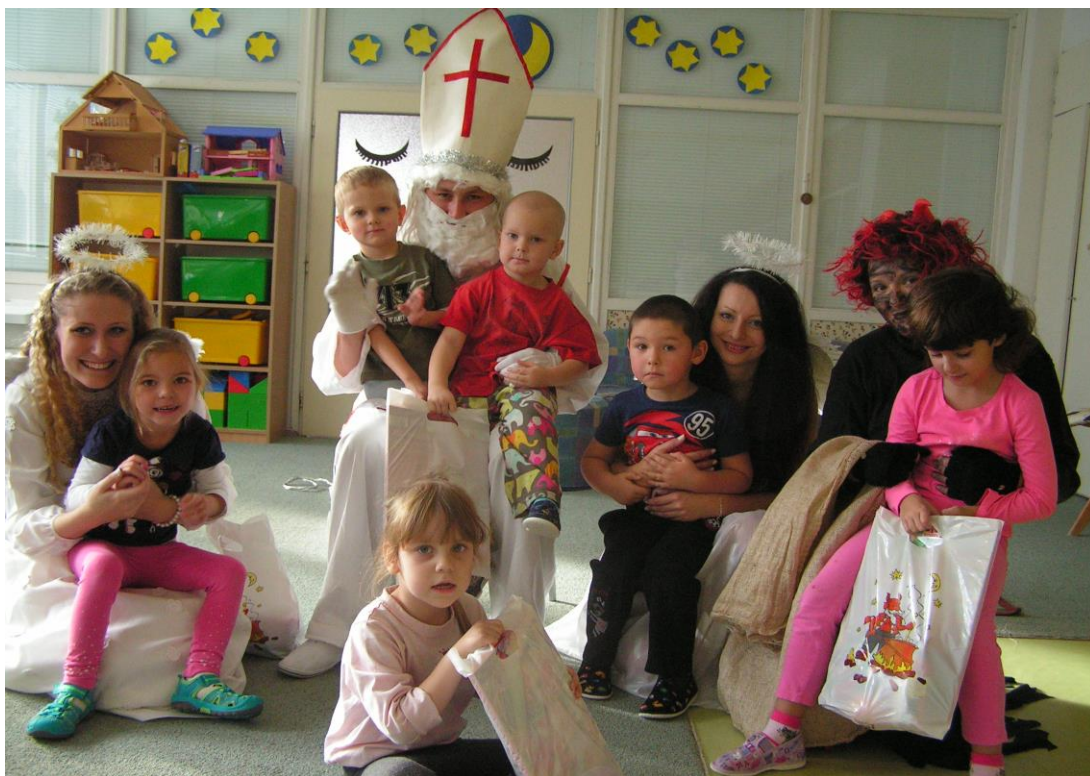
Přišel k nám Mikuláš s čerty