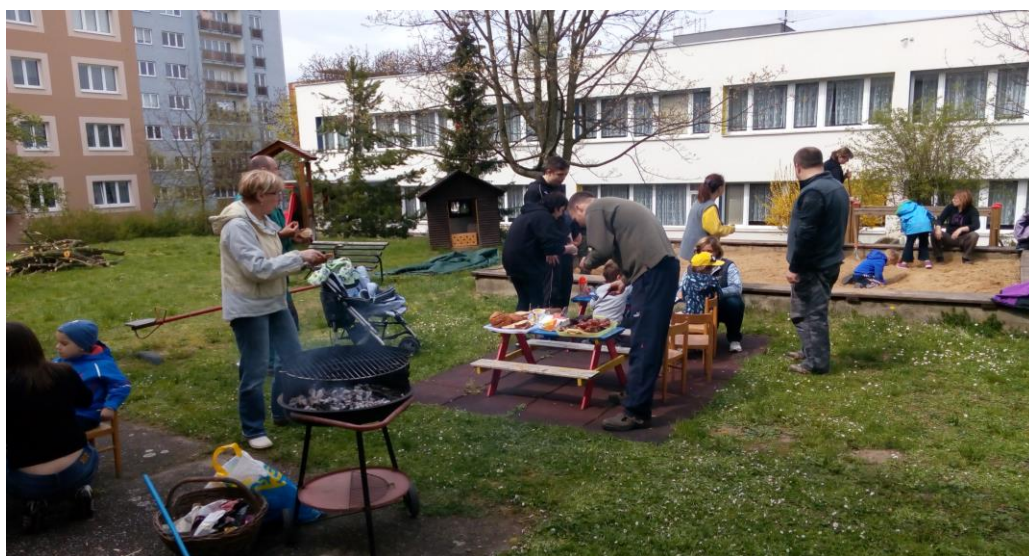
Společná akce školy s rodiči – pomoc rodičů při úpravě školní zahrady