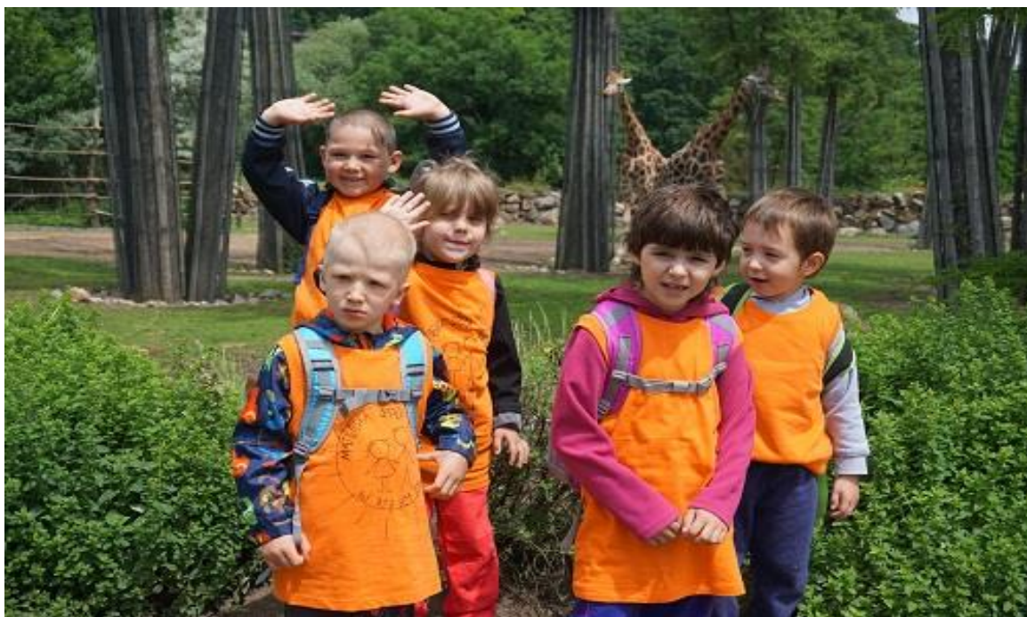
Výlet za zvířátky do ZOO Plzeň