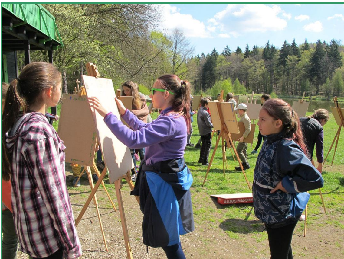
Foto: Malířský plenér – stavění malířských stojanů a upevnění kreslicí desky