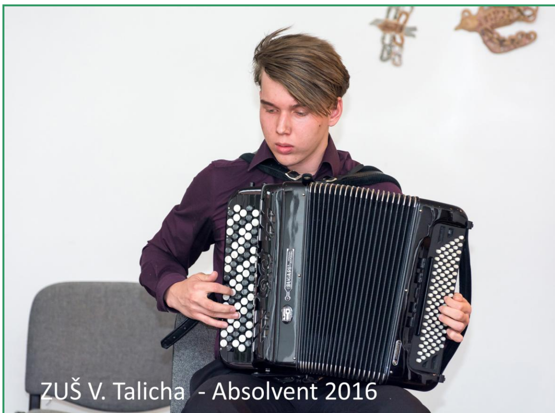
Foto: Absolvent 4. ročníku druhého cyklu, který obsadil v celostátním kole soutěže MŠMT 2.místo