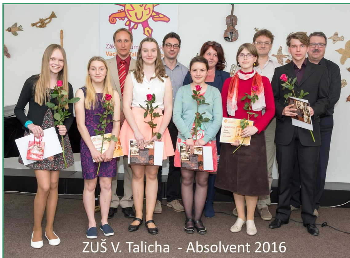
Foto: Absolventi hra na housle, klavír a akordeon 2016

Cizí státní příslušníci: celkem 12 z toho 7 ze zemí EU