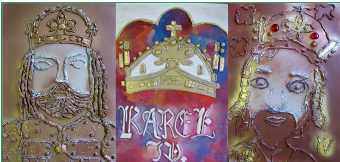
Foto: Vítězné práce z kolekce Karel IV.