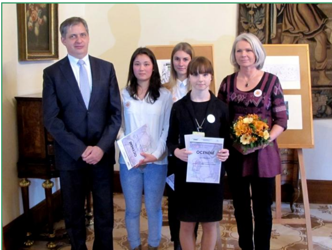
Foto: Žákyně výtvarného oboru převzaly ocenění za vítězné práce na téma „Korupce“

Korupce ti nesluší – výtvarná soutěž vyhlášená ministrem pro lidská práva, rovné příležitosti a legislativu Jiřím Dienstbierem na téma korupce. Žáci tvořili banner webových stránek. V soutěži obdrželi naše žákyně hned tři ocenění, včetně zvláštní ceny pracovníků úřadu vlády. Slavnostní předání se konalo za přítomnosti ministryně školství Kateřiny Valachové v Hrzánském paláci v Praze.