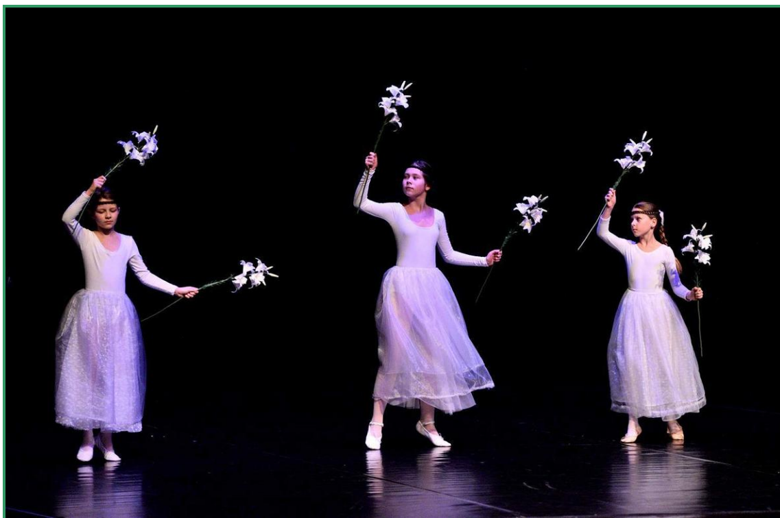
Foto: Choreografie tanečního oddělení na přehlídce scénického tance v Sedlčanech

16. června 2016- vystoupení v penzionu pro Seniory Scénická úprava baletu Sergeje Prokofjeva Romeo a Julie