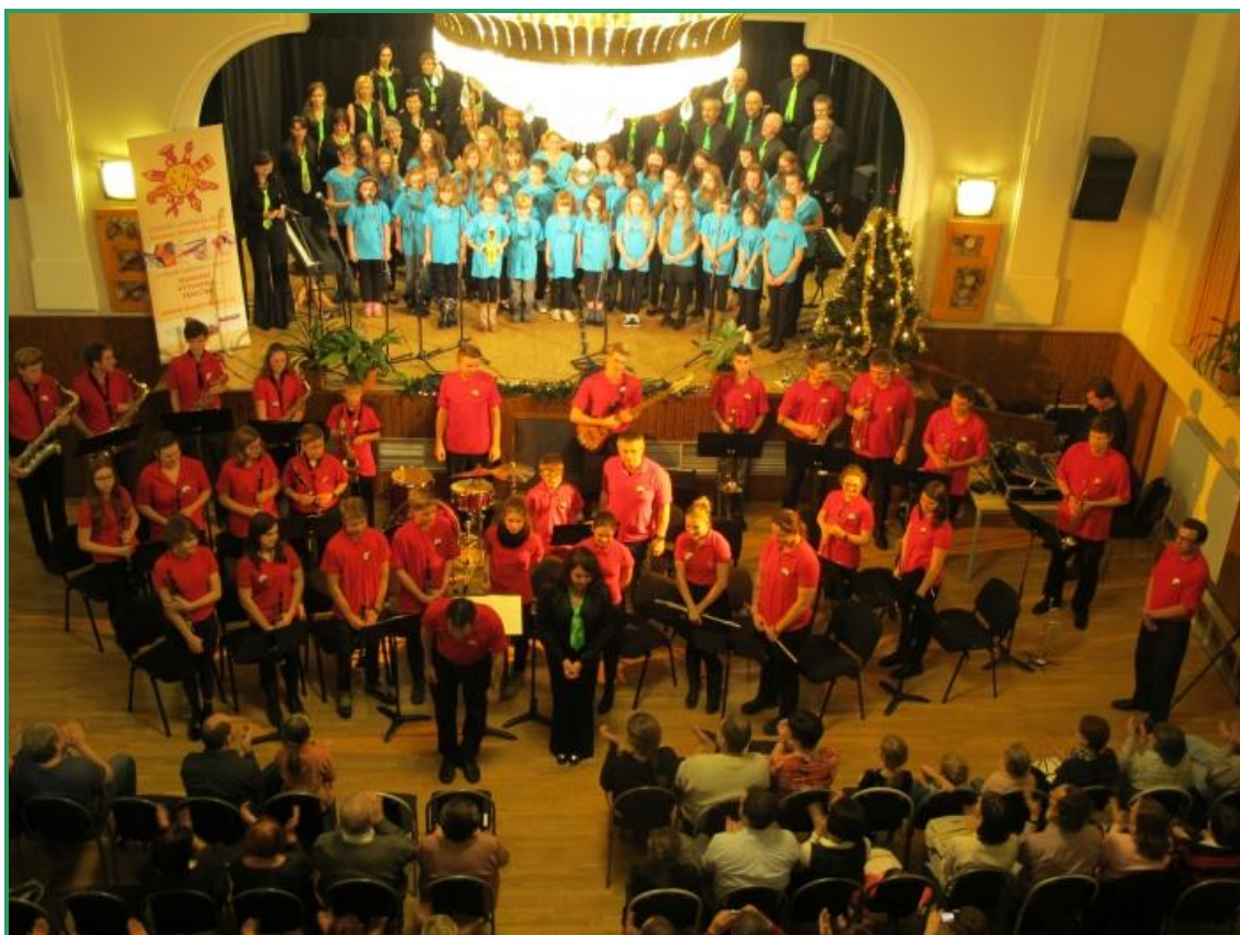
Foto: Společný koncert pěveckého sboru Krákorky a dechového orchestru Oddechovka ve Zdicích

Ve školním roce 2015/2016 proběhla pouze archivní prohlídka pracovníků Středočeského oblastního archivu Beroun. Jiné kontroly nebyly.