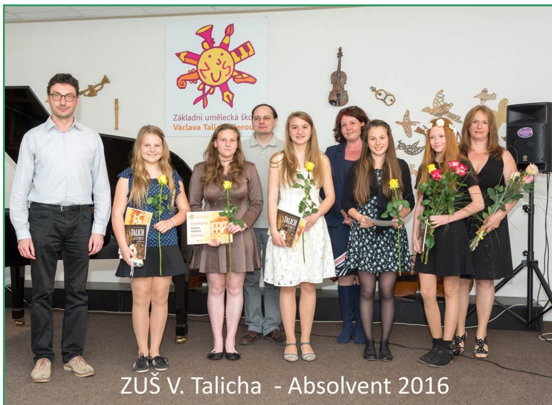
Foto: Absolventi klavír a violoncello 2016

ZUŠ V. Talicha pořádala pro pedagogy společný seminář, který se konal v prostorách školy na téma Komunikace ve školním prostředí – zaměřeno na téma „Konflikty a jejich řešení v pedagogické praxi“. Školení pro naše pedagogy pořádala společnost Českomoravský odborový svaz pracovníků školství. Na DVPP bylo ve školním roce 2015/2016 vynaložena celkem částka 88.600 Kč.