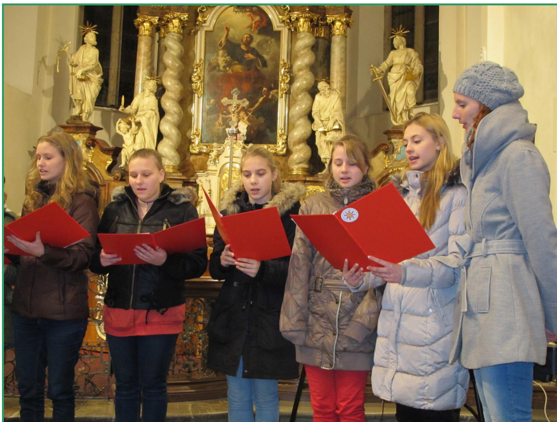
Foto: Uskupení komorního zpěvu na vánočním koncertě v kostele sv. Jakuba v Berouně