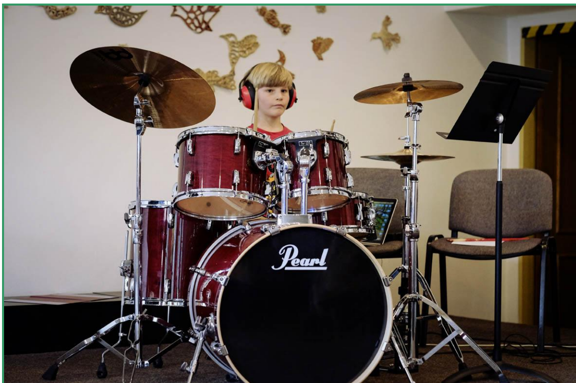
Foto: Nejmladší žák oddělení bicích nástrojů

V letošním roce byla hra na bicí nástroje vyučována prvním rokem. Uskutečnil se také první koncert tohoto oddělení a měl u diváků velký úspěch. Žáci tohoto oddělení spolupracují s dechovým orchestrem školy.