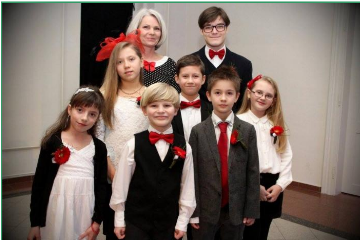
Foto: Dětská porota hodnotící audiovizuální díla pro děti a mládež na festivalu Trilobit Beroun

Z práce dětské poroty vznikl filmový dokument a rovněž slavnostní večer v kulturním domě Plzeňka byl přenášán v přímém přenosu Českou televizí, večer moderoval Jan Kraus.