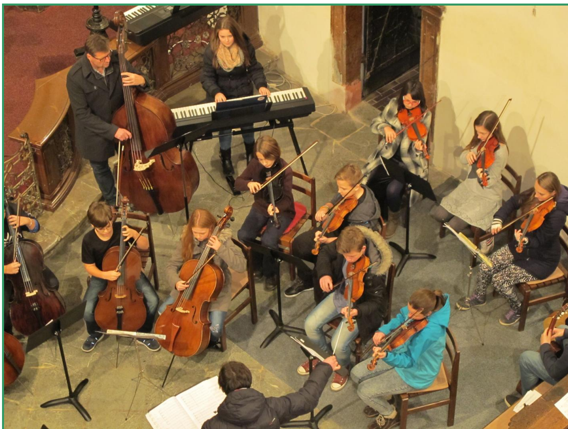
Foto: „Podstatný orchestr“ – vánoční koncert v kostele sv. Jakuba v Berouně