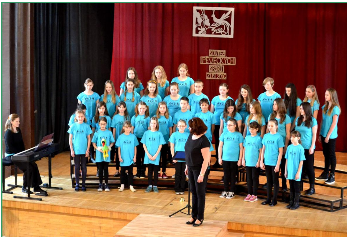
Foto: Pěvecký sbor Krákorok získal stříbrné pásmo v krajském kole soutěže MŠMT.