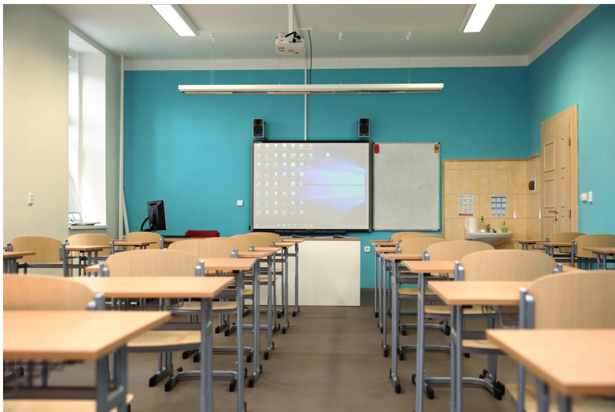
Nové lavice čekají na žáky v novém školním roce...