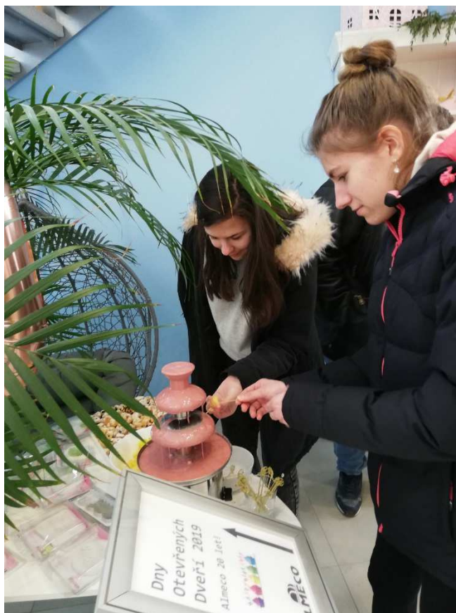
Exkurze – Dům s pečovatelskou službou Rakovník 22. 02. 2019