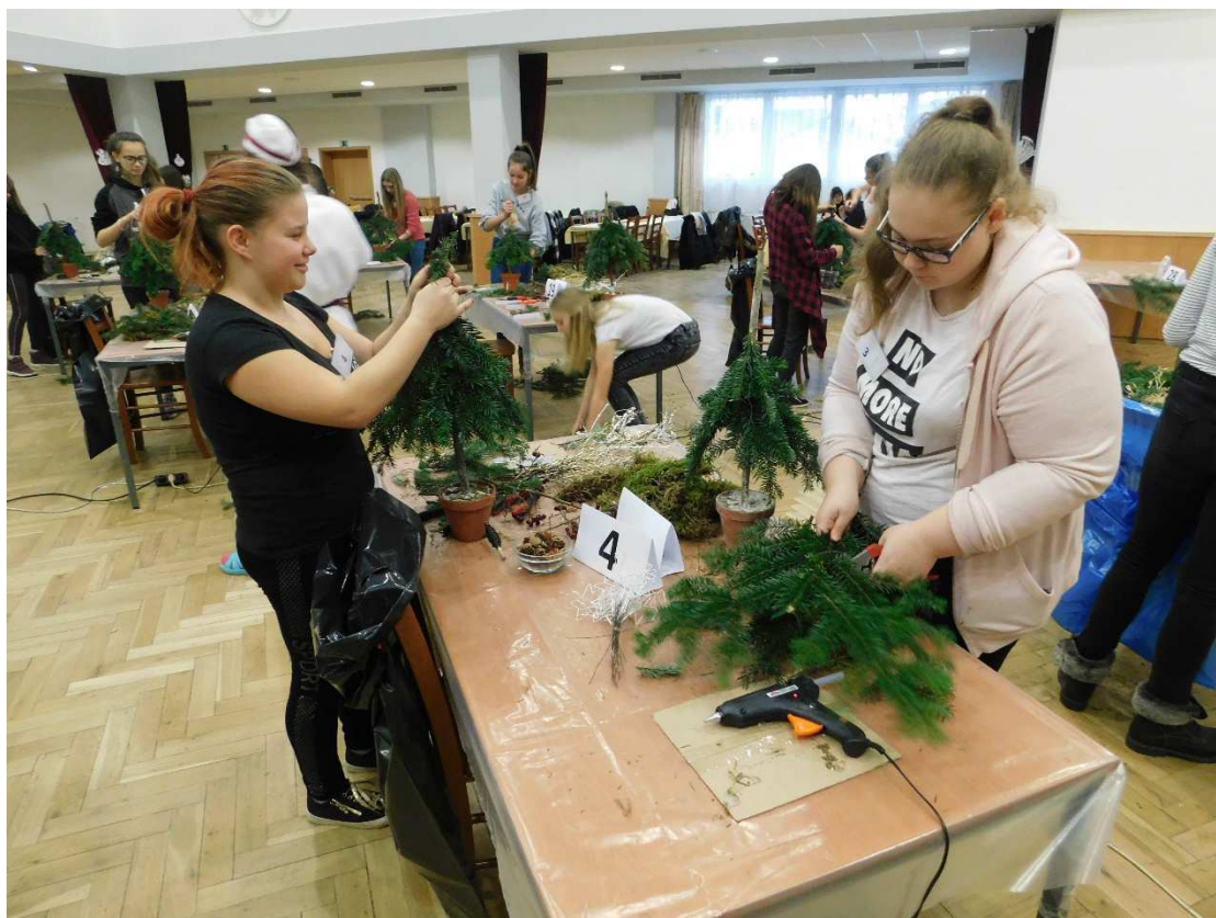
Vánoční jarmark, Městys Senomaty 15. 12. 2019