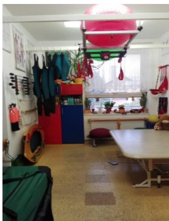
Z daru zakoupený vertikalizační polohovací stojan