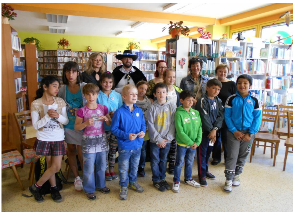
Návštěva knihovny – pasování na čtenáře