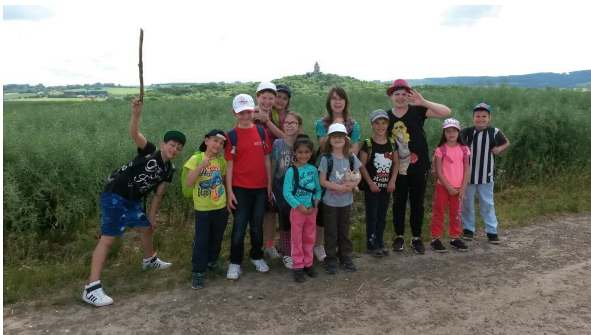
Výlet školní družiny