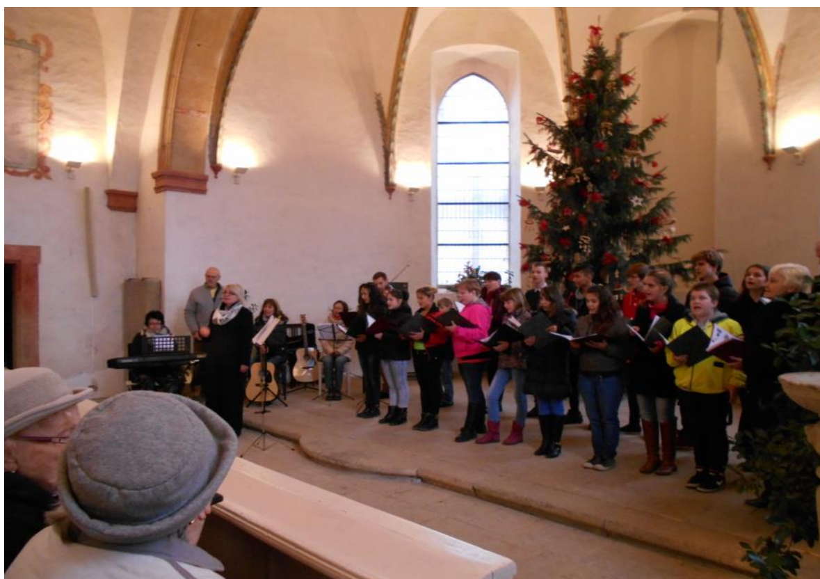
Vánoční koncert 2015