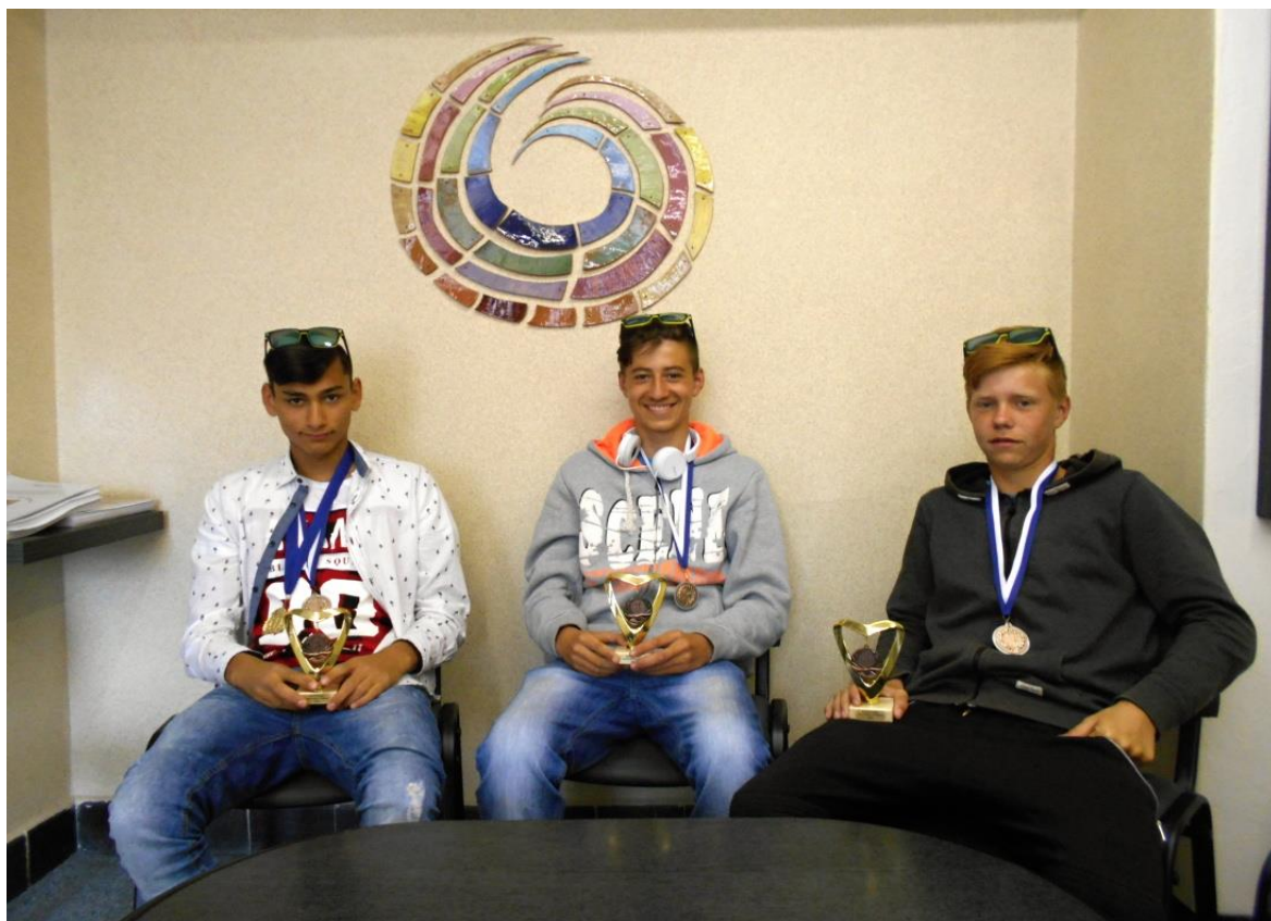
Atletika – krajské kolo