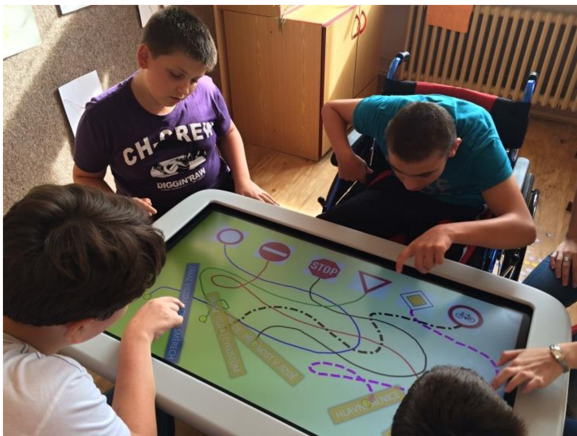
Práce na interaktivním stole