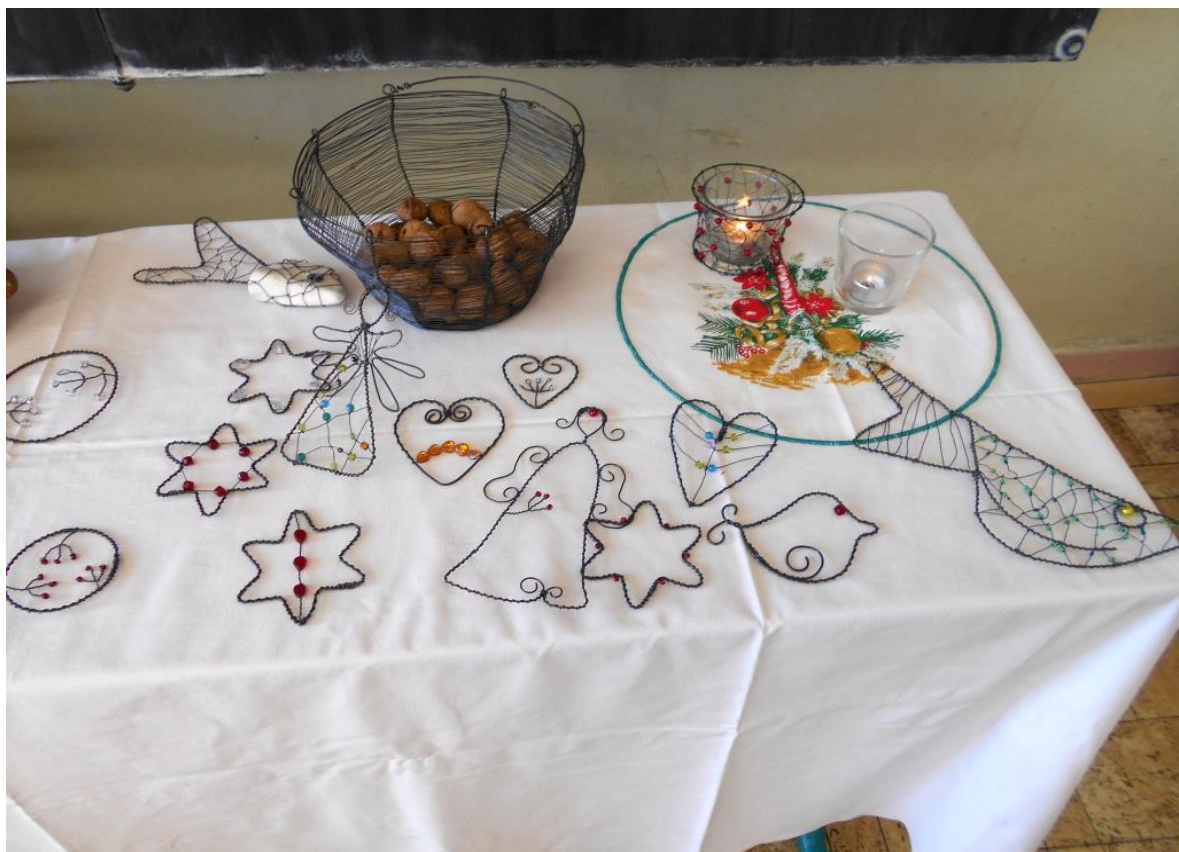
Vánoční dílny - drátkování