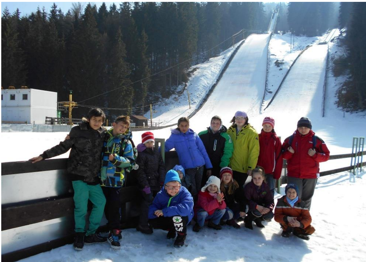
Ozdravný pobyt - Harrachov