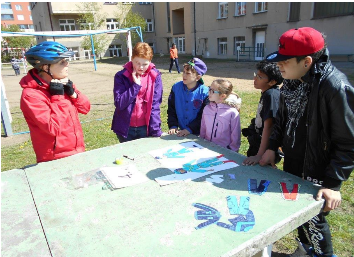
Den v dopravě