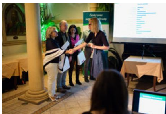
Muzeum of Senses za vítězství v „Uklid’me Česko“