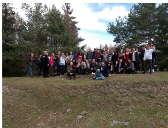
Exkurze 3. a 4. ročníku do Terapeutické komunity v Mníšku pod Brdy