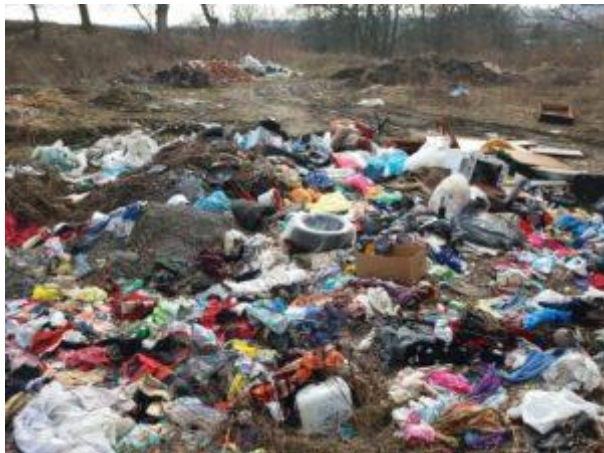
Foto: pohled před a po úklidu

V úterý 10. dubna 2018 jsme se již tradičně zúčastnili akce „Uklid'me Česko“. Celkem 54 žáků a 4 učitelé odstranili černou skládku na Kavčáku. Žáci sebrali 9,6 tun odpadu (166 kg na osobu), odvoz odpadu zajistily Technické služby Benešov. Závěrečný pohled na čistý prostor stál za to.