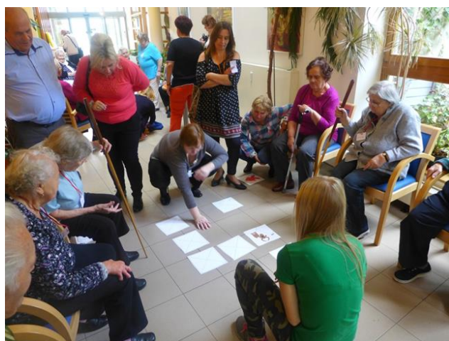
Z návštěvy Domova seniorů v Benešově – aktivizační činnosti