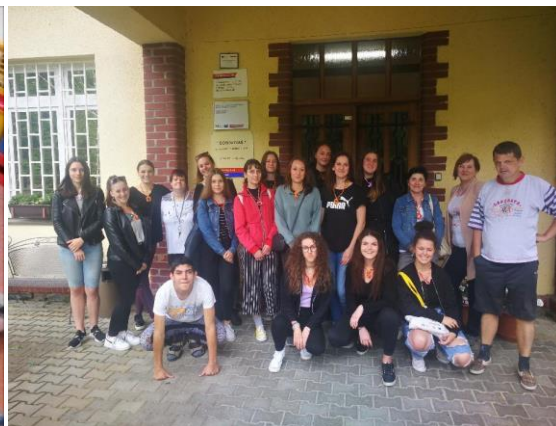
Exkurze do Domova Iván