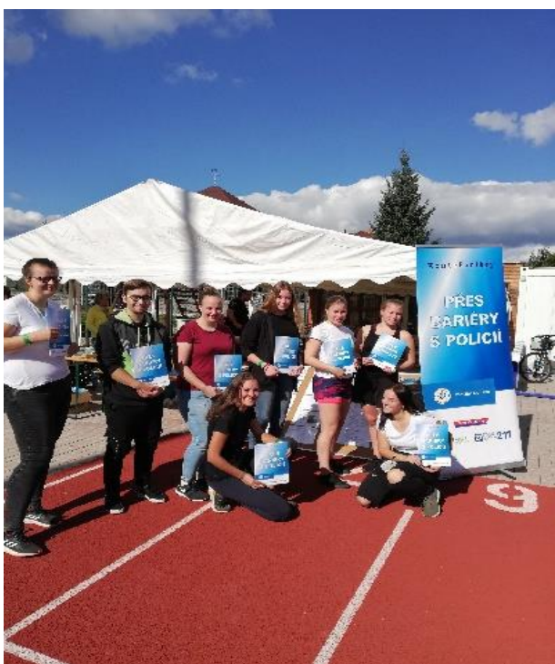
Charitativní akce Přes Bariéry s policií