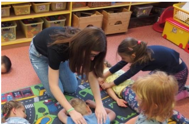
Odborná praxe žákyně 2. ročníku v mateřské škole