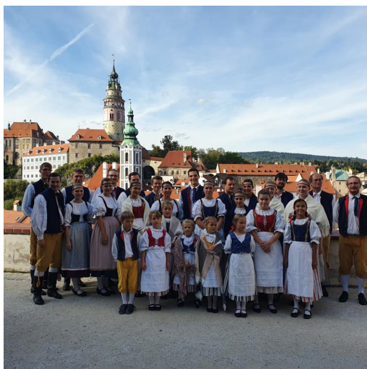
Přehled akcí Folklorního souboru Šáteček