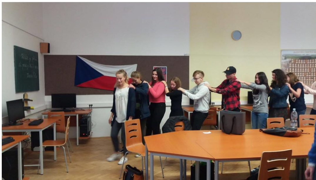
Projekt Edison 2018

V září 2018 se na naší škole uskutečnil další ročník projektu Edison, do kterého jsme se společně s Gymnáziem pod Svatou Horou zapojili již potřetí. Pod záštitou mezinárodní organizace AIESEC se studenti z celého světa mají možnost podívat do cizích zemí a na oplátku seznámí studenty hostitelských zemí se svou vlastí, tradicemi, kulturou či zvláštnostmi. Letos nás navštívilo 6 vysokoškolských studentek ze zemí bližších jako je Rumunsko a Gruzie, ale i velmi vzdálených, a to Brazílie, Číny, Indie a Kyrgyzstánu. Naši studenti mohli sledovat jejich prezentace doprovázené komentáři, osobními zážitky a zkušenostmi, vyzkoušeli si brazilskou sambu, čínské kung-fu či kyrgyzský národní tanec. Na závěr byl dán prostor dotazům a osobním pohovorům. Pro české studenty byl tento týden velmi přínosný, protože měli možnost seznámit se s odlišnými kulturami a tradicemi, porovnat různé akcenty angličtiny, navázat nová přátelství a uvědomit si, že i přes všechny rozdíly si dokážeme rozumět a vzájemně se obohatit.