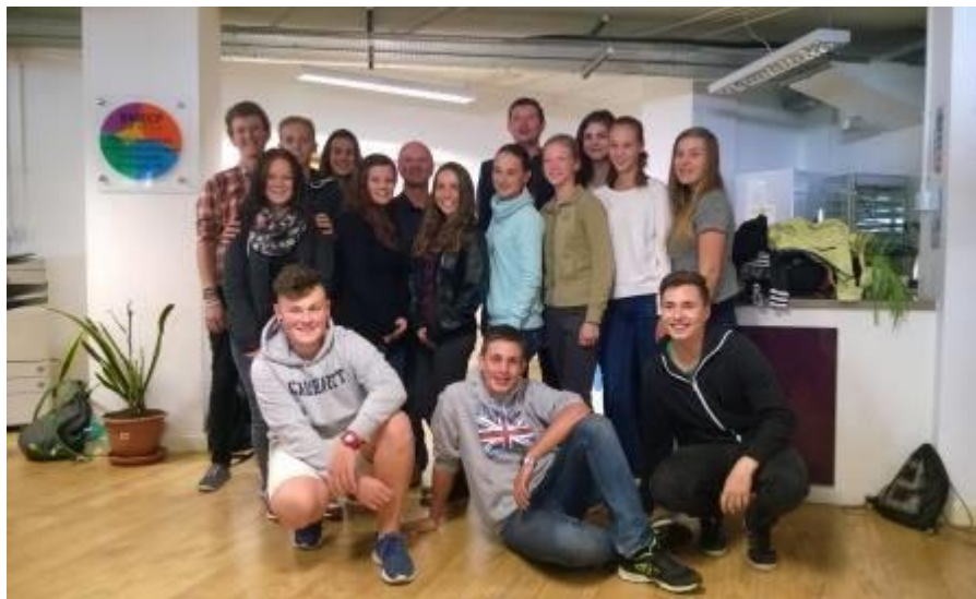
Jazykový pobyt v Německu a Velké Británii

V rámci výzvy č. 56 byly realizovány týdenní zahraniční jazykově-vzdělávací pobyty v Německu a Velké Británii, jichž se zúčastnilo 50 žáků, projekt byl financován z OP VK