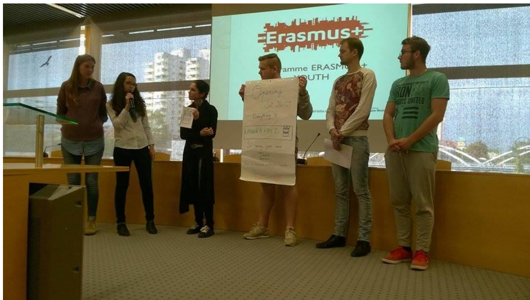
Mezinárodní fórum v Opole, Polsko

6 studentů 4. ročníku vycestovalo do Opole na mezinárodní konferenci zemí tzv. čtyřdohody – Polsko, Německo, Francie a ČR (září 2015), cílem konference je umožnit mladým lidem reálnou participaci na veřejném životě a demokratickém rozhodování, realizátorem projektu je Středočeský kraj, podpořeno grantem v programu Erasmus+