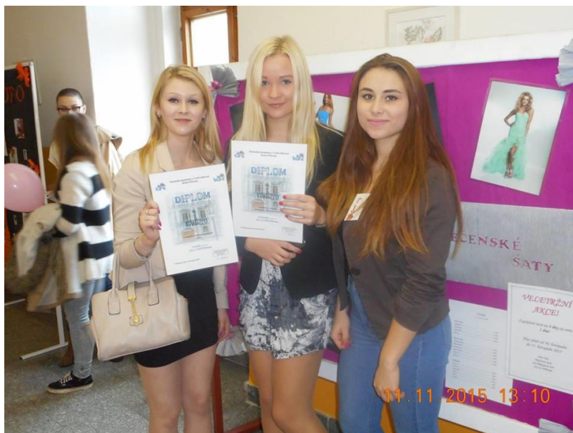
Veletrh fiktivních firem „Podzimní Příbram 2015“

Ve školním roce 2015/2016 jsme se zúčastnili několika mezinárodních projektů: