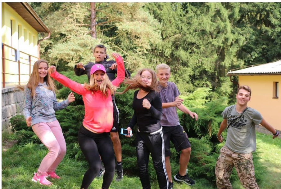
Zahajovací kurz 2016

Na základě několikastupňového hodnocení lze konstatovat, že tento kurz má dobré výsledky.