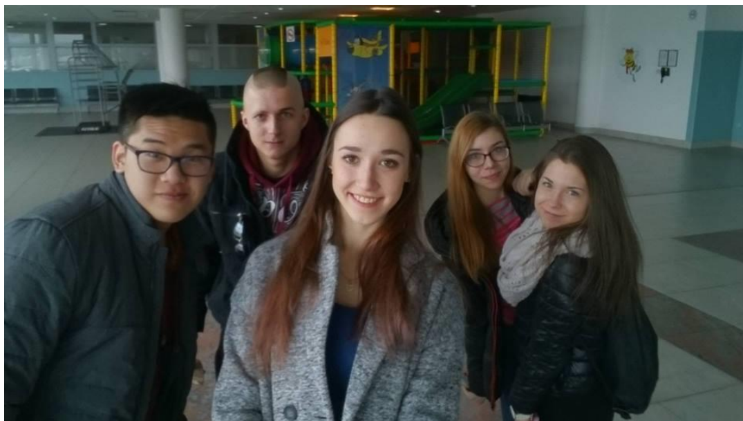
Odborná praxe v Londýně, Velká Británie

20 studentů 3. ročníku střední školy a 2. ročníku vyšší odborné školy vykonalo odbornou dvoutýdenní praxi ve Velké Británii (únor a květen 2016), projekt byl podpořen grantem v programu Erasmus+