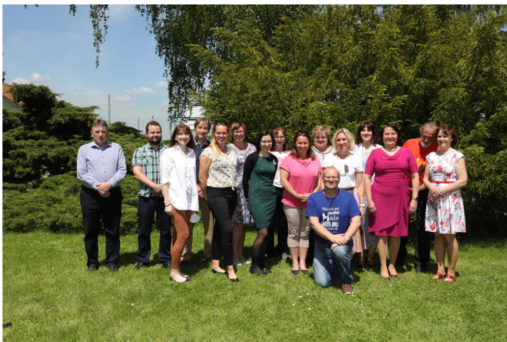
Pedagogický sbor šk. rok 2020/2021

U nepedagogických pracovníků nedošlo k žádným změnám.