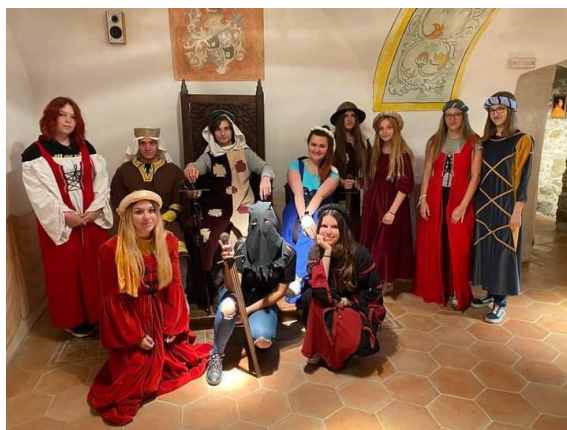
Podbrdské muzeum Rožmitál pod. Tř.