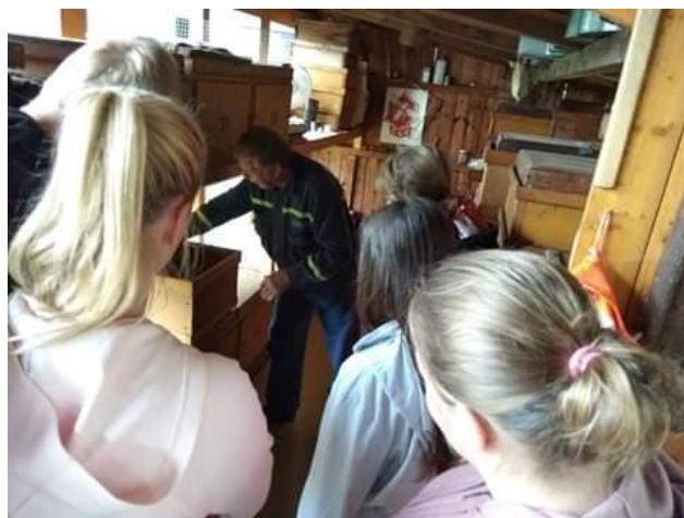
Návštěva u včelaře