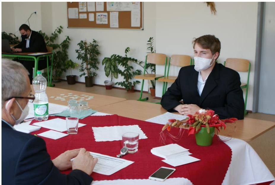
Maturitní zkoušky – obor Informační technologie

V jarním termínu absolutoria neuspěli 3 studenti a studentky oboru Sociální práce v kombinované formě studia (2x zkouška z anglického jazyka, 1x zkouška z odborných předmětů a 1x obhajoba absolventské práce). Všichni tito studenti v podzimním opravném termínu uspěli.