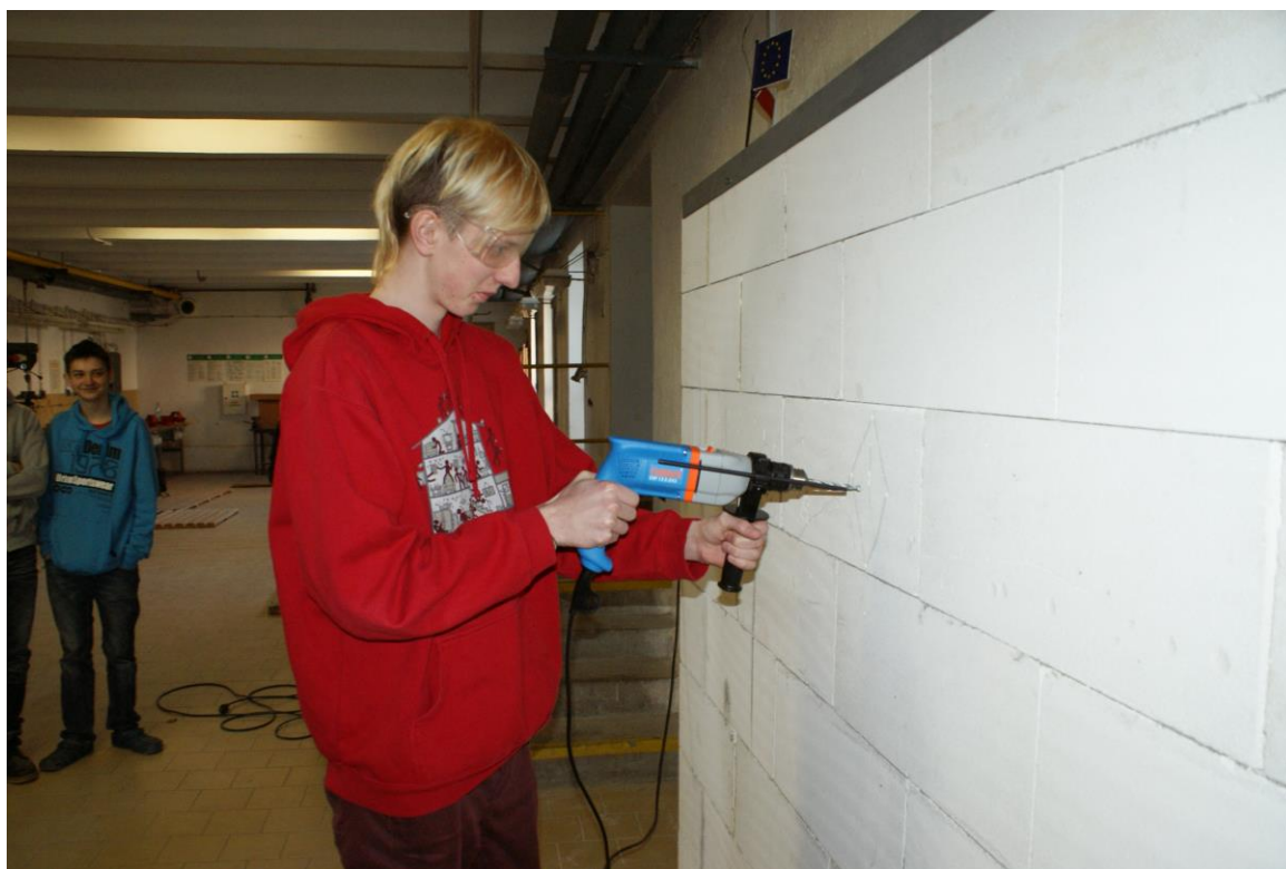
Praxe žáků oboru Informační technologie