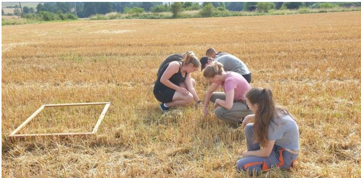
Naši žáci oboru Agropodnikání na prázdninové praxi

V uvedeném období nebyla provedená inspekční činnost ČŠI ani jiná veřejnosprávní kontrola.