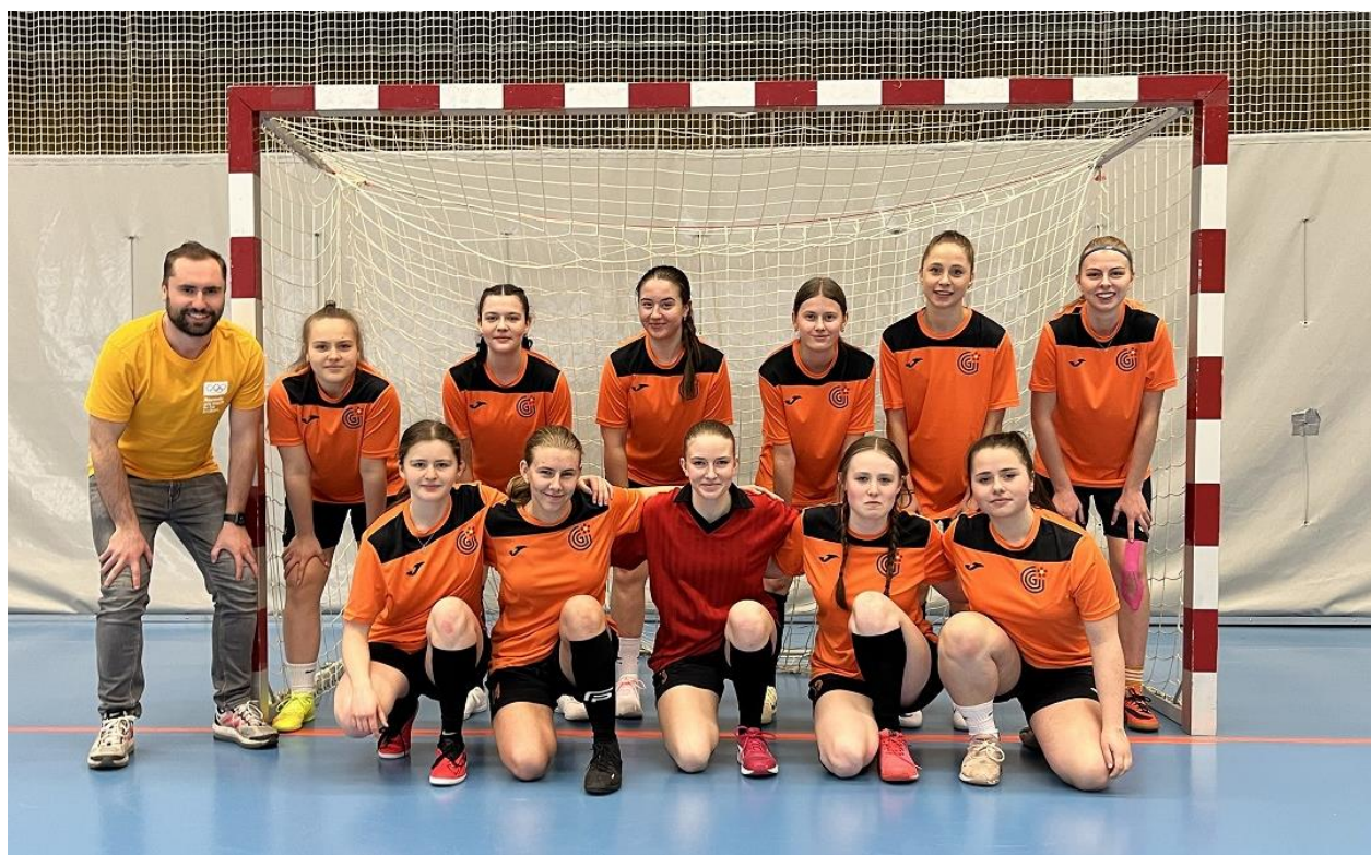
Futsalový tým dívek – 5. – 8. místo v národním kole Středoškolské futsalové ligy