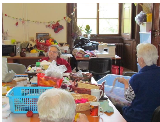
Dubnový čarodějnický rej