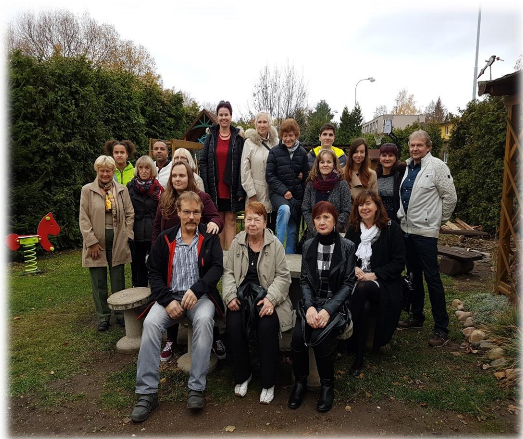
Návštěva bývalých dětí -2018

Lidé jsou často nerozumní, nelogiční a sobečtí. Přesto jim odpusťte. Budete-li k nim laskaví, stejně vás obviní ze sobectví a nízkých motivů. Zůstaňte laskaví. Budete-li úspěšní, získáte některé falešné přátele a opravdové nepřátele. Přesto pokračujte. Budete-li upřímní a čestní, lidé vás podvedou, vy ale zůstaňte upřímní a čestní. Strávíte-li léta budováním něčeho, co vám jiný zničí přes noc, budujte znovu. Naleznete-li štěstí, klid a mír, budou vám závidět. Zůstaňte šťastní. Na dobro, které uděláte dnes, zítra lidé zapomenou. Přesto dál dělejte dobro. Dávejte světu to nejlepší, co je ve vás, a i když to nemusí stačit, přesto dávejte dál.