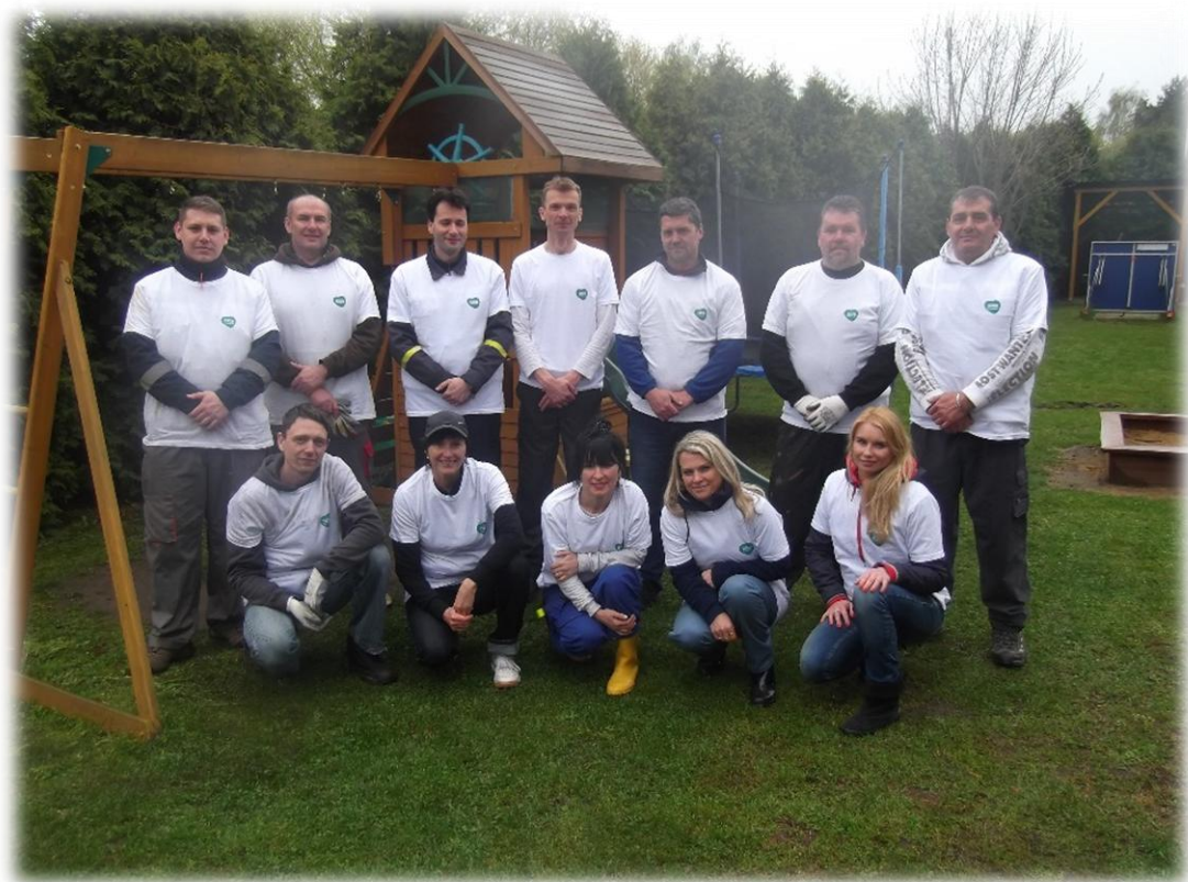
Spolupráce dvou organizací: dětský domov a Unipetrol