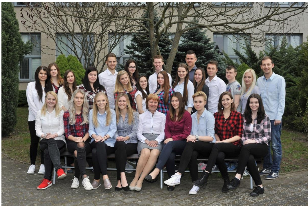
Obchodní akademie Mladá Boleslav 2016 - 2017