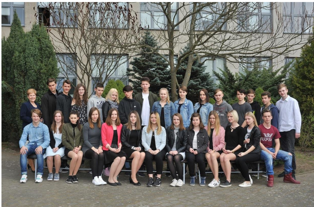
Obchodní akademie Mladá Boleslav 2016 - 2017