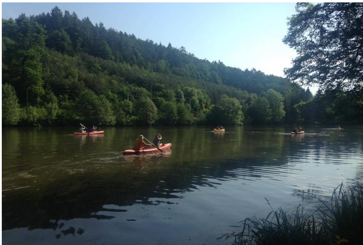
Sportovní kurz – Drhleny

Večerní program na konci STK vyplnil táborák, zpěv a opékání vuřtů.