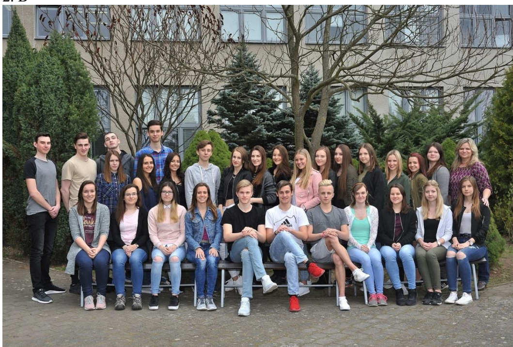
Obchodní akademie Mladá Boleslav 2016 - 2017