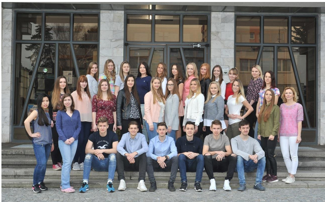
Obchodní akademie Mladá Boleslav 2016 - 2017