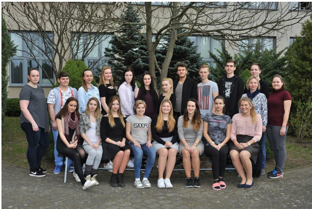
Obchodní akademie Mladá Boleslav 2016 - 2017