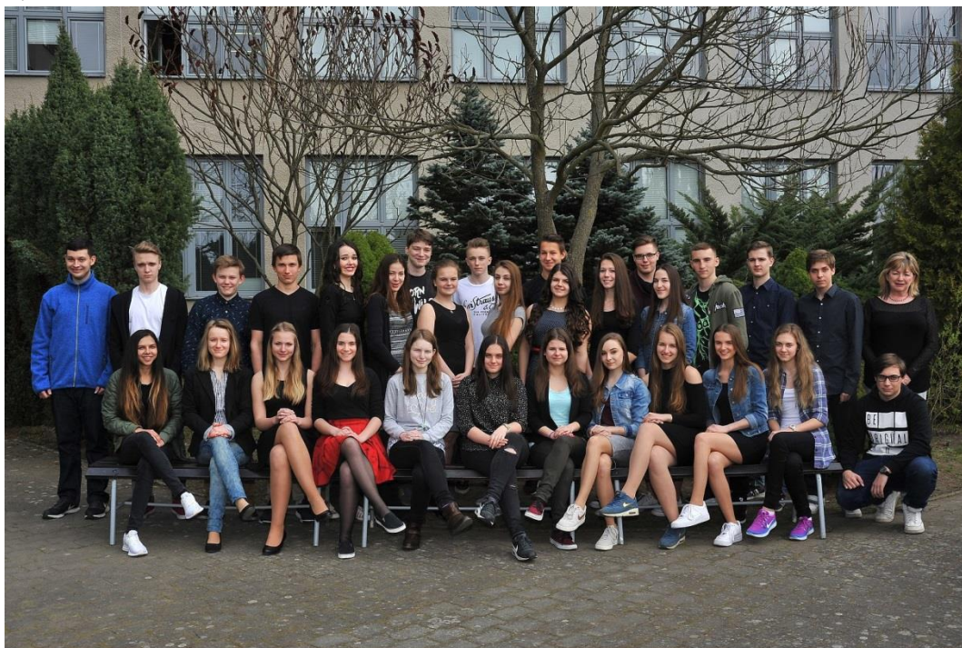
Obchodní akademie Mladá Boleslav 2016 - 2017