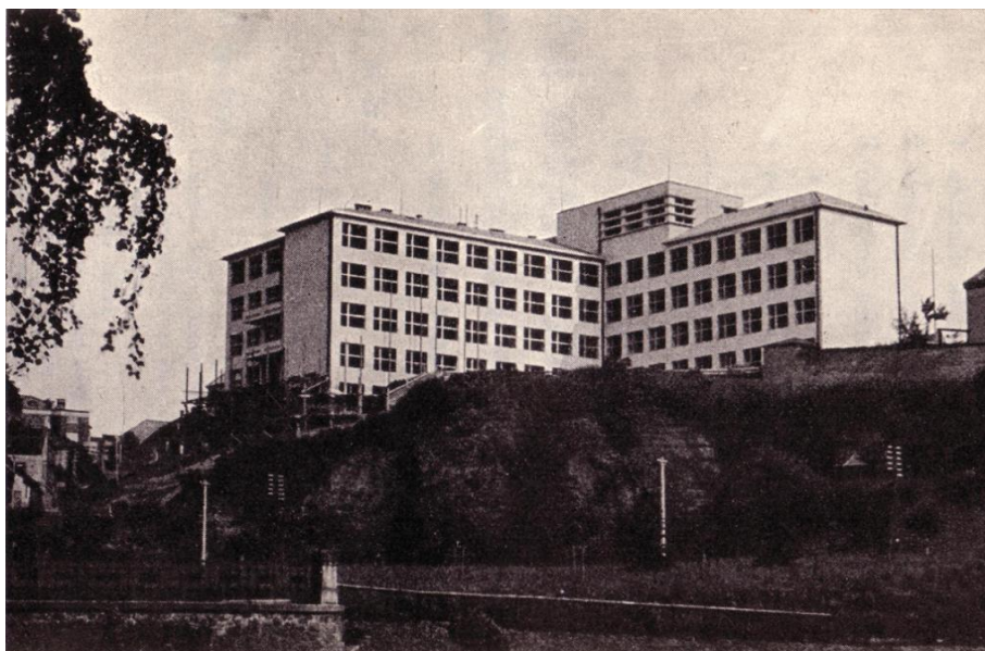
Pohled na budovu školy z lesoparku Štěpánka

Rovněž postsekundární vzdělávání prošlo nezanedbatelnými proměnami. Na konci padesátých let to bylo nejdříve dvouleté večerní studium pro absolventy SVVŠ, které se od školního roku 1960/61 mění ve studium denní, zakončené maturitní zkouškou v oboru všeobecná ekonomika. V průběhu osmdesátých let se tato forma studia transformovala ve dvouleté pomaturitní studium kvalifikační, obor výpočetní technika a zpracování informací. Obor tohoto zaměření byl jediný v oblasti a byl o něj velký zájem. Novelou školského zákona byla tato forma pomaturitního studia zrušena.