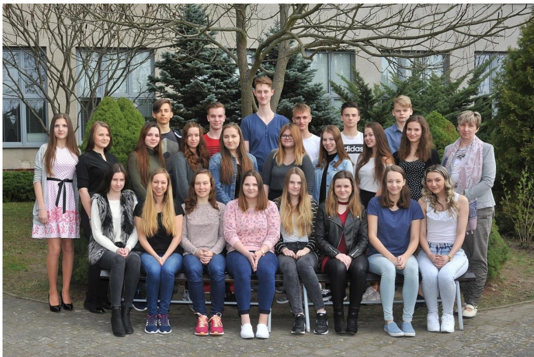
Obchodní akademie Mladá Boleslav 2016 - 2017