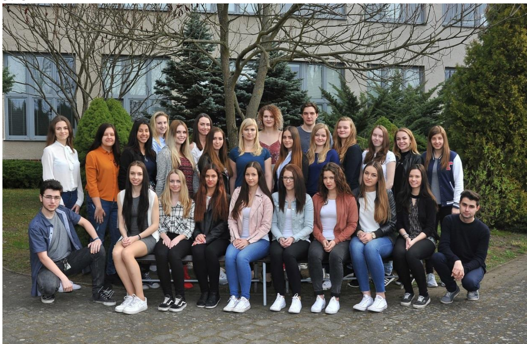
Obchodní akademie Mladá Boleslav 2016 - 2017