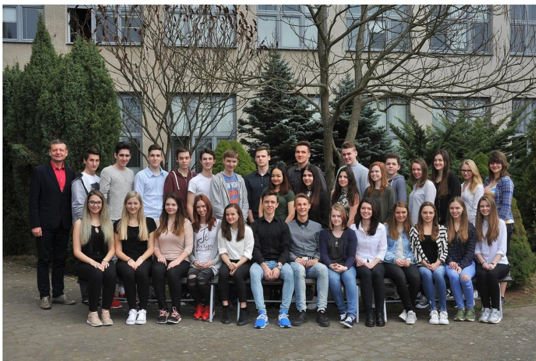
Obchodní akademie Mladá Boleslav 2016 - 2017