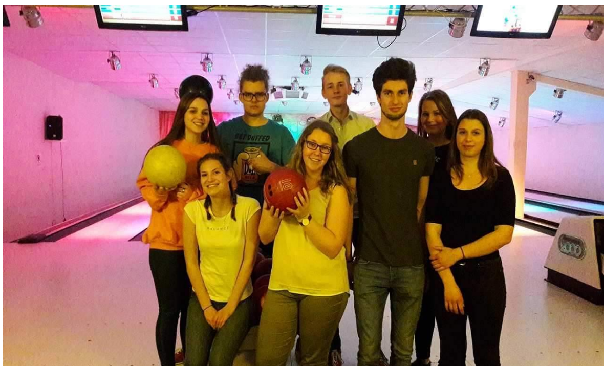
Výměnný pobyt Gifhorn