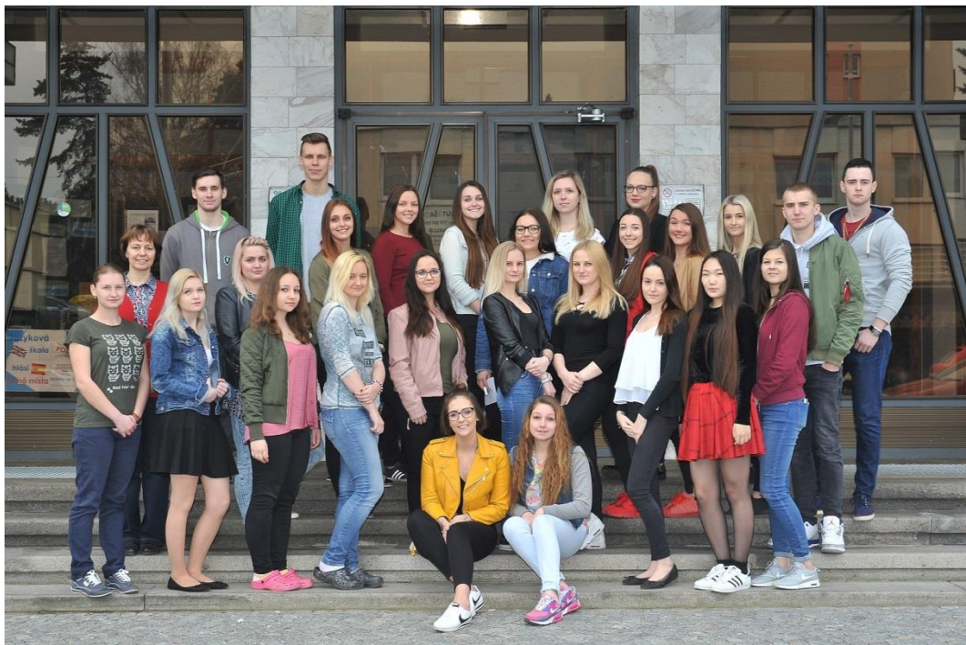
Obchodní akademie Mladá Boleslav 2016 - 2017