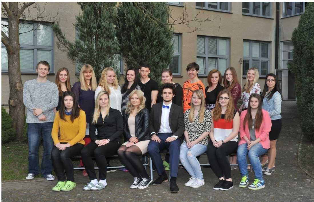
Obchodní akademie Mladá Boleslav 2016 - 2017