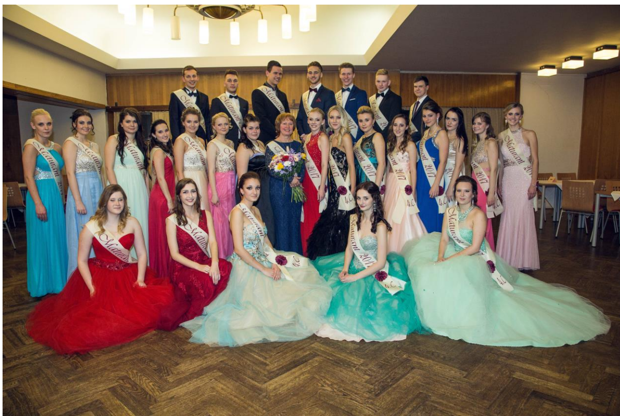
Maturitní ples 2016/2017