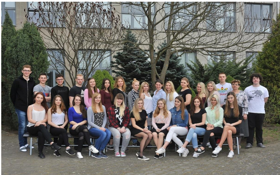
Obchodní akademie Mladá Boleslav 2016 - 2017