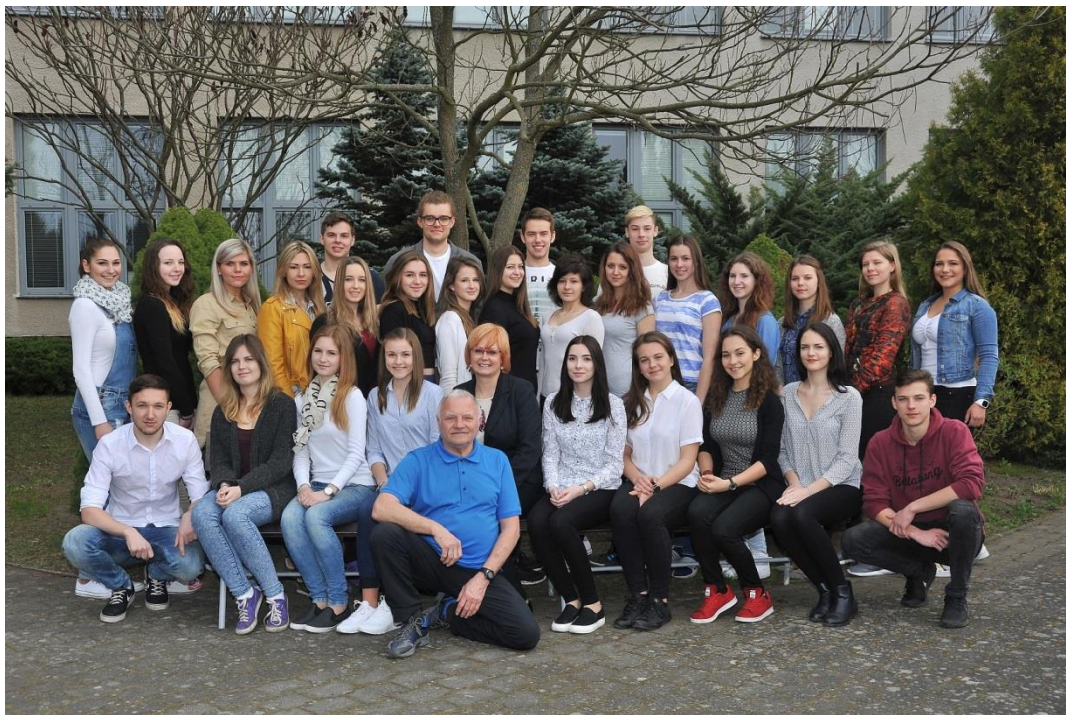
Obchodní akademie Mladá Boleslav 2016 - 2017