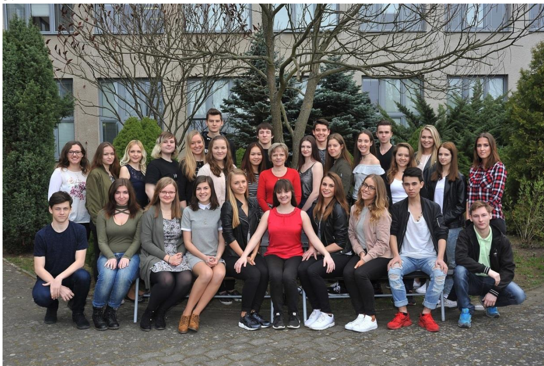
Obchodní akademie Mladá Boleslav 2016 - 2017