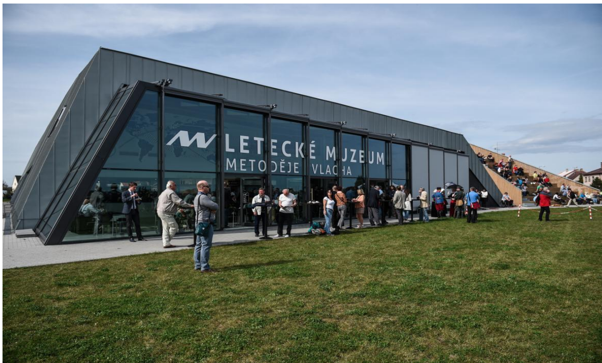
Letecké muzeum M. Vlacha

Poznávání Mladé Boleslavi a jejího okolí se konalo dne 29. června 2017. Žáci navštívili různé historické objekty nebo naučné expozice – palác Templ, Muzeum Mladoboleslavska, kosmonoskou Loretu, Městské divadlo, Letecké muzeum M. Vlacha, židovský hřbitov aj.