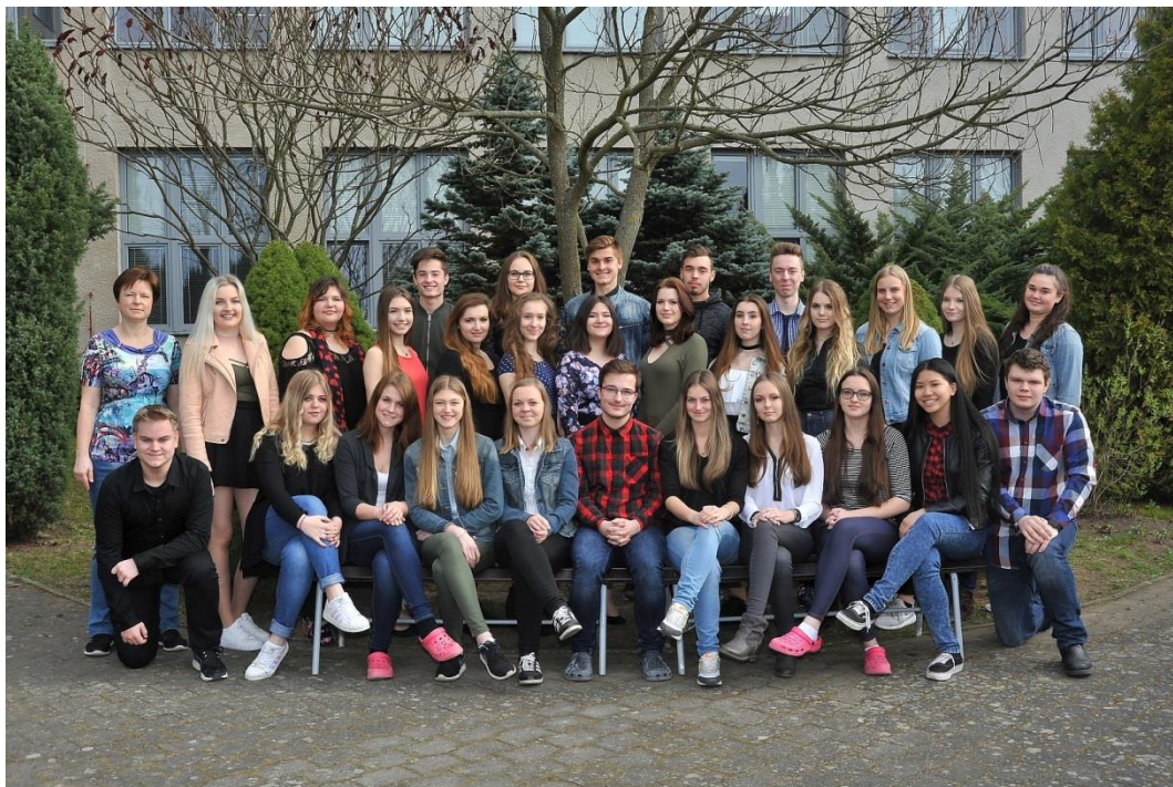
Obchodní akademie Mladá Boleslav 2016 - 2017