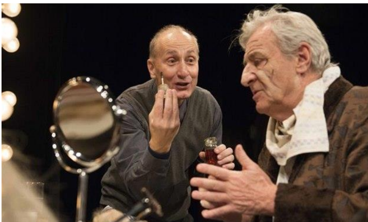
Divadelní představení Garderobiér

I v tomto školním roce se zájemci ze všech tříd účastnili divadelního abonentního cyklu ve zdejším Městském divadle. V rámci Divadelního dne studenti zhlédli hru Ronalda Harwooda Garderobiér.