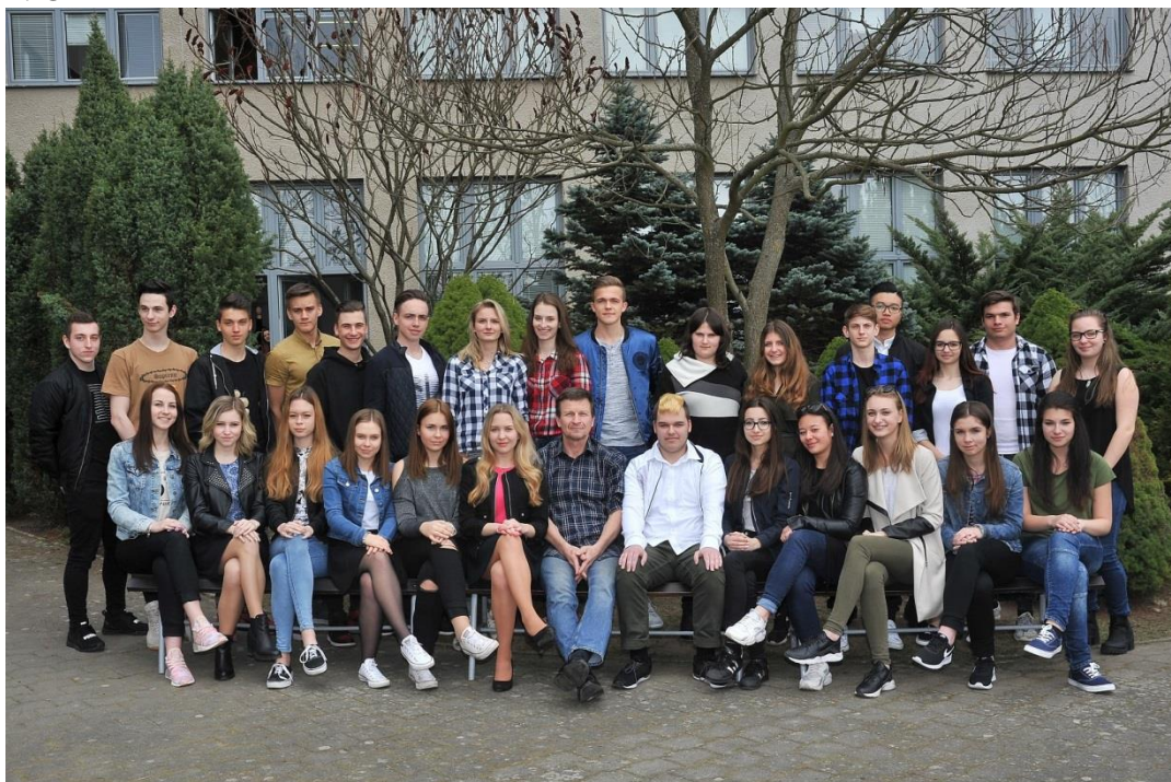
Obchodní akademie Mladá Boleslav 2016 - 2017