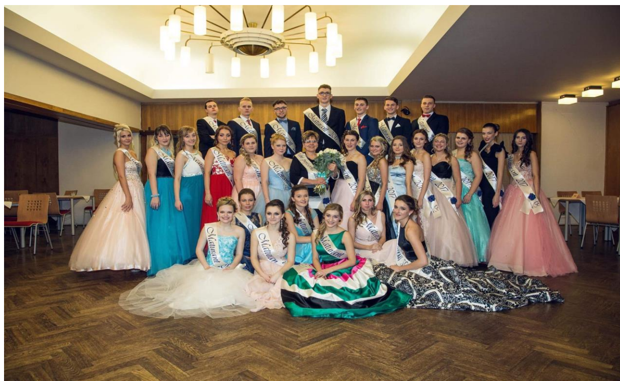
Maturitní ples 2016/2017