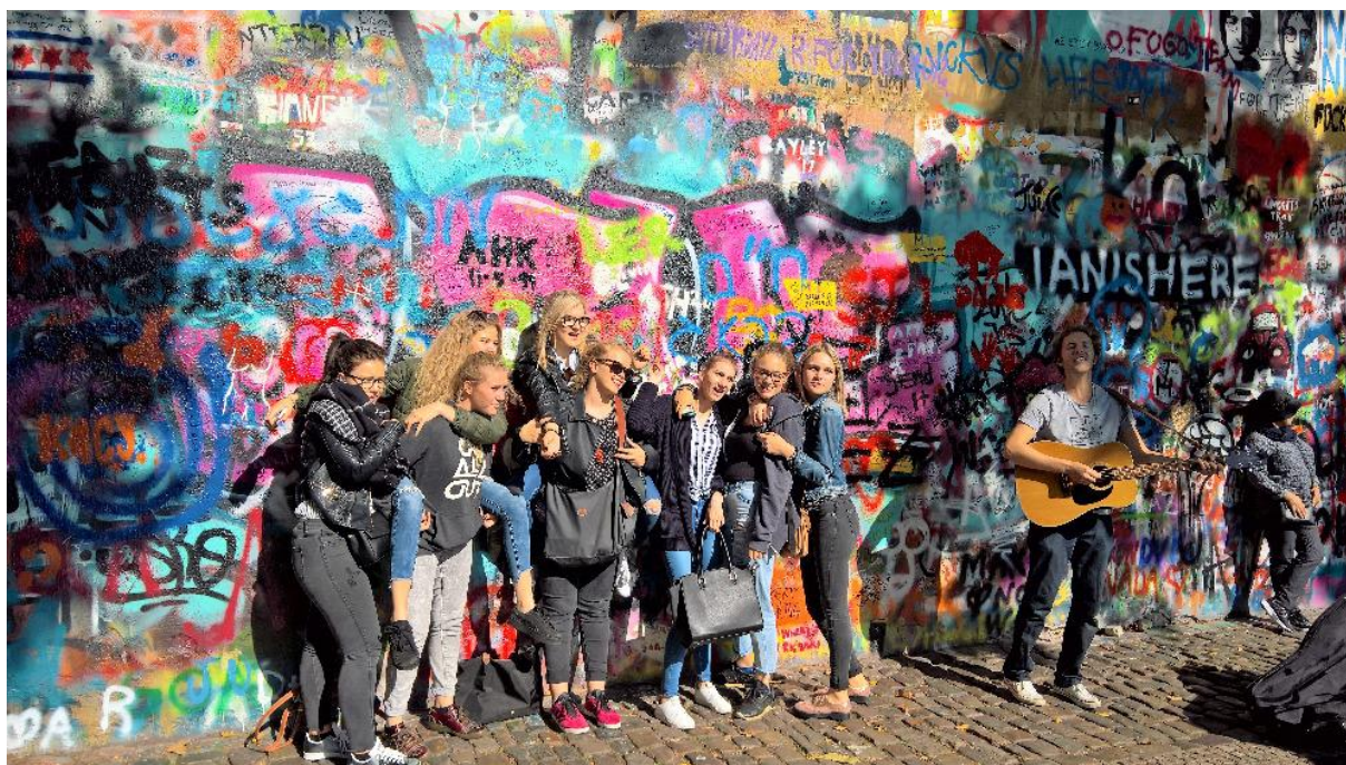
Francouzi u nás