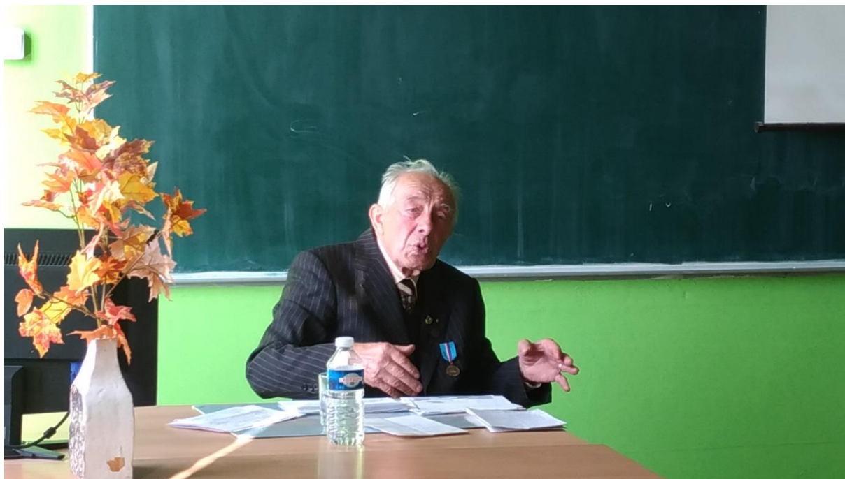
Beseda s politickým vězněm

Spolupráce se zřizovatelem, obcí, sociálními partnery, úřady práce, zaměstnavateli a sociálními partnery