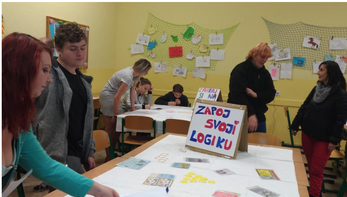
Dny otevřených dveří