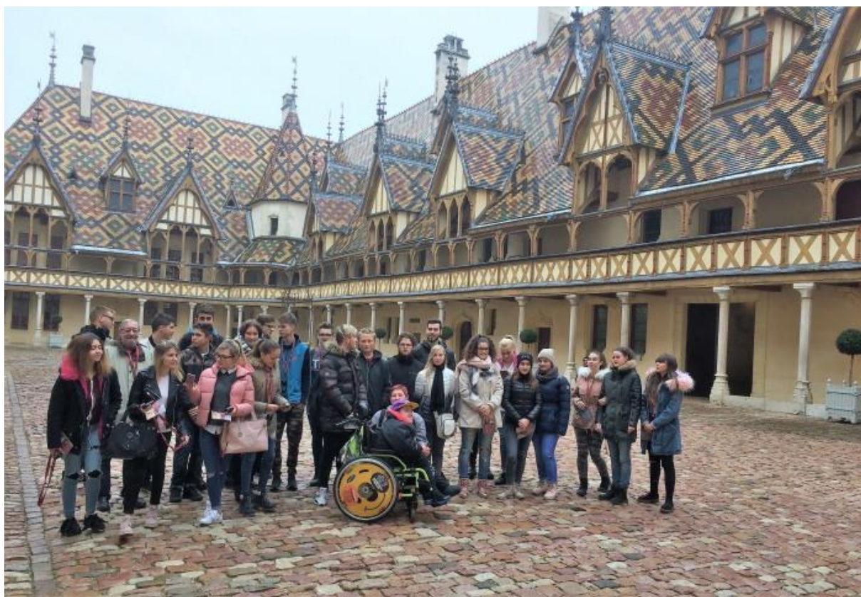
My ve Francii