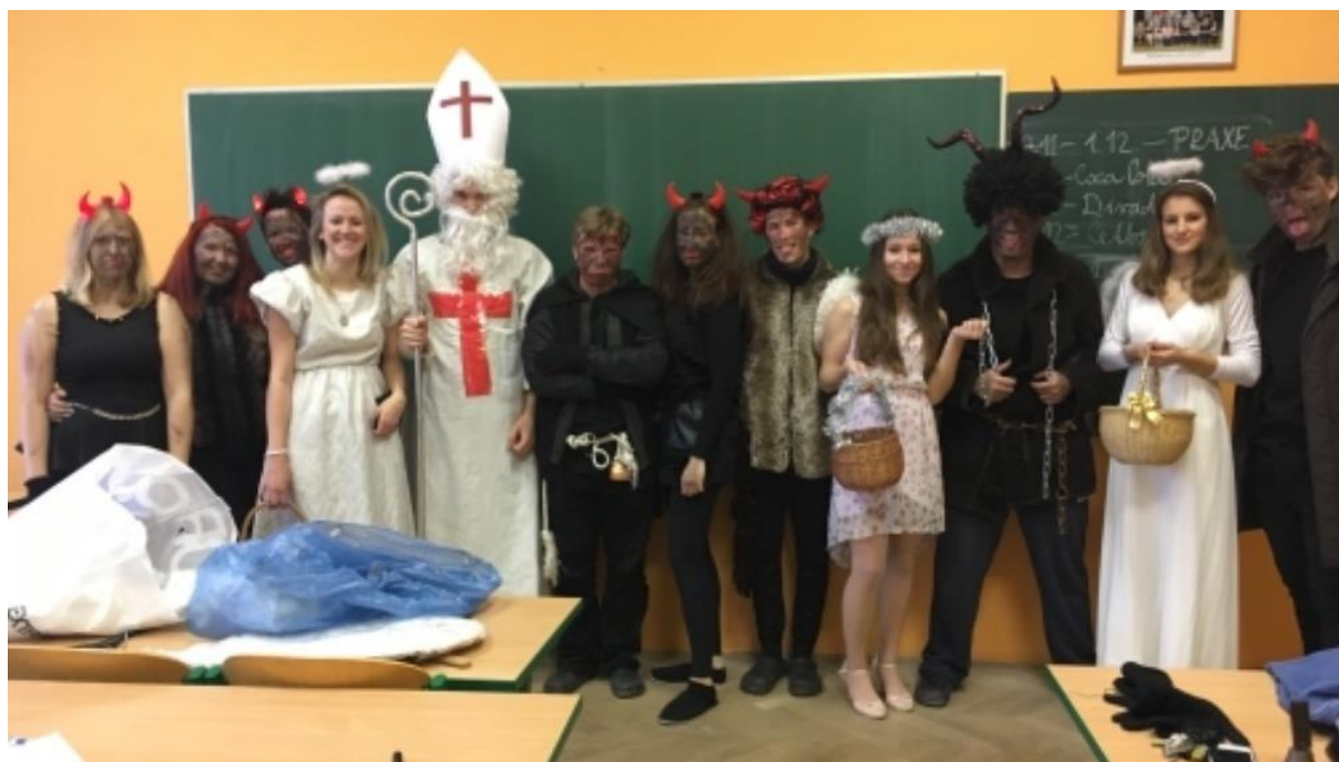
Mikuláš pro MŠ v Liblicích