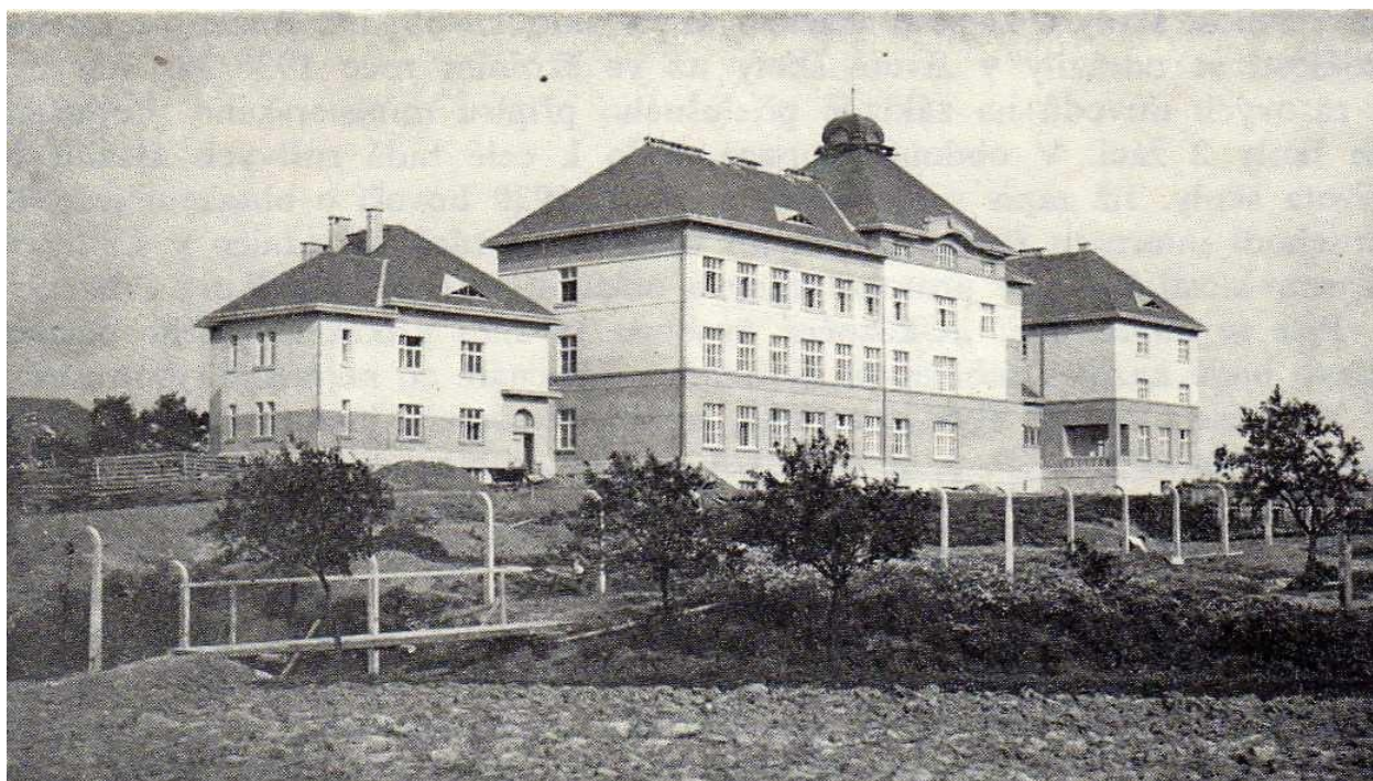
Budova liblické školy krátce po dokončení