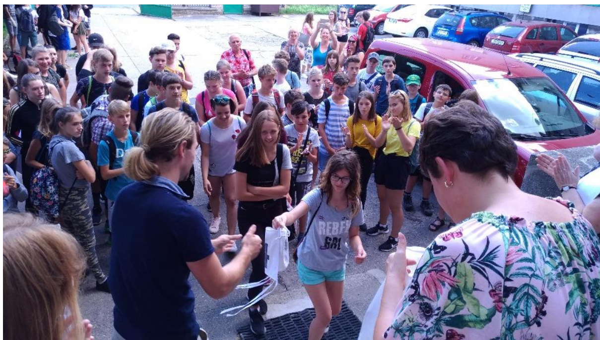
Projektový den pro ZŠ