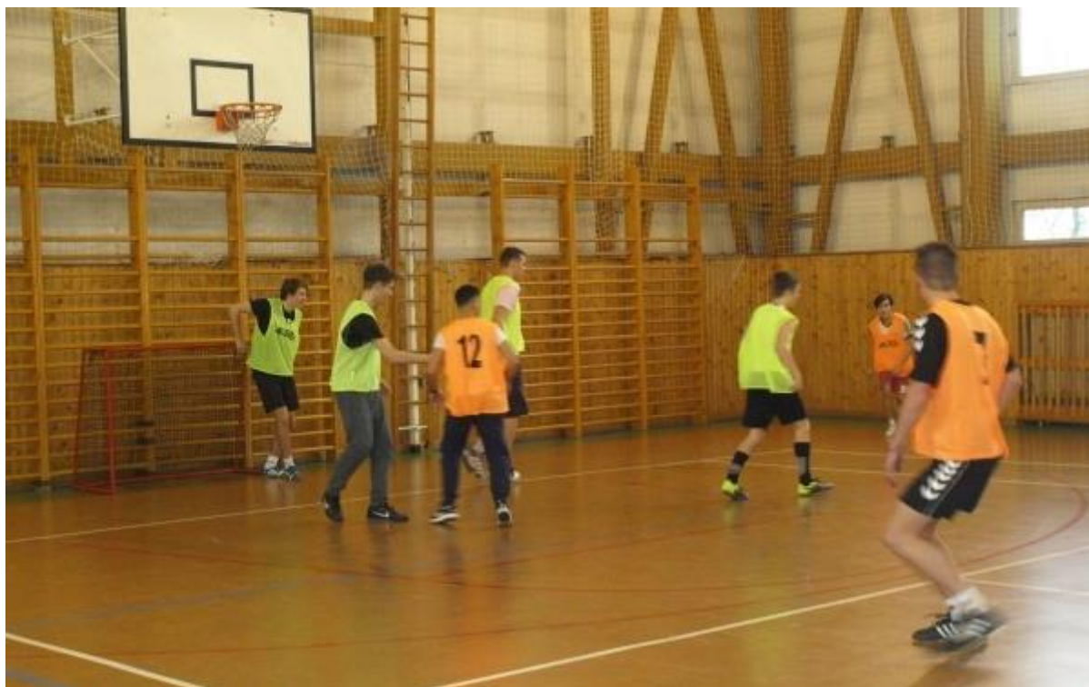
Vánoční fotbalový turnaj, prosinec 2018