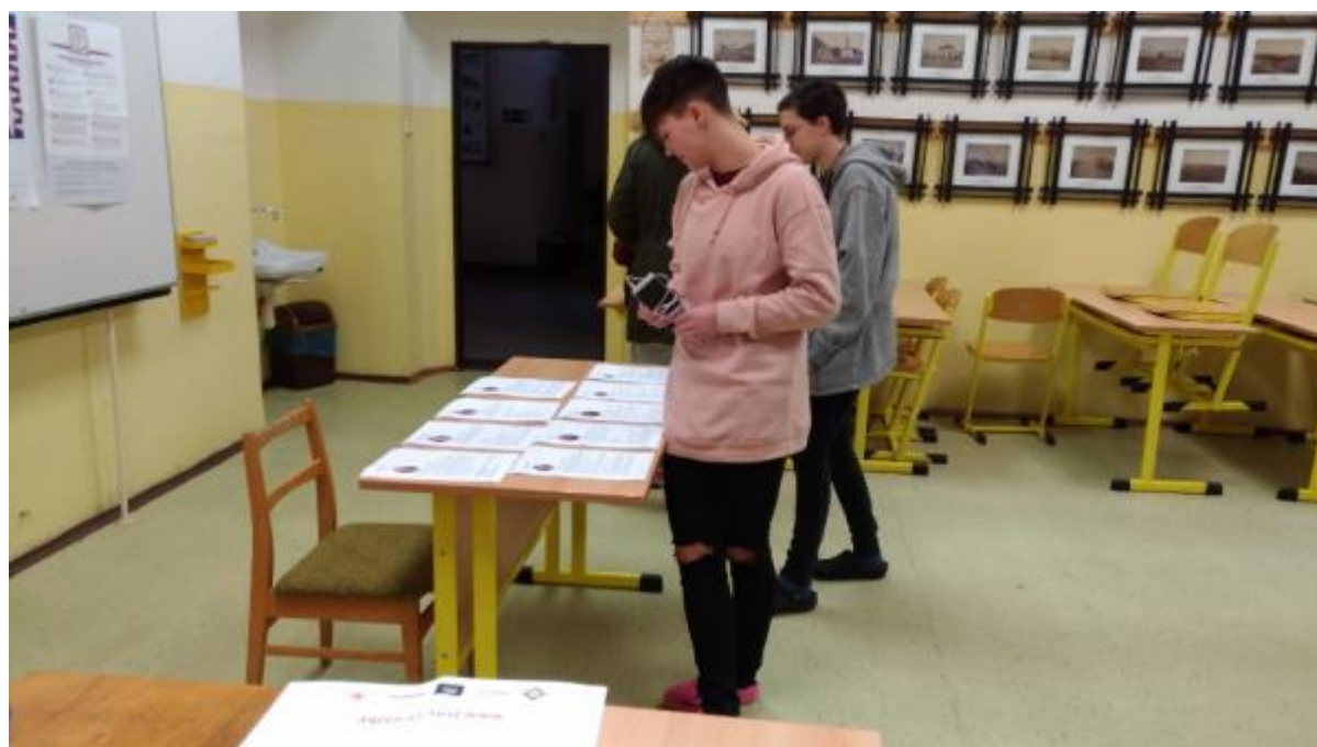
Studentské prezidentské volby