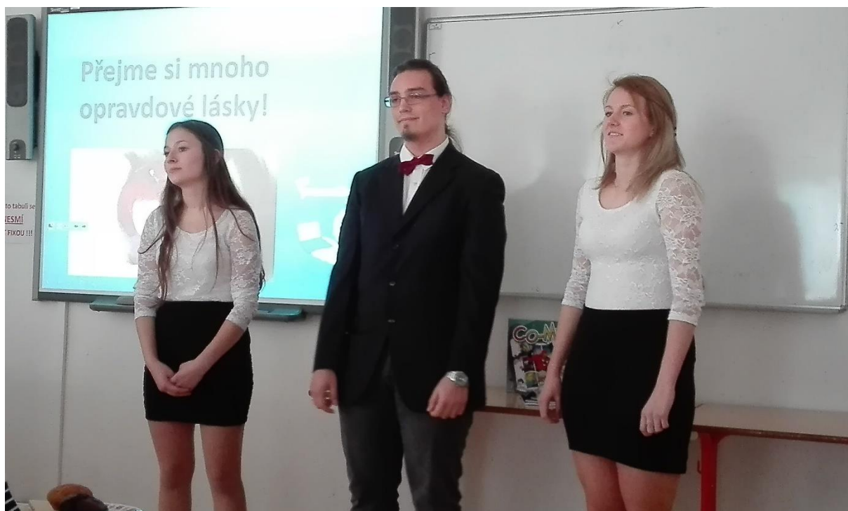
Prezentiáda, duben 2018