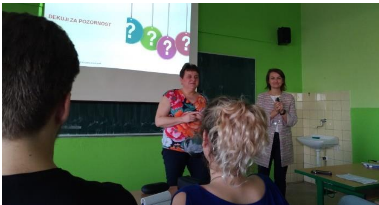
Spolupráce se zaměstnavateli