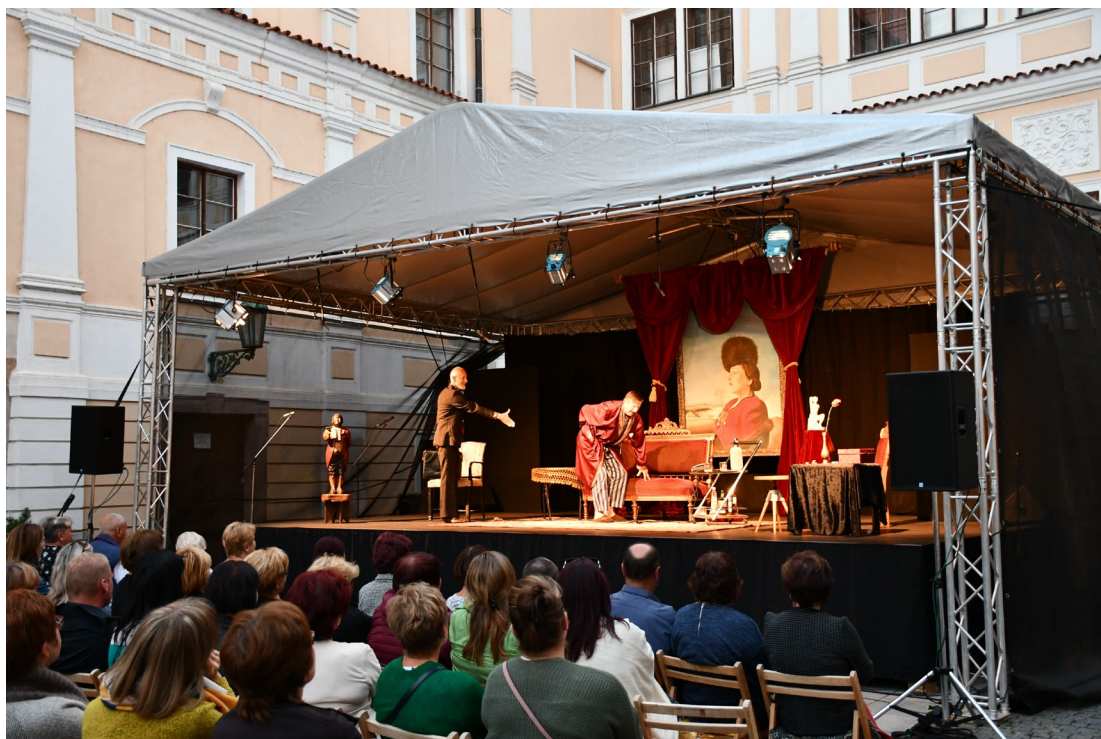
Obr. 15 Divadelní představení Blbec k večeri na nádvoří vlašimského zámku