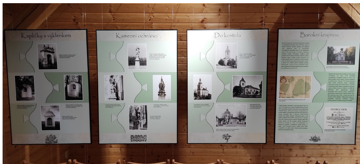
Obr. 10 Výstava Baroko na Podblanicku – drobné sakrální stavby v Domě přírody Blaník