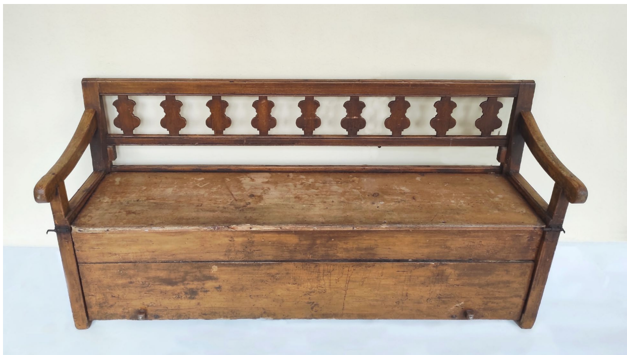
Obr. 3 Dřevěná selská lavice s opěradlem z Údolnice z přelomu 19. a 20. stol. je jedním z darů, které rozšířily sbírky Muzea Podblanicka, p. o., v roce 2022