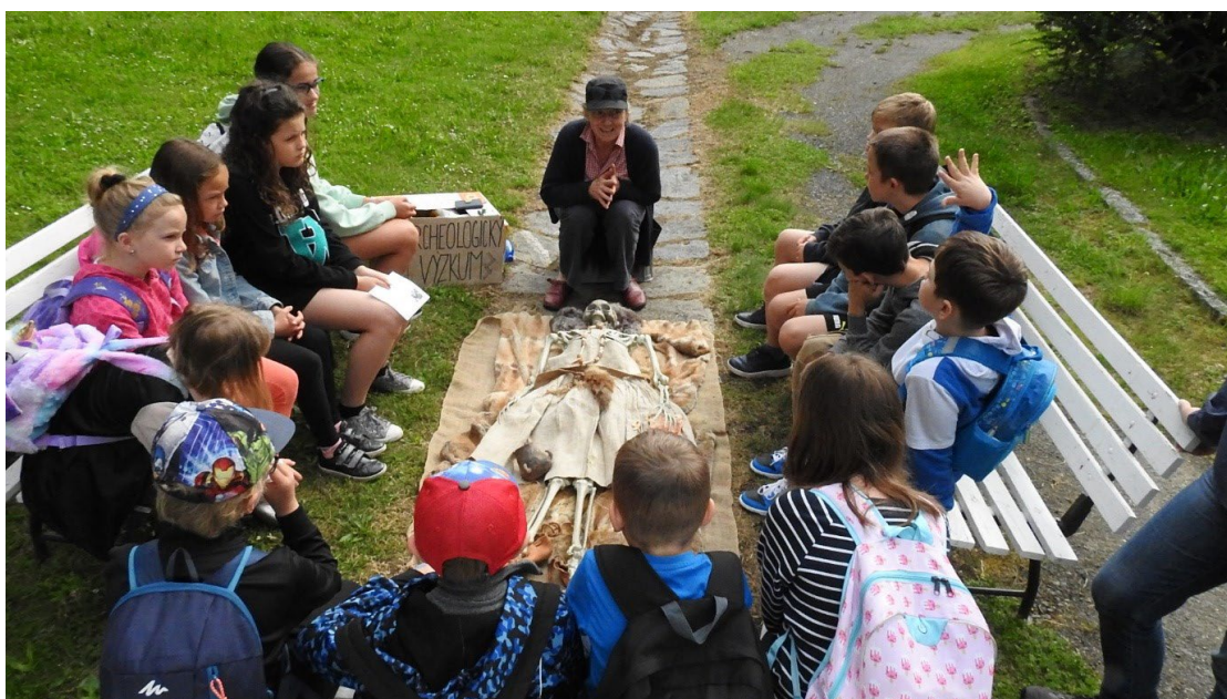
Obr. 19 Edukační program v zámku Růžkovy Lhotice