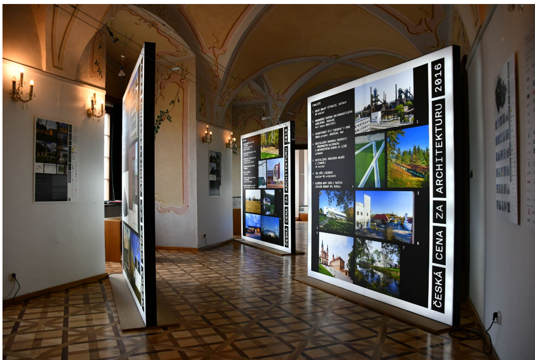
Obr. 9 Instalace výstavy Česká cena za architekturu 2021 v zámku ve Vlašimi