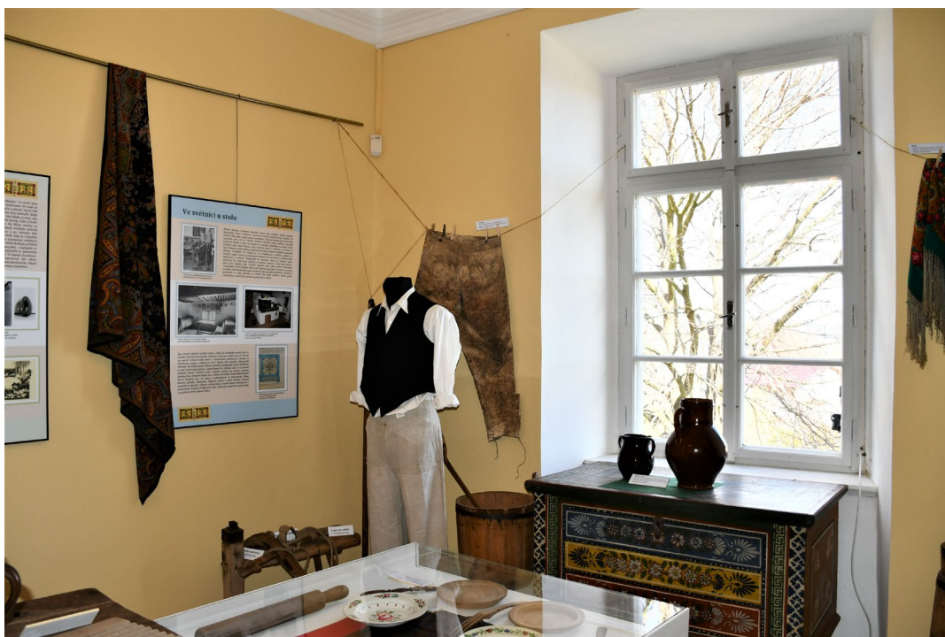
Obr. 8 Výstava V chalupách pod Bláníkem v zámku Růžkovy Lhotice