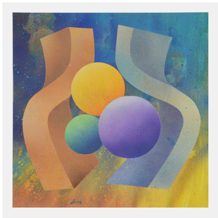
Obr. 2 Obraz Václava Stárka s názvem Potkávání je dalším z předmětů, které obohatily sbírky Muzea Podblanicka, p. o., v roce 2022