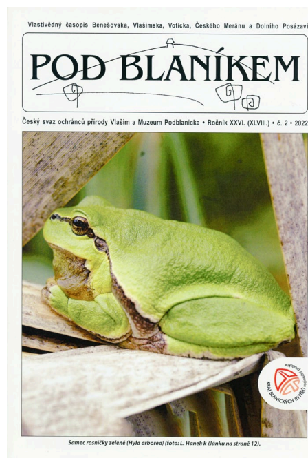
Obr. 23-24 1. a 2. číslo 26. ročníku časopisu Pod Blaníkem