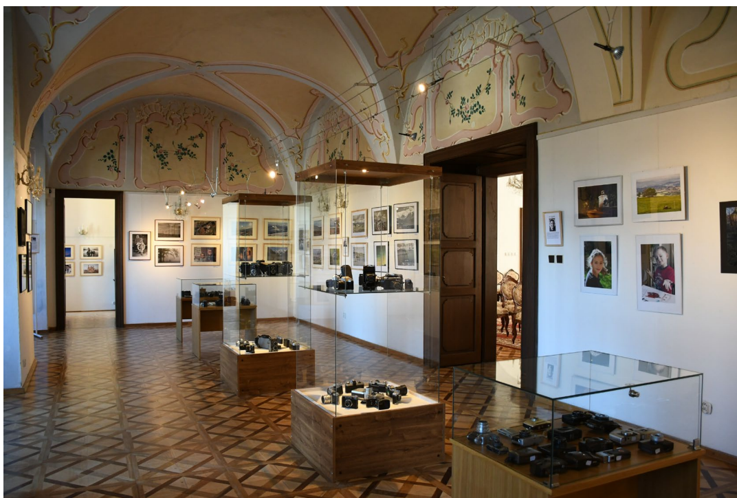
Obr. 6 Instalace výstavy Svět očima vlášimského fotoklubu ve vlášimském zámku

pozn. 1) Návštěvnost výstav, které muzeum v roce 2022 spolupřádalo ve spolupráci s jinými institucemi mimo prostory muzea, není muzeem vykazována.