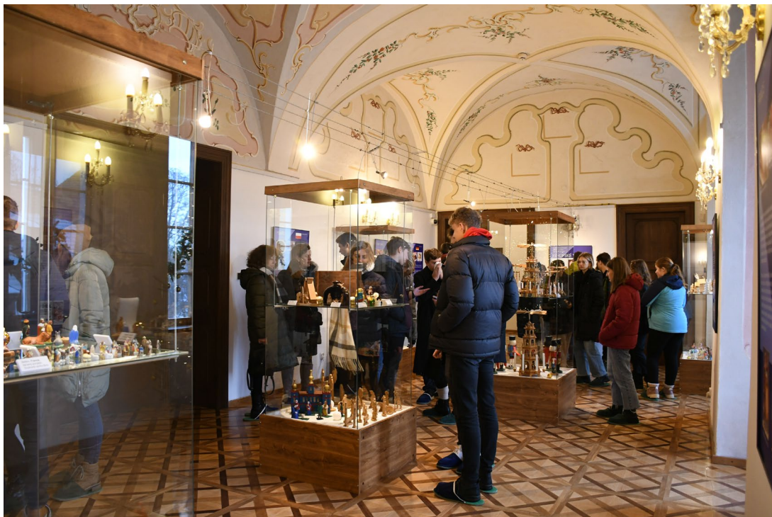
Obr. 20 Komentovaná prohlídka výstavy Evropské vánoce v zámku ve Vlašimi

Významným počinem Muzea Podblanicka, p. o., v roce 2022 bylo spolupořádání odborné konference Cvičiště SS Böhmen. Paměť zdevastované krajiny ve středních Čechách společně s Ústavem pro studium totalitních režimů a Státním oblastním archivem v Praze. Konference se uskutečnila ve dnech 1.-3.11.2022 v prostorách Vojenské zotavovny Měřín – hotel Superior***, Jablonná nad Vltavou u příležitosti 80 let, které uplynuly od vytvoření vojenského prostoru SS s oficiálním názvem SS-Truppenübungsplatz Beneschau (později SS-Truppenübungsplatz Böhmen) jižně od Prahy. Byla primárně určena pro odbornou veřejnost, část akce byla ale také zaměřena i pro laickou veřejnost z regionu a pedagogy. V rámci konference vystoupili přední odborníci na sledovanou problematiku z celé České republiky a ve svých příspěvcích shrnuli aktuální stav současného poznání a také nastínili možnosti dalšího vývoje bádání. Konference se zúčastnilo celkem 76 osob. Nad Konferencí převzali záštitu ministr kultury ČR Mgr. Martin Baxa a hejtmanka Středočeského kraje Mgr. Petra Pecková.