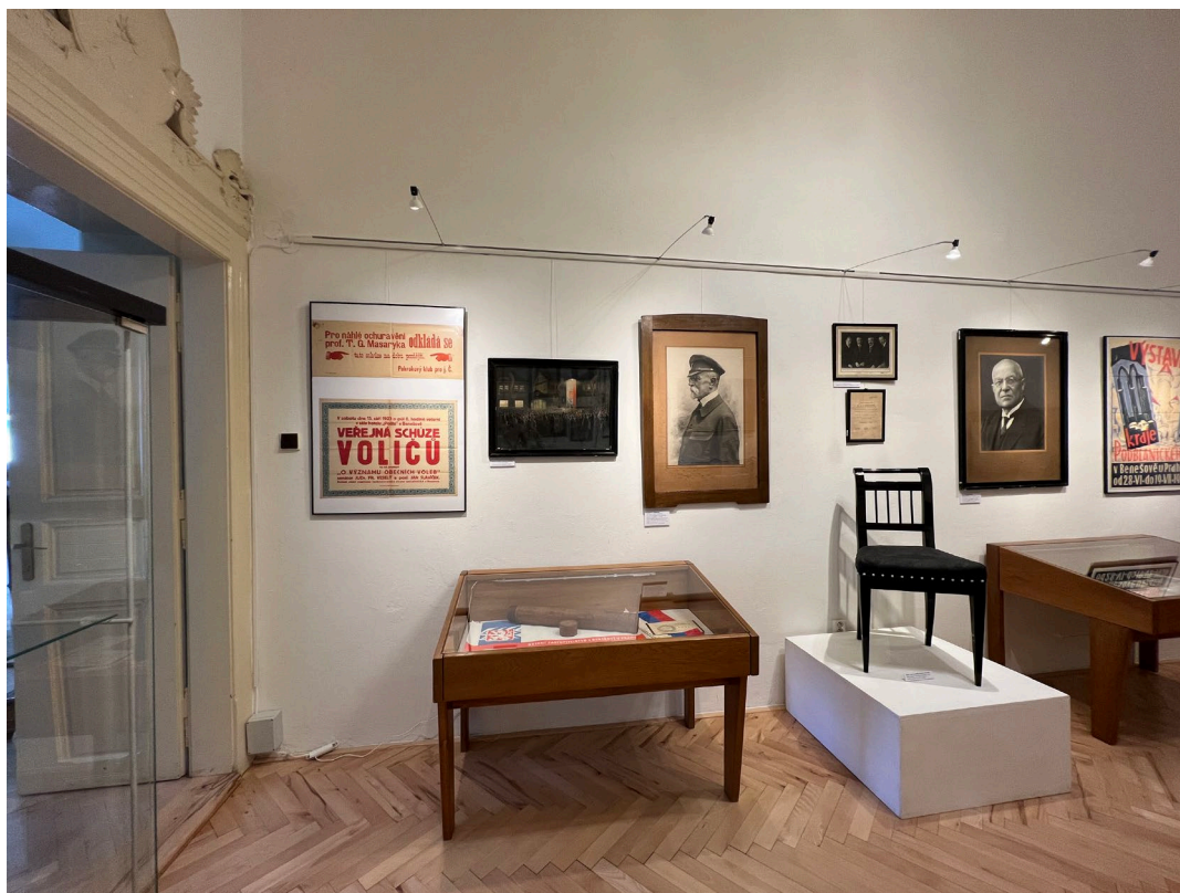
Obr. 7 Instalace výstavy Benešov, the best of v domě čp. 74 v Benešově