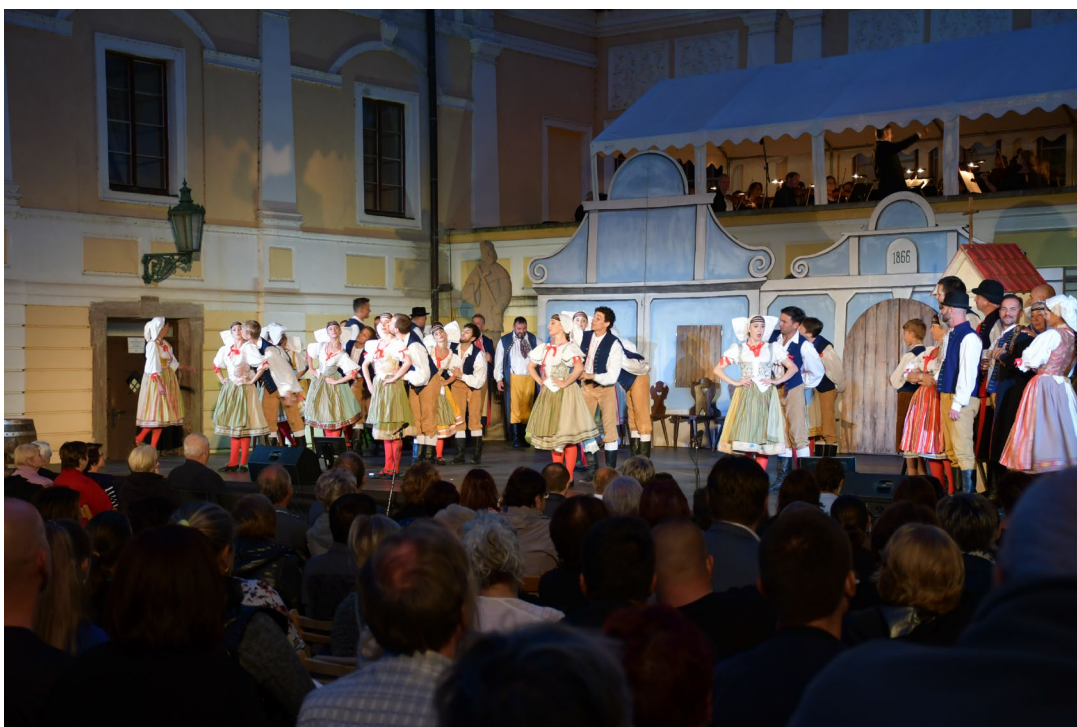
Obr. 16 Operní představení Prodaná nevěsta na nádvoří vlašimského zámku