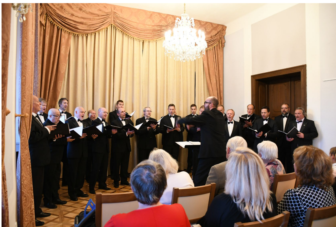
Obr. 17 Koncert Pěveckého sdružení moravských učitelů ve vlašimském zámku