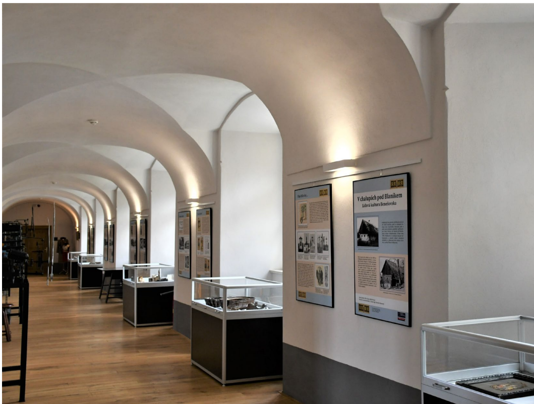
Obr. 11 Výstava V chalupách pod Bláníkem v klášteře sv. Františka ve Voticích