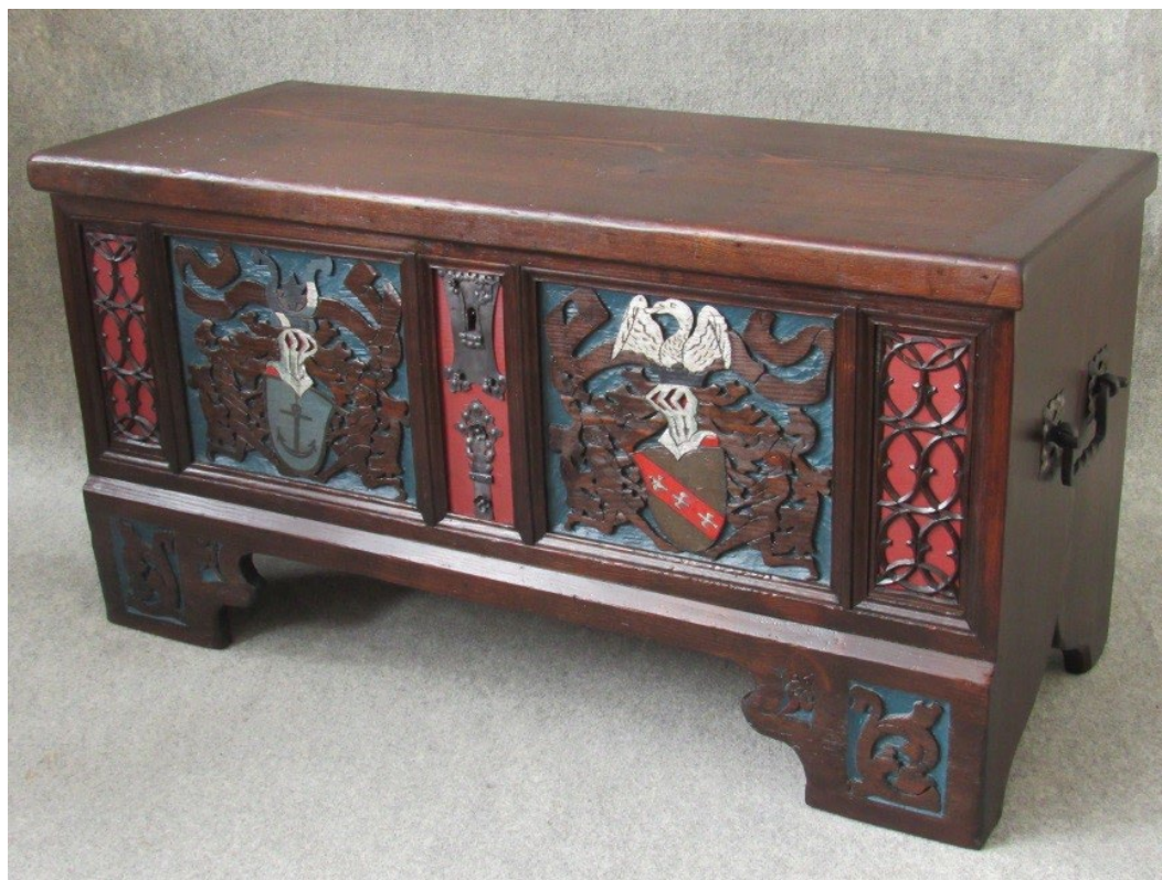
Obr. 4 Zrestaurovaná truhla s heraldickou výzdobou v historizujícím slohu (inv. č. 3105)

Knihovna, fotoarchiv muzea a jednotliví odborní muzejní pracovníci ve sledovaném roce vykázali celkem 48 badatelských návštěv.