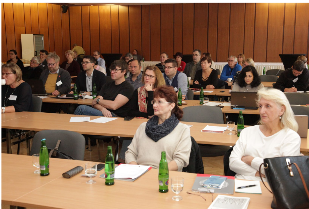
Obr. 21-22 Konference Cvičiště SS Böhmen