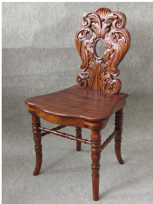
Obr. 5 Zrestaurovaná dřevěná vyřezávaná židle zdobená akantovým motivem (inv. č. 2996)